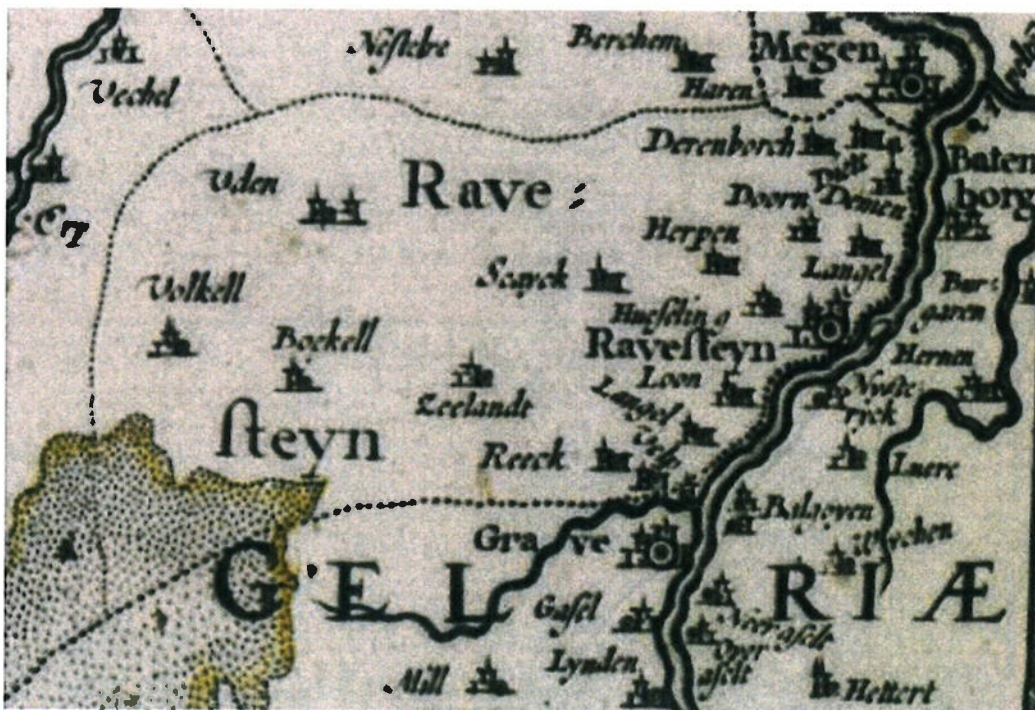
Het land van Ravestein, inclusief de de dorpen Schaijk, Reek en Zeeland omstreeks 1622 op de kaart van N. I. Visscher uit 1642.

In opdracht van : AGEL adviseurs Auteur : drs. N.C.F. Groot Redactie : dr. A.W.E. Wilbers Projectnummer : 26100111 Versie : 1.0 © Noordwijk, januari 2011