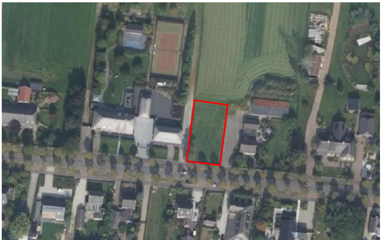
Figuur 1.1: (Globale) ligging plangebied