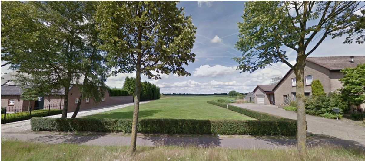
Figuur 4.1: Perceel gezien vanaf straat