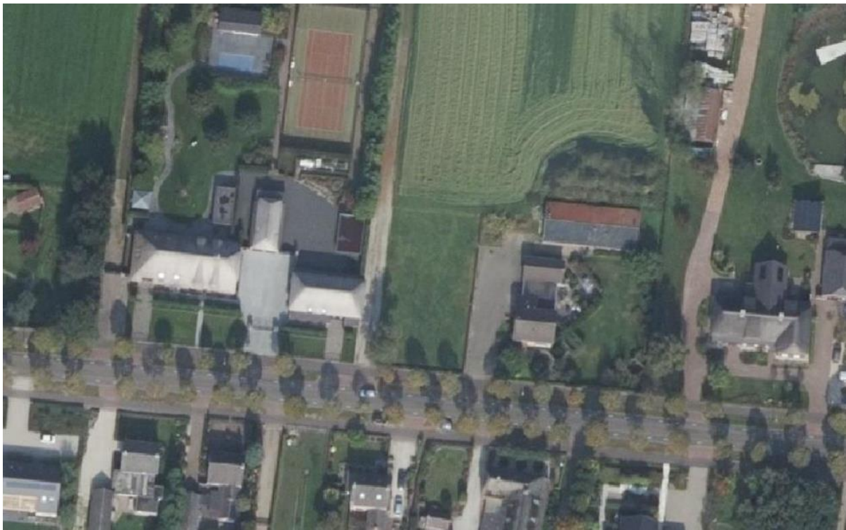
Figuur 4.2: Actuele luchtfoto