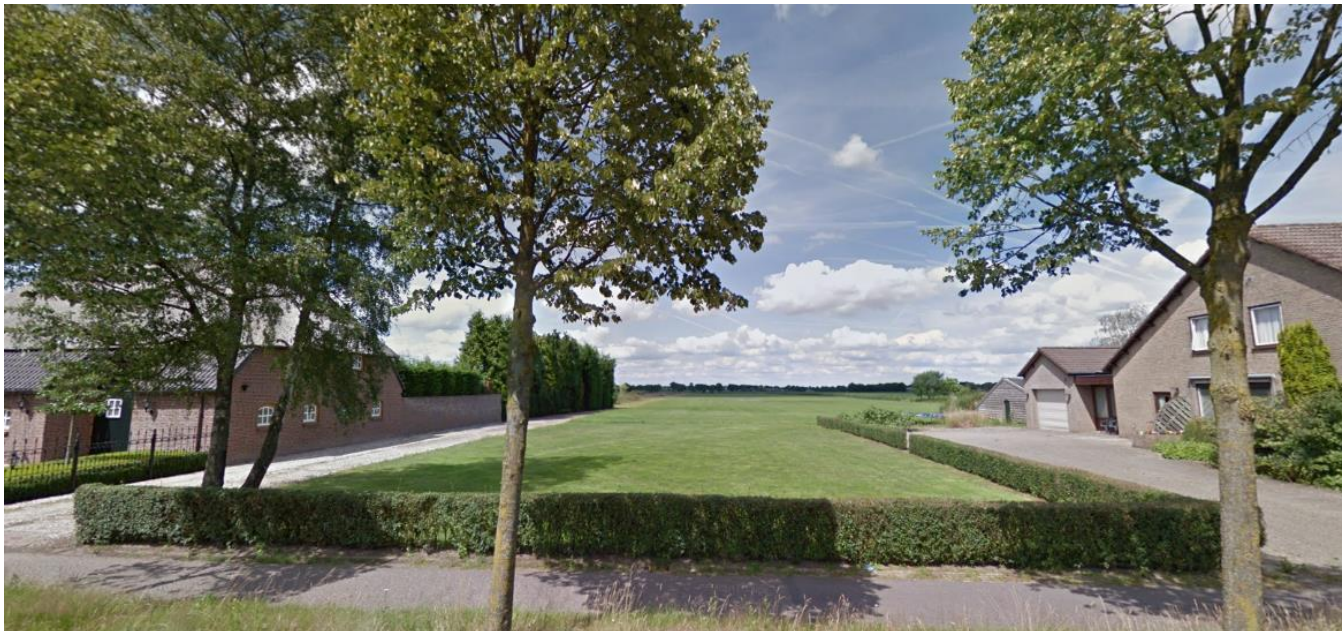
Figuur 2.1: Huidige situatie perceel Pastoor van Winkelstraat ong. (naast nummer 83)

woning en de daarbij horende voorgevelrooilijn. De woning mag een maximale goot- en nokhoogte hebben van respectievelijk 6 en 9 meter. Voor het bijgebouw geldt een maximale goot- en nokhoogte van respectievelijk 3 en 6 meter. Parkeren vindt plaats op eigen terrein.