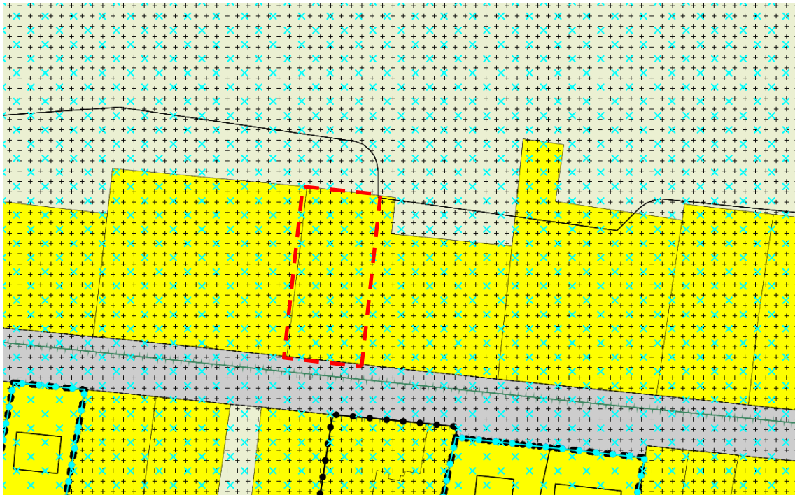
Figuur 1.2: Vigerend bestemmingsplan plangebied

Voor het plangebied zijn bestemmingsplan 'Buitengebied' (vastgesteld 12 november 2014) en 'Buitengebied, herziening 1' (vastgesteld 1 oktober 2015) van de gemeente Landerd de geldende bestemmingsplannen (zie figuur 1.2). Ter plaatse gelden de bestemming 'Wonen', de dubbelbestemmingen 'Waarde – Archeologie 2' en 'Waarde – Archeologie 4' en tot slot de gebiedsaanduiding 'reconstructiewetzone – verwevingsgebied'.