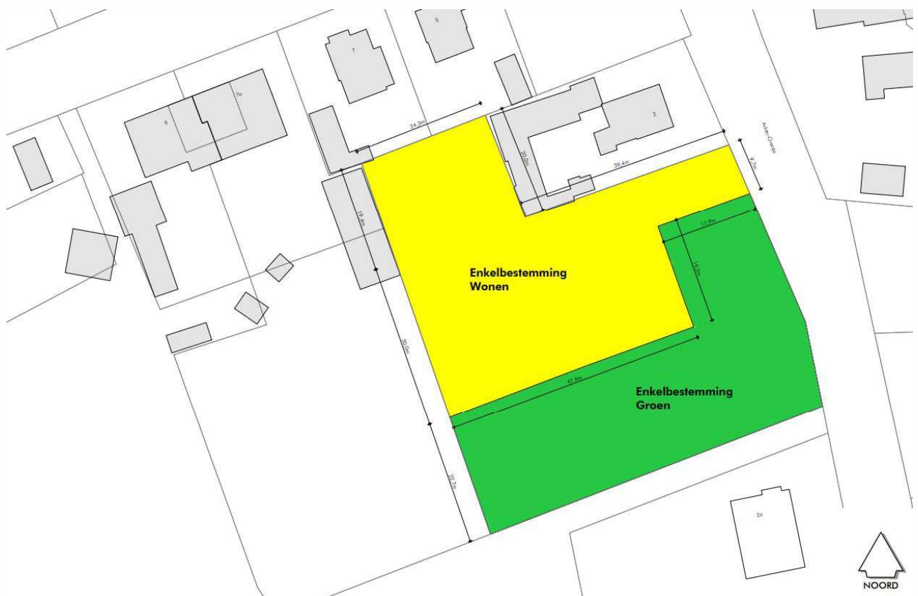
Figuur 3.1. Schets van de voorgestane situatie.

Aan de achterzijde van de woning aan Voor-Oventje 7, wordt een woning gerealiseerd (zie figuur 3.1; zuidelijke gele deel). Deze woning zal worden ontsloten via de weg Achter-Oventje. De vegetatie wordt waar nodig verwijderd. Het perceel wordt gesplitst (zie rode lijn figuur 3.1). Het noordelijke (gele) deel wordt bij Voor-Oventje 7 betrokken. Het zuidelijke (groene) deel en het noordelijke gele deel blijven ongewijzigd.