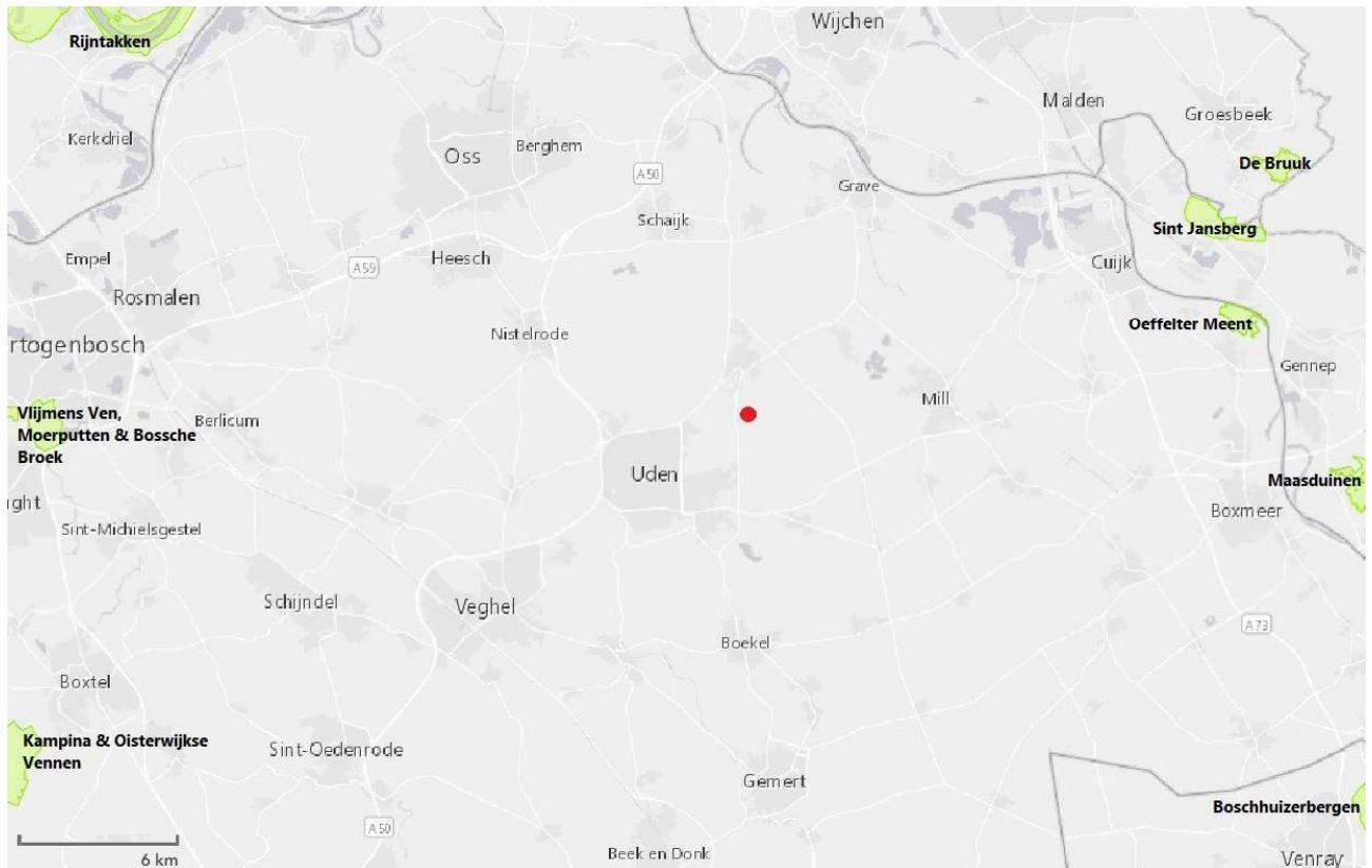
Figuur 4.2. Ligging van het plangebied (rode stip) ten opzichte van Natura-2000 gebieden (groen weergegeven).