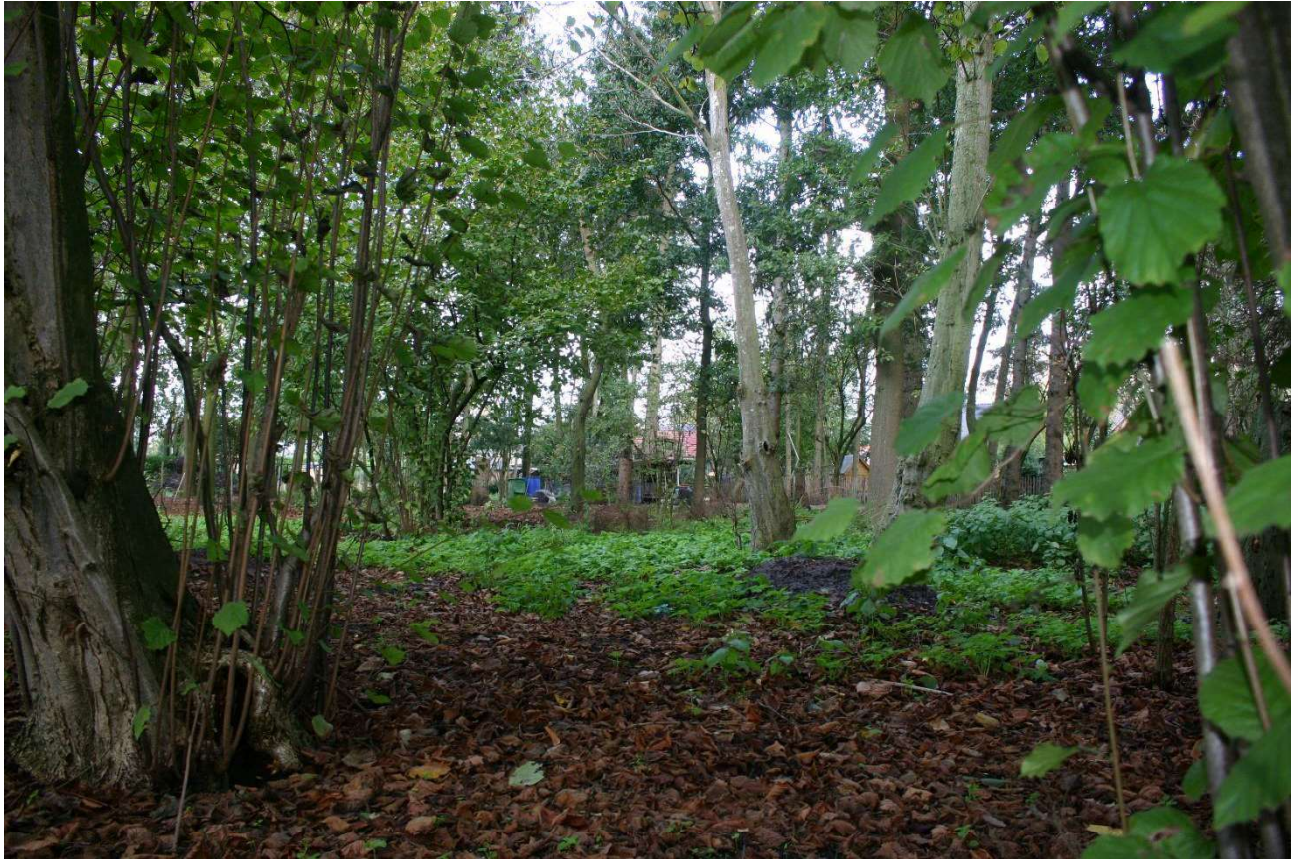
Figuur 4.4. Ook naast het plangebied, in het bosgebied, is vrijwel geen dekking voor marterachtigen.