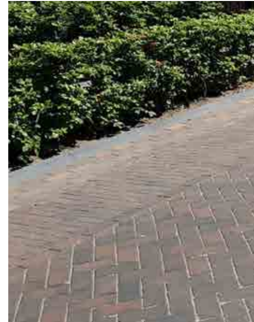
Gebakken straatstenen voor het erf, de toegangsweg en de parkeerplaatsen