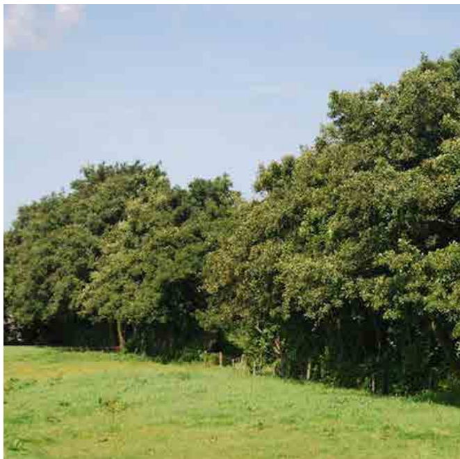
Bestaande bomenrij verdichten met bosplantsoen: Sleedoorn, Hondсроos en Kardinaalsmuts