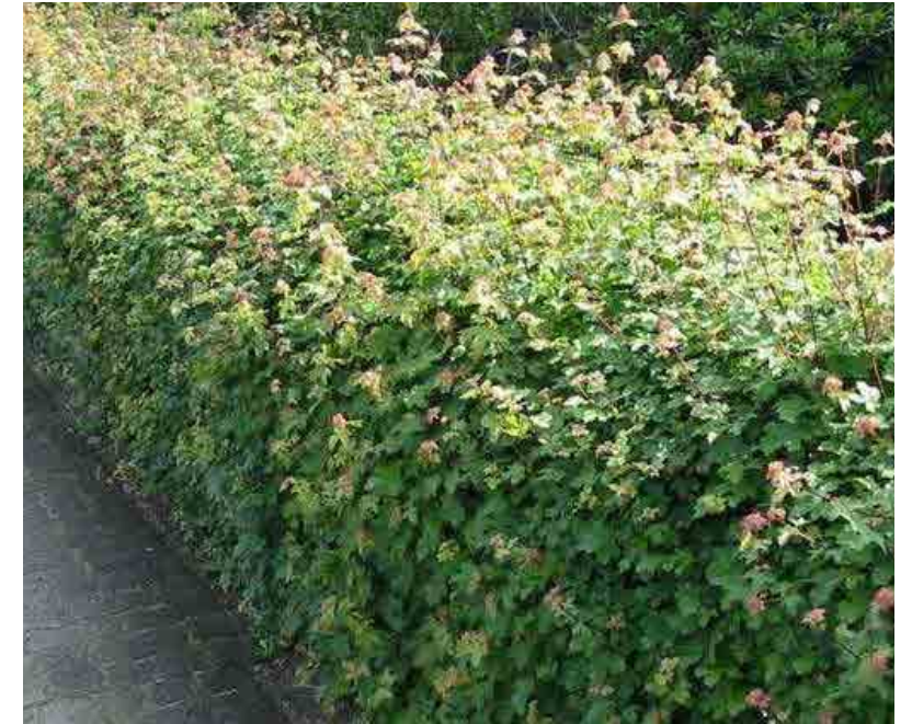
Veldesdoorn als erfafscheiding openbaar - privé