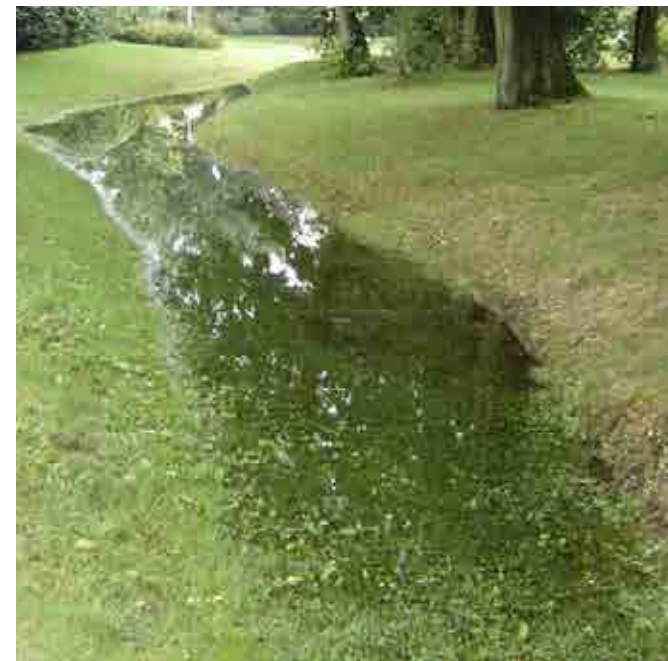
Open groene ruimte gebruiken voor waterberging