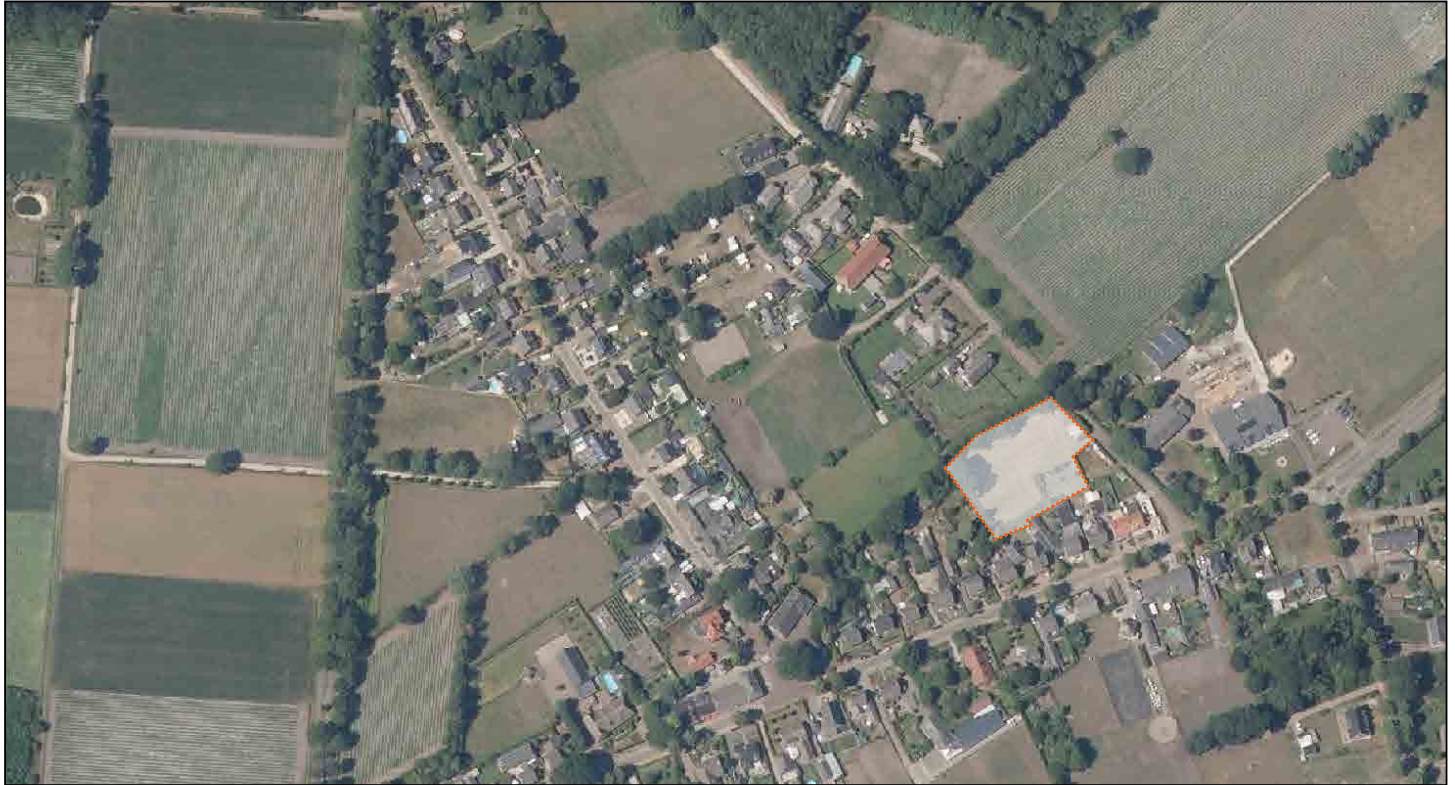
Analyse: luchtfoto en ligging plangebied