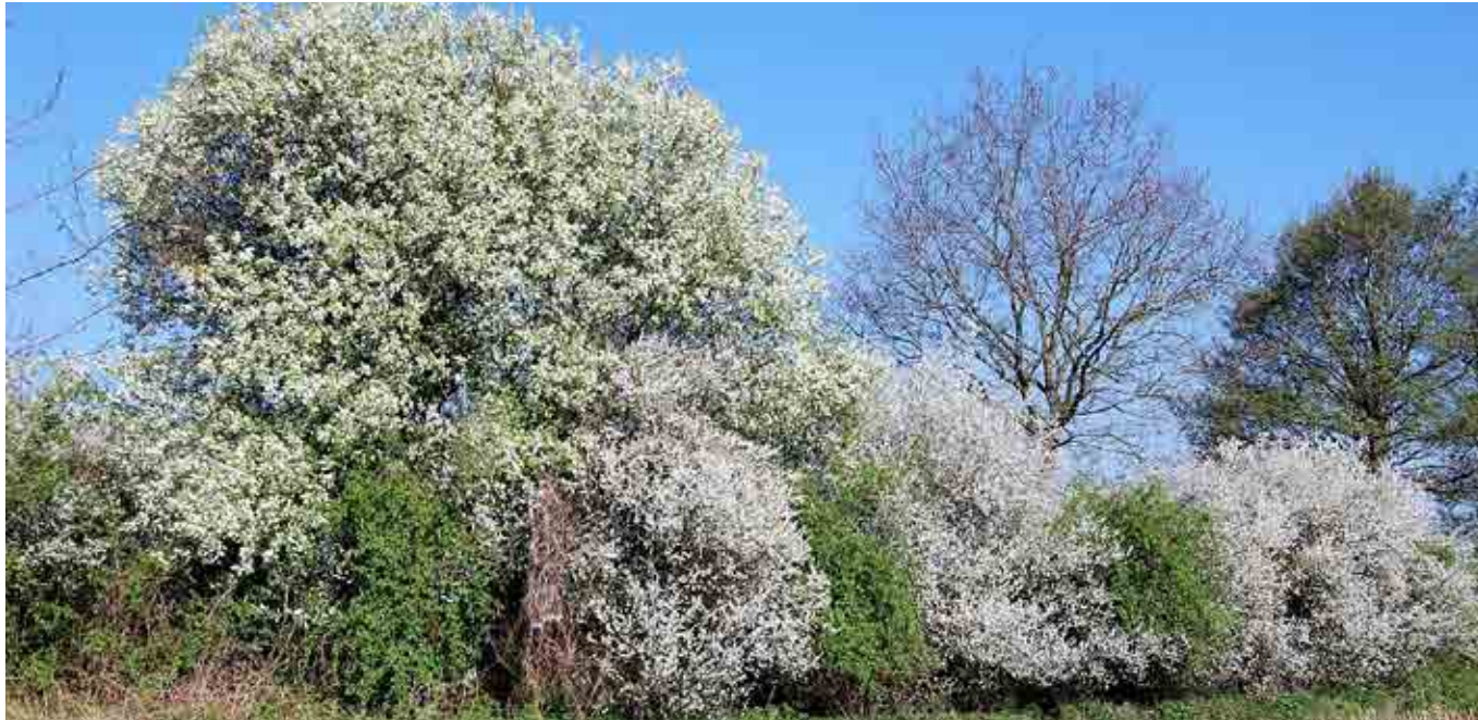
Houtwal met Sleedoorn