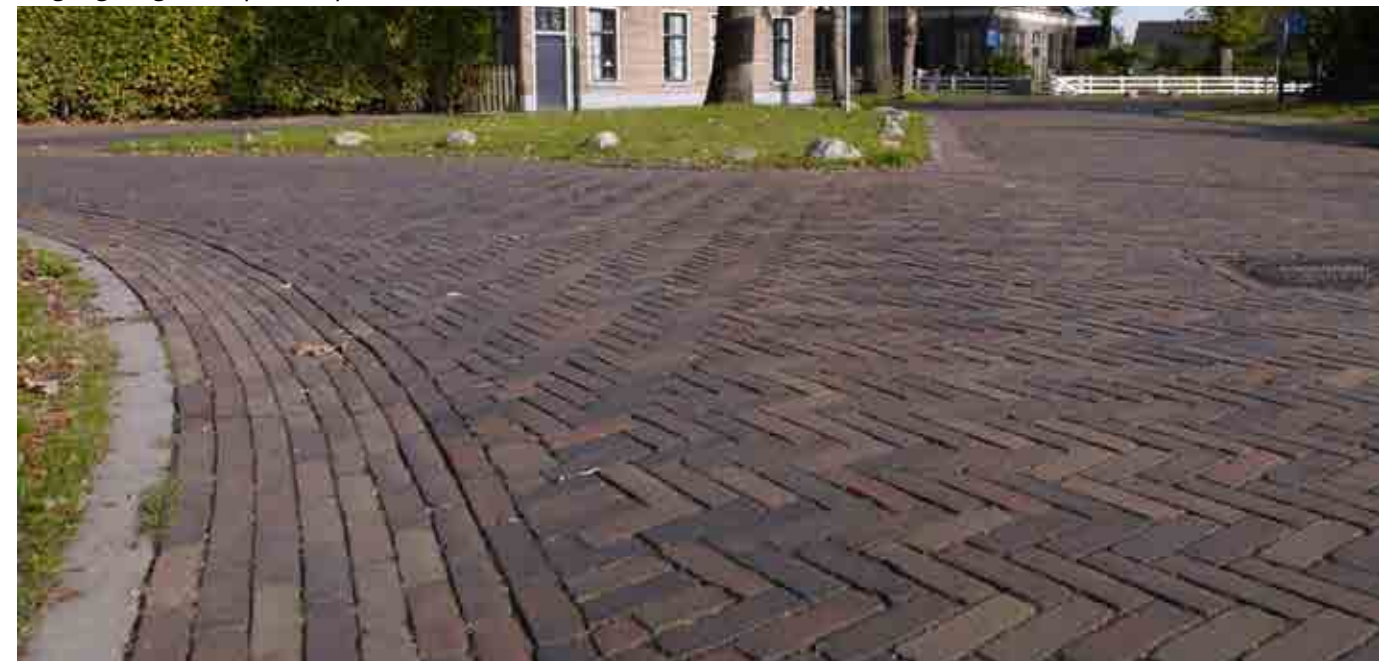
Gebakken straatstenen, in een dikformaat en een genuanceerde kleurstelling, rood/bruin/antraciet