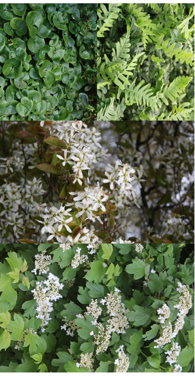
Linksboven: elkenbladvaan, Linksonder: mansoor, Midden: krentenboompje, Rechts: Gelderse Roos

Ook tussen de tuinen dient gebruik gemaakt te worden van groene erfafscheidingen in de vorm van hagen. Schuttingen en andere gebouwde erfafscheidingen dienen zo veel mogelijk te worden vermeden.