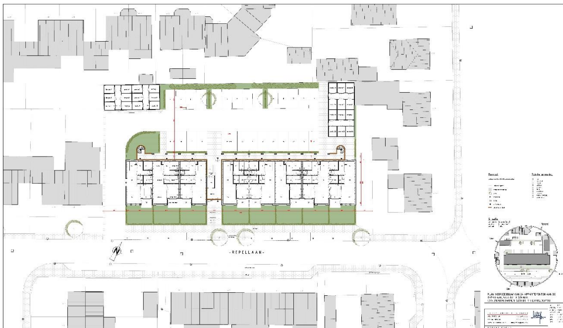
Figuur 1: Impressies initiatief