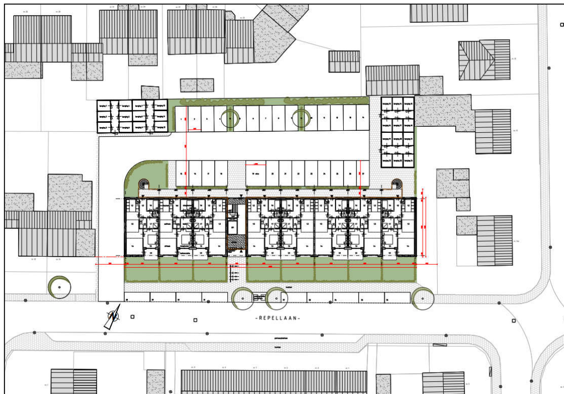
Figuur 1.1: Situatie (bron: Koppens Architectenbureau uit Heesch)

In figuur 1.1 is een overzicht opgenomen van de onderzochte situatie.