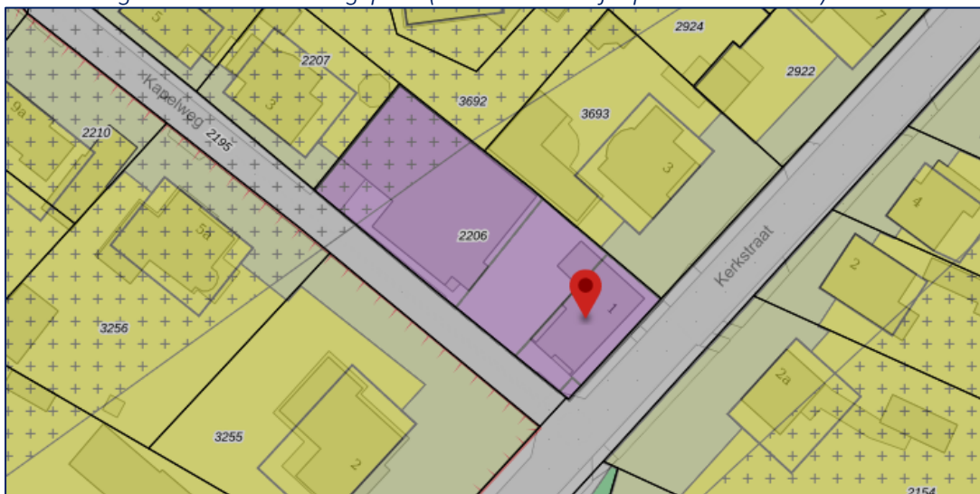
Uitsnede geldend bestemmingsplan

In hoofdstuk 6 wordt de juridische regeling kort toegelicht. Hoofdstuk 7 beschrijft de procedure die het bestemmingsplan doorloopt.