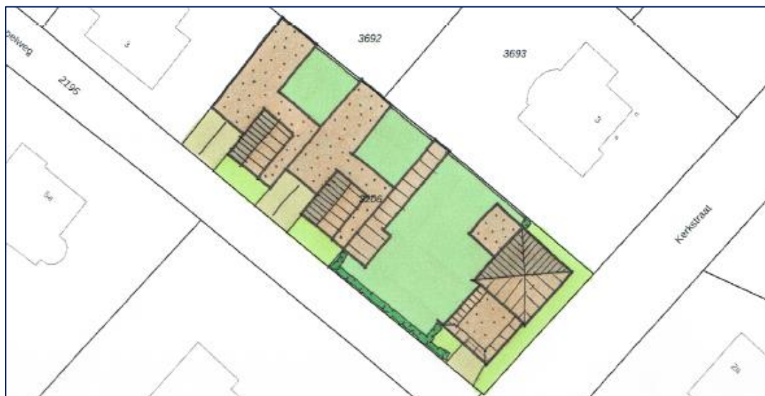
Suggestie toekomstige situatie na herontwikkeling Kerkstraat 1

De bestaande ruimtelijke structuur ondergaat door de herontwikkeling een beperkte wijziging. Aan de zijde van de Kerkstraat is deze wijziging niet zichtbaar. De bedrijfswoning blijft hier in zijn huidige situering en verschijningsvorm behouden, inclusief de bijbehorende tuin met achterliggend bijgebouw. Aan de insteek van de Kapelweg ontstaat wel een nieuwe ruimtelijke structuur. De bedrijfsbebouwing achter de achtertuin maakt plaats voor de bebouwing van 2 patiowoningen. De voorgevels van deze patiowoningen worden gesitueerd in de voorgevelrooilijn van de aangrenzende woningen aan de noordzijde van de insteek van de Kapelweg. Concreet betekent dit een afstand van 3 m tot de naar de weg gekeerde perceelsgrens. Daarmee komen de beide woningen op grotere afstand van de weg te liggen dan de huidige bedrijfsbebouwing. Met de realisering van de patiowoningen verandert ook de uitstraling van de bebouwing. Is nu nog sprake van de blinde zijgevel van een bedrijfspand, omgeven door hekwerken en een dichte poort, in de toekomst liggen hier 2 patiowoningen met de voorzijde naar de weg gekeerd, met een kleine voortuin en oprit naar de teruggelegde bergingen/garages bij de woningen.