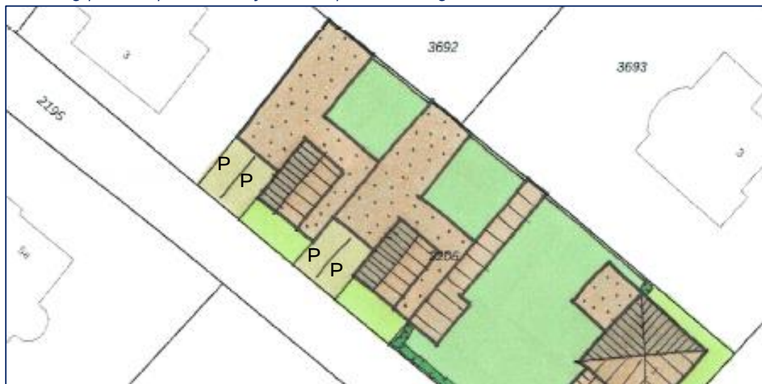
Situering parkeerplaatsen bij nieuwe patiowoningen

Op basis van de onderbouwingen in de voorgaande paragrafen mag geconcludeerd worden dat fysieke aspecten geen belemmeringen opleggen aan het planvoornemen. Ook is het niet noodzakelijk voorwaarden aan de voorziene ontwikkeling te verbinden.