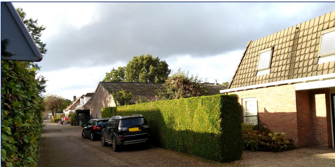
(Bedrijfs)bebouwing aan insteek Kapelweg

De ontsluiting van het plangebied vindt plaats vanaf de Kerkstraat-Udenseweg en de insteek van de Kapelweg. Daarbij is de bedrijfswoning ontsloten vanaf de Kerkstraat en de Kapelweg, terwijl de bedrijfsloodsen enkel worden ontsloten vanaf de Kapelweg. Bij de bedrijfswoning zijn op de oprit voor de garage in de aanbouw 2 parkeerplaatsen beschikbaar. Bij de bedrijfsloodsen zijn op eigen terrein geen parkeerplaatsen beschikbaar.