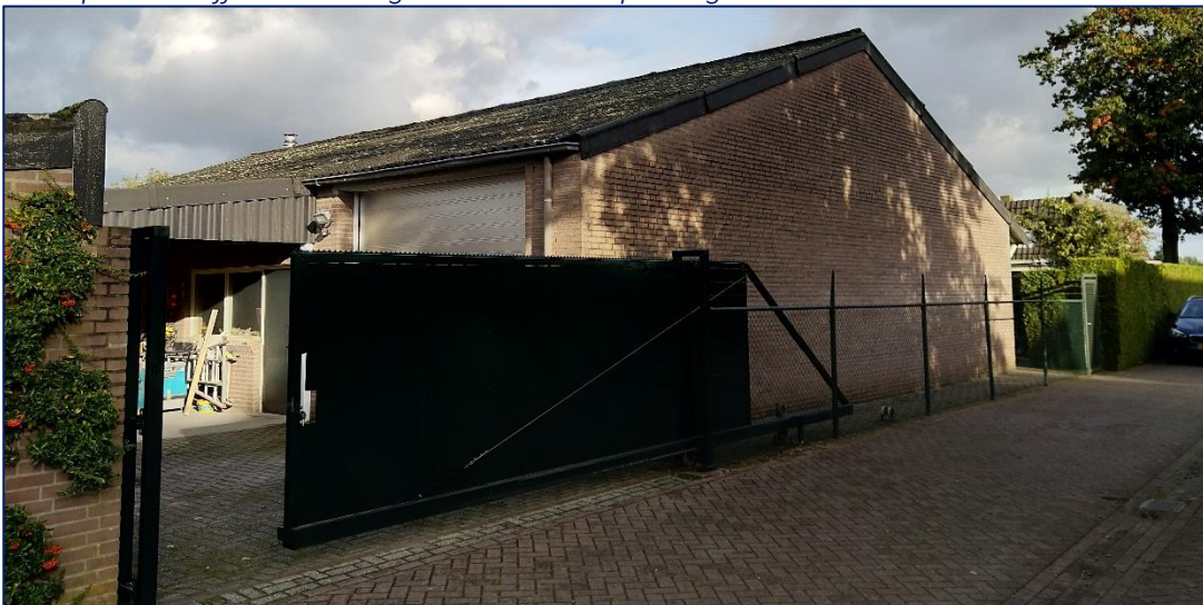
Te slopen bedrijfsbebouwing aan insteek Kapelweg

Het perceel Kerkstraat 1 heeft geheel een bedrijfsbestemming. Daarbinnen is de uitoefening van het bedrijf en de aanwezigheid van de bedrijfswoning toegestaan. Om de omzetting van de bedrijfswoning naar burgerwoning en de bouw van twee extra woningen mogelijk te maken is een bestemmingswijziging noodzakelijk. De bedrijfswoning mag enkel als burgerwoning worden gebruikt als deze over een woonbestemming beschikt. Daarnaast is de bouw van de twee patiowoningen ook slechts mogelijk als de onderliggende gronden van een woonbestemming worden voorzien met de mogelijkheid daarbinnen twee woningen te bouwen.