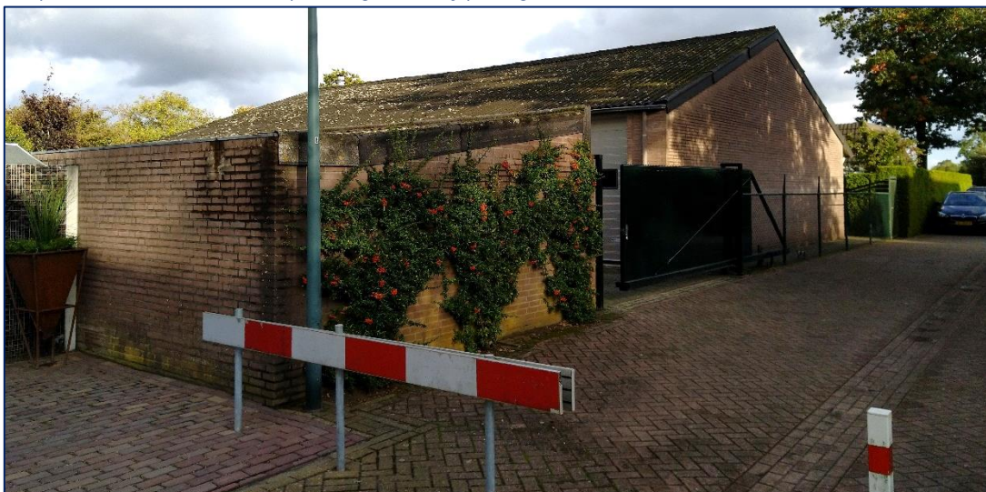
Knip in insteek van de Kapelweg voorbij plangebied

De bestaande vrijstaande woning wordt ontsloten via de Kerkstraat en de insteek van de Kapelweg. De beide patiowoningen zijn alleen via de insteek van de Kapelweg bereikbaar.