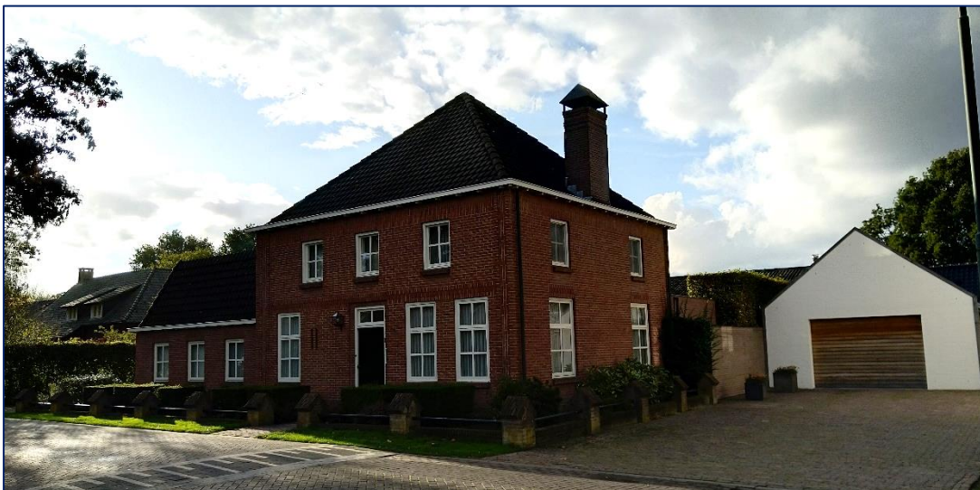
Bedrijfswoning Kerkstraat 1

De rondom het plangebied gelegen woningen betreffen overwegend woningen in 1 bouwlaag, afgedekt met een kap. Veelal betreft dit zadeldaken, in enkele gevallen is sprake van een mansardedak of een schilddak.