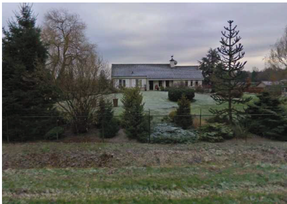
Woning op terp, Rijksweg 26 Schaijk

Op de diverse percelen gelegen en gericht naar de Rijksweg zijn verschillende typologiën woningen / boerderijen aanwezig. Bouwvolume met de weg mee alsmede haaks op de weg, zo ook voor dakvormen. Qua kleuren zijn baksteen gebouwen, geel / rood / grijs genuanceerd aanwezig, ook geschilderde of gestucte gevels. Dakpannen in beton of keramische uitvoering in kleurvarianten grijs en oranje. Diverse woningen aan de Rijksweg zijn gebouwd op een noemenswaardige terp, bijvoorbeeld Rijksweg 26 Schaijk.