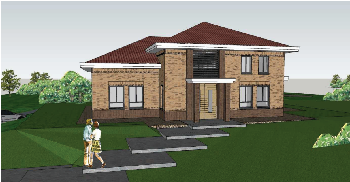
Impressie nieuwe woning Rijksweg 14 te Schaijk.

In het bestemmingsplan en beeldkwaliteitsplan staat vermeld dat de nieuwe burgerwoning net als het horecapand op een terpvormige verhoging komt te liggen, met een relatief steile helling rondom. Ter hoogte van het bouwvlak mag de woning worden voorzien van een kelder. De inhoud van de toekomstige kelder wordt niet meegeteld bij de maximale inhoudsmaat van de burgerwoning. Onderstaande afbeelding bevat een indicatie van de toekomstige woning.