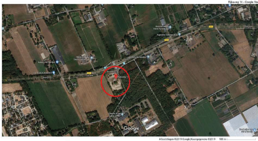
Globale ligging Rijksweg 14 te Schaijk, perceel rood omcirkeld.

Het perceel Rijksweg 14 is gelegen in het buitengebied ten zuidwesten van de kern Schaijk. Op onderstaande afbeeldingen is de ligging en begrenzing van het perceel Rijksweg 14 globaal weergegeven.