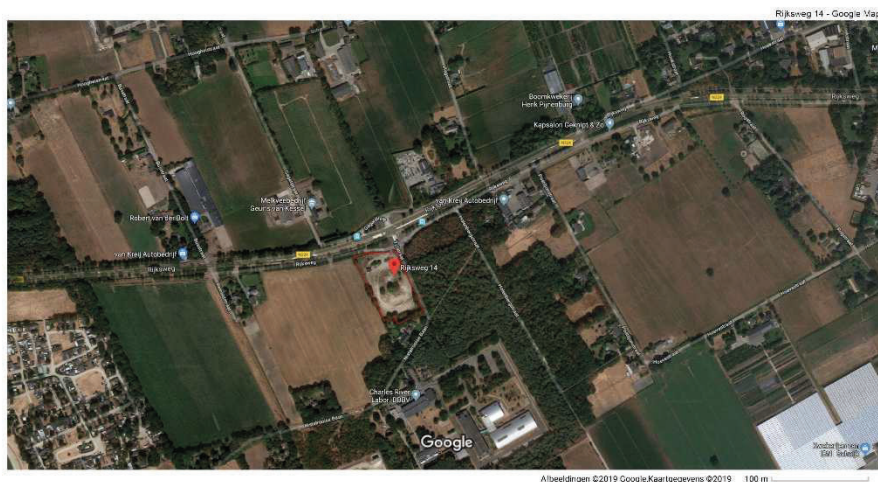
Globale begrenzing Rijksweg 14 te Schaijk, perceel rood omlind.

Het perceel Rijksweg 14 heeft een oppervlakte van ca. 11.253 m 2 en wordt aan de noordzijde begrensd door de Rijksweg Bosschebaan (N324). De Tolstraat vormt de oostelijke begrenzing van het plangebied. De zuid- en oostzijden worden begrensd door een uitloper van het Maashorstgebied, terwijl de westelijke begrenzing bestaat uit een agrarisch perceel.