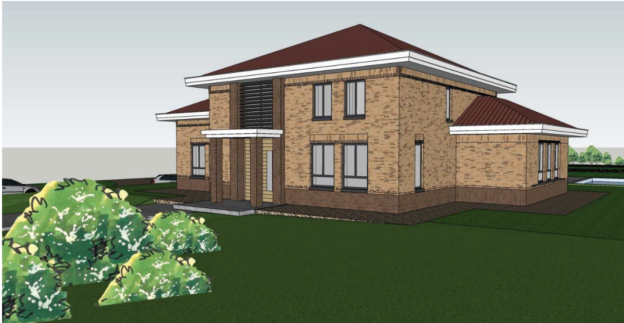
Impressie nieuwe woning Rijksweg 14 te Schaijk.

Aan de rechter zijgevel is een uitbouw gesitueerd welke ruim onder de goot van het hoofdgebouw in de bouwmassa grijpt. Hierbij wordt verwezen naar de bij de uitgebreide omgevingsvergunning ingediende bestektekeningen; 216 BE-01 t/m 216 BE-06.