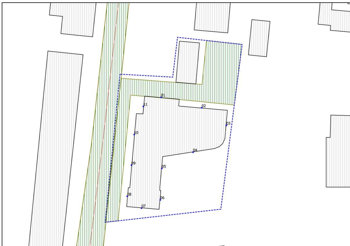
Figuur 3.1 Situering toetspunten

In het onderhavig akoestisch onderzoek is rekening gehouden met de maximale bebouwingsgrens van het plan. In figuur 3 en in bijlage 1 zijn de toetspunten op de bebouwingsgrens weergegeven.