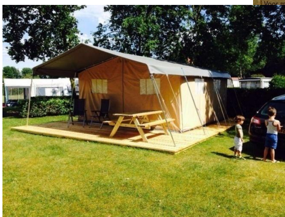
safaritent Heische Tip