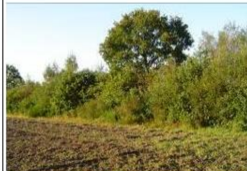
Hakhoutsingel met enkele overstaander