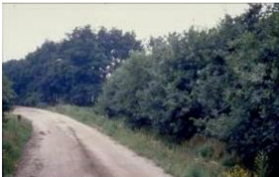
Hakhoutsingel zonder overstaanders

Op het sportveld is een tijdelijke opslag van snoeihout voorzien. Deze wordt ingepast met houthaksingels.