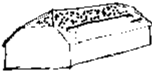
zadeldak met wolfseinden riet en pannen