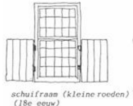
schuifraam (kleine roeden) (18e eeuw)