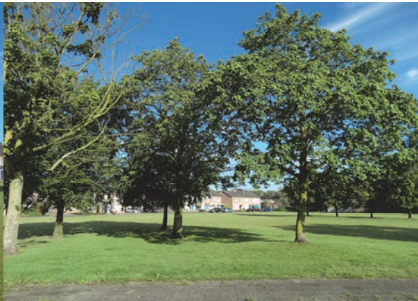
Figuur 8: Aanzicht groep bomen met uitzicht op het plangebied en de Imkerstraat. Foto genomen vanaf de Brouwerstraat