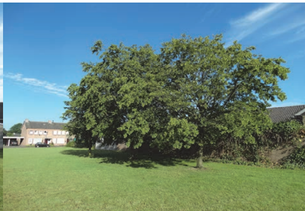
Figuur 6: Aanzicht groep bomen aan de achterzijde van de woning aan de Klumperstraat