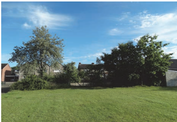
Figuur 5: Aanzicht achterzijde groenstrook en speelplaats