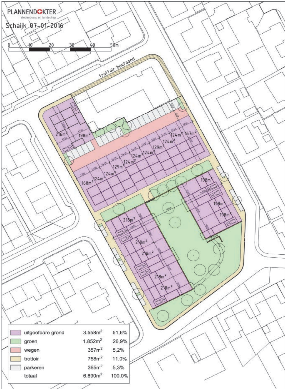
Figuur 9: Stedenbouwkundig inrichtingsplan locatie De Omgang te Schaijk