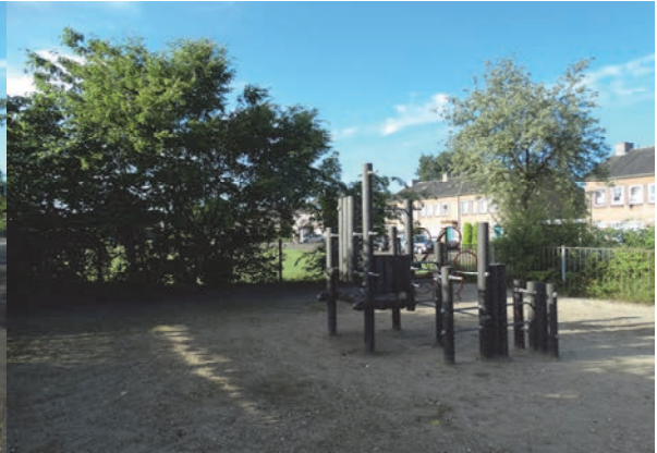
Figuur 4: Aanzicht speelplaats. Rechts is de groenstrook gesitueerd. Foto genomen vanaf de Klumperstraat