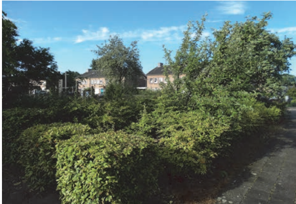
Figuur 3: Aanzicht groenstrook. Foto genomen vanaf de Imkerstraat/Klumperstraat