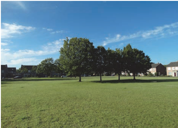
Figuur 7: Aanzicht plangebied en rij bomen. Foto genomen vanaf de Burgemeester Schoutenstraat