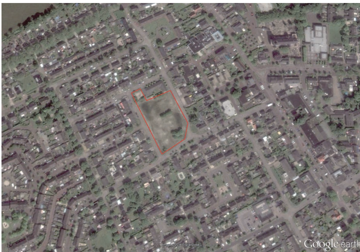
Figuur 1: Luchtfoto plangebied

Het plangebied wordt omsloten door de Brouwerstraat, Burgemeester Schoutenstraat, Imkerstraat en de Klumperstraat binnen de kern Schaijk, gemeente Landerd. De Amersfoortcoördinaten van het midden van het plangebied zijn X= 171,696, Y= 417,448. Het plangebied is rood omkaderd weergegeven op de luchtfoto (figuur 1) en weergegeven als een rode ster op de topografische kaart (figuur 2).