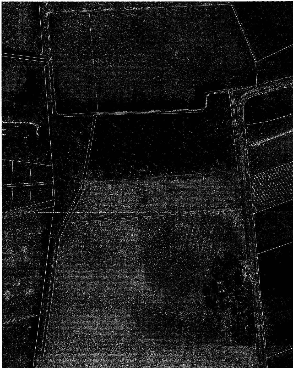
ligging A-waterloop natuurbegraafplaats Maashorst