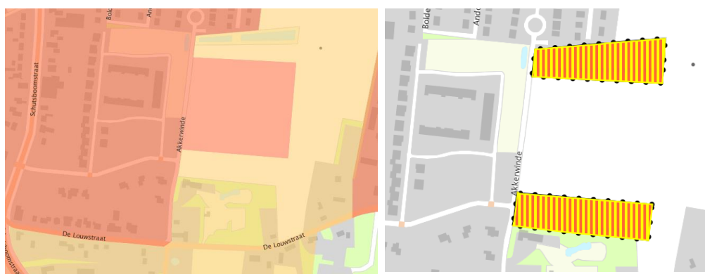
Figuur 5.2 Uitsnede Verordening Ruimte 2014 (links) en kaartaanpassingen oktober 2015 (rechts)

De verordening wijst het gebied waarin het plangebied zich bevindt aan als 'Bestaand stedelijk gebied, kernen in het landelijk gebied'. Artikel 4.2 van de verordening bepaalt dat stedelijke ontwikkelingen uitsluitend mogelijk zijn binnen bestaand stedelijk gebied. Figuur 5.2 geeft een weergave van de Verordening Ruimte d.d. 15 juli 2015 (links) en de Wijziging Verordening ruimte 2014, kaartaanpassingen d.d. 6 oktober 2015). Hieruit blijkt dat het plangebied volledig binnen bestaand stedelijk gebied valt.