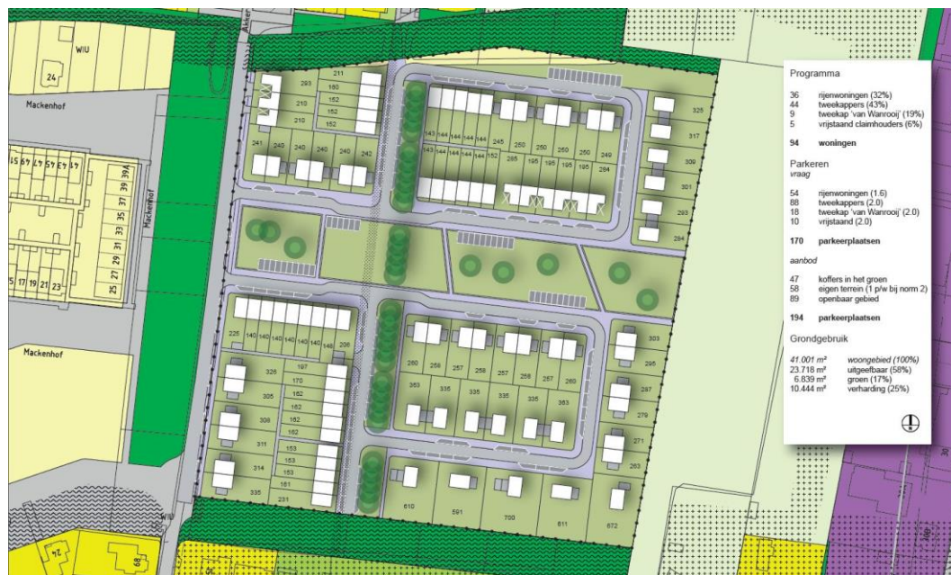
Figuur 2.1 Stedenbouwkundig plan en programma fase 2

Voor bestemmingsplan Akkerwinde (moederplan) is een beeldkwaliteitsplan vastgesteld. Door middel van het beeldkwaliteitsplan voor het gehele plangebied wordt ervoor gezorgd dat er een eenheid gaat ontstaan tussen de verschillende plandelen.