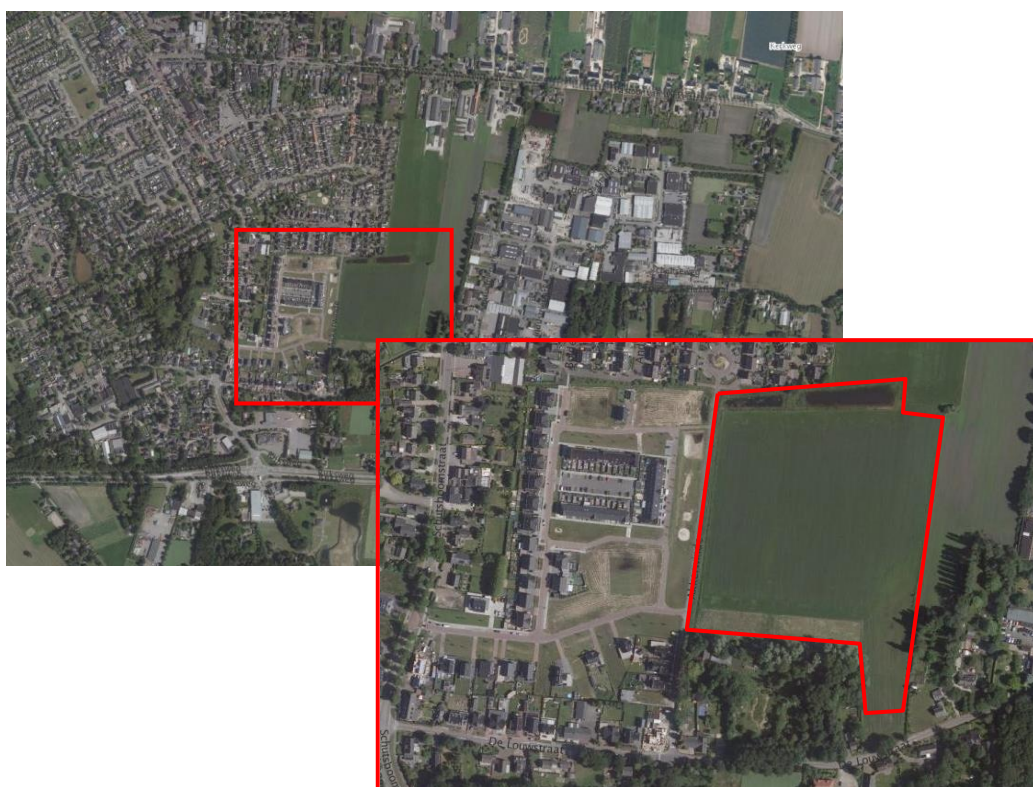
Figuur 1.1. Plangebied

In figuur 1.1 is de begrenzing van het plangebied weergegeven.