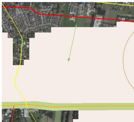
Figuur 6.1. Uitsnede cultuurhistorische waardenkaart (groene pijl: doorzicht, witte vlak: indicatieve archeologische waarden).

Het begrip 'cultuur' heeft zeer verschillende verwante betekenissen. Hier betekent het 'alles wat door de samenleving wordt/is voortgebracht' en staat cultuur tegenover natuur. In beperktere zin wordt het ook gebruikt voor kunstuitingen, cultuurpolitiek, bedrijfscultuur of de tradities van een land. In de archeologie en geschiedenis betekent cultuur ook 'be-