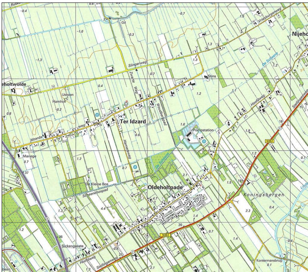
Figuur 1. De ligging van het plangebied

Ter Idzard is één van de kernen in de gemeente Weststellingwerf en heeft ongeveer 340 inwoners. Het plangebied heeft betrekking op het dorp Ter Idzard. De ligging van het plangebied is weergegeven in figuur 1.