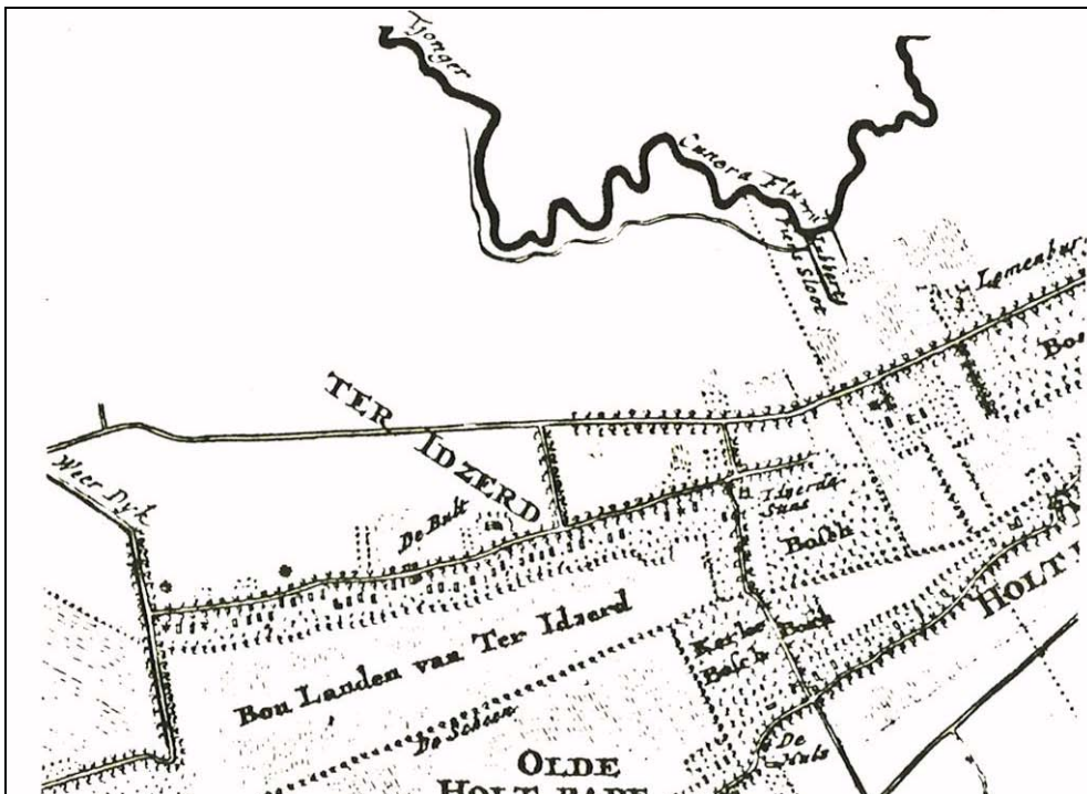
Figuur 2. Fragment van de kaart van Schotanus 1718

Ter Idzard is ontstaan op een open plek in het bos met goed landbouwgrond. Het vermoeden bestaat dat er omstreeks 1100 al sprake was van een volwaardig dorp waar nu Ter Idzard ligt. De kerk, één van de monumenten in het dorp, was het middelpunt van vele gebeurtenissen. In eerste instantie moet het een houten kerk zijn geweest met riet gedekt. Het huidige kerkgebouw van Ter Idzard werd al gebouwd in het jaar 1500. De toren heeft één klok. In de kerk bevinden zich gebeeldhouwde rouwborden van zandsteen van onder andere de familie Idsaerda. De plaats is waarschijnlijk genoemd naar deze familie.