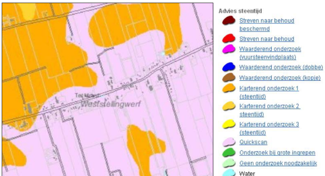
Figuur 5. FAMKE-kaart Steentijd-Bronstijd Ter Idzard en omgeving

Op de advieskaart Steentijd - Bronstijd wordt voor een klein deel van Ter Idzard aangegeven, dat er zich archeologische resten uit de steentijd kunnen bevinden vlak onder de oppervlakte, afgedekt door een dun veen- of kleidek. Op figuur 2 zijn deze gebieden aangegeven in het oranje.