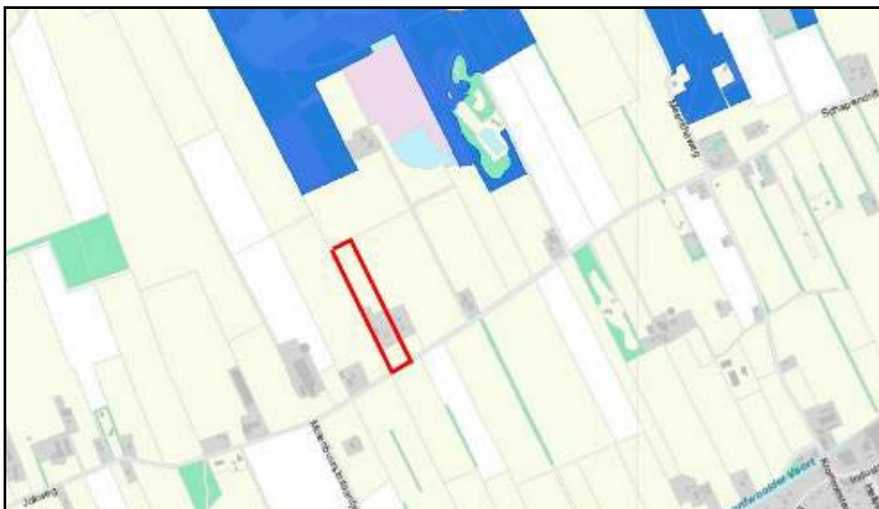
Figuur 2. Ligging zeer kwetsbare natuurterreinen (blauw) en plangebied (rood omlijnd)

Ten noorden van het plangebied ligt het bosgebied De Meenthe, welke in de EHS is gelegen. Een deel van dit gebied is aangewezen als zeer kwetsbaar gebied in het kader van de Wet ammoniak en veehouderij (zie figuur 2). Dit betekent dat binnen een zone van 250 meter rondom deze gebieden geen nieuwe veehouderijen gerealiseerd mogen worden. Gelet op de afstand tot de potstal wordt geconcludeerd dat de EHS en het daarbinnen aangewezen kwetsbare gebied niet negatief worden beïnvloed (zie voor de afstand ook figuur 7).