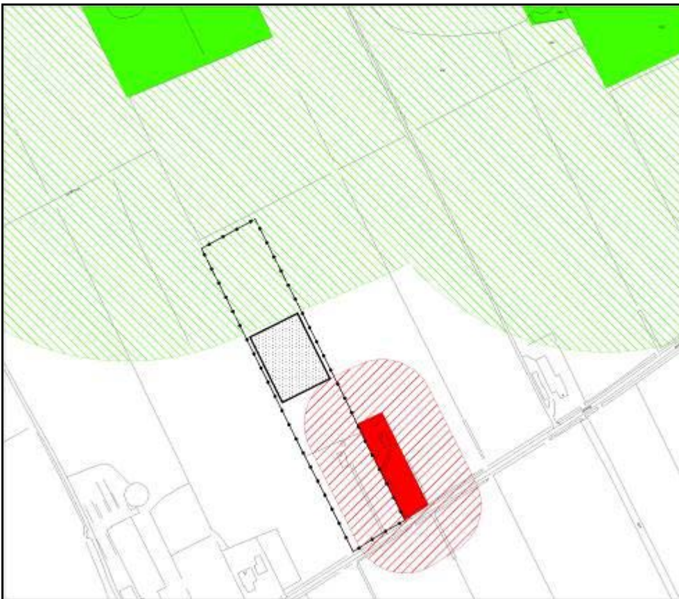
Figuur 6. Overzicht afstanden vanuit de Wet ammoniak en veehouderij (groen) en de Wet geurhinder en veehouderij (rood).

De gewenste situatie is het belangrijkste uitgangspunt voor dit bestemmingsplan. Deze situatie is echter mede afhankelijk van milieuwetgeving. Vanuit de milieuwetgeving moet afstand worden bewaard ten opzichte van de naastgelegen woning en het natuurgebied De Meenthe.