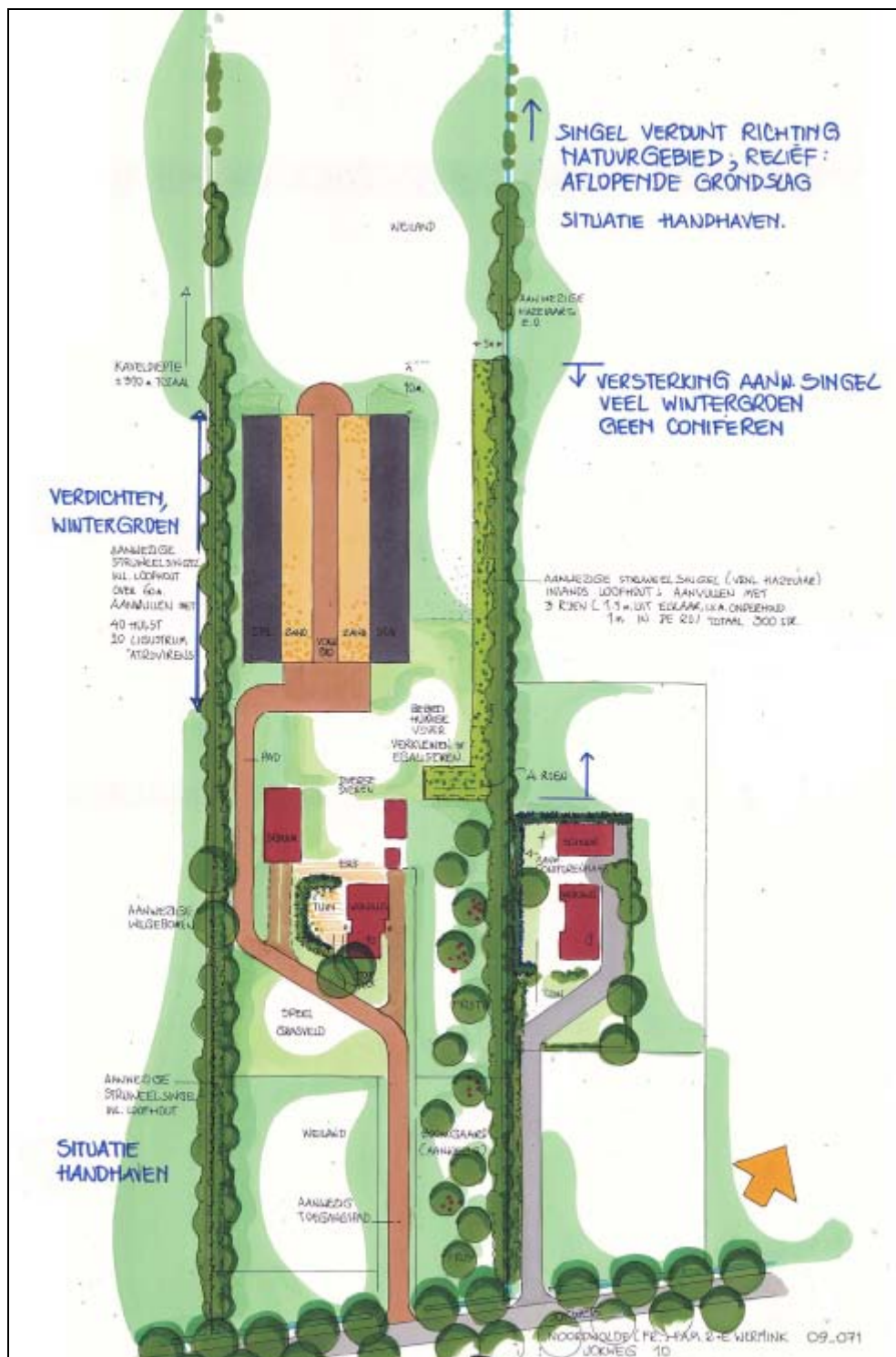
Figuur 5. Landschappelijke inpassing