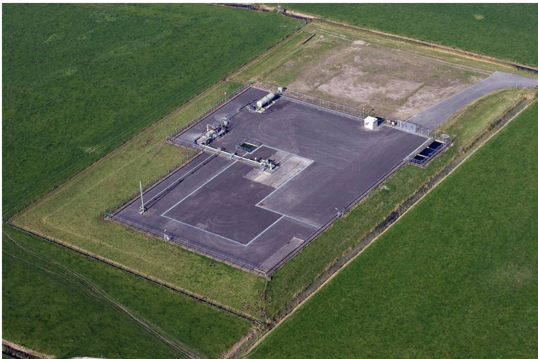
Figuur 4 Voorbeeld van een gaswinlocatie