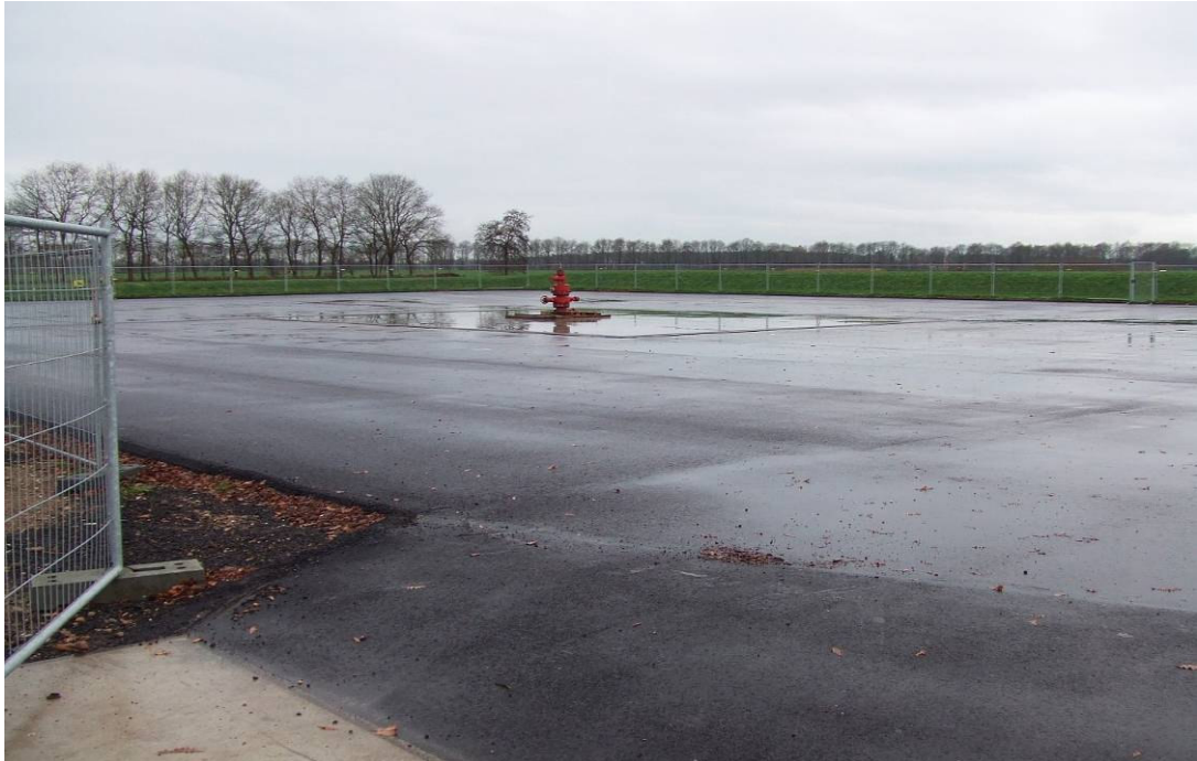
Figuur 3 Situatie locatie Vinkega met daarop zichtbaar de afsluiter (foto december 2009)