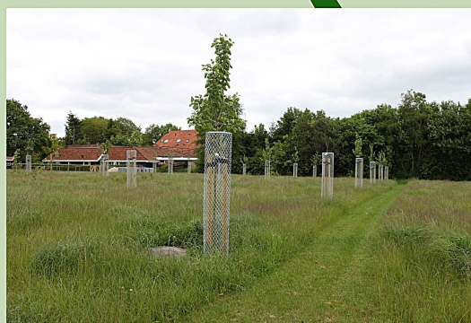
fruitboomgaard met cultuurhistorische rassen