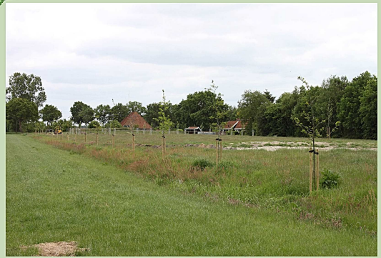
bomenrij langs oostzijde perceel