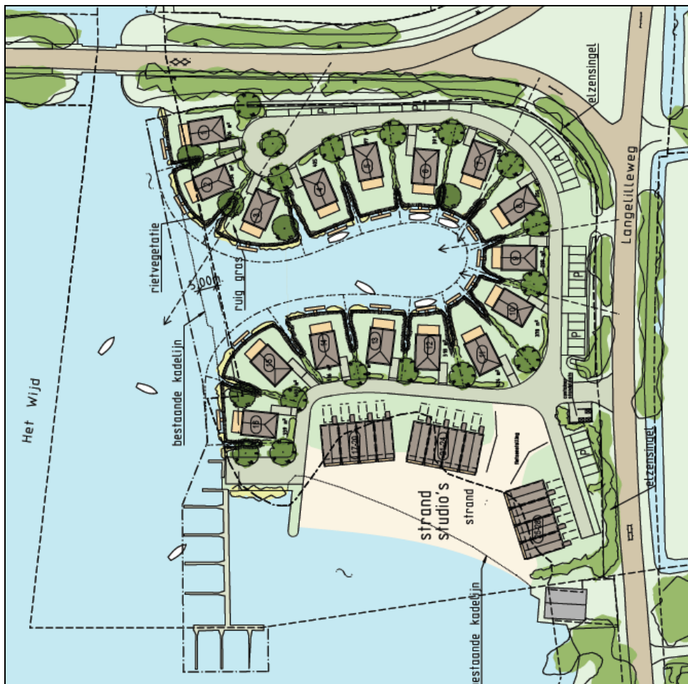
Figuur 3. Een inrichtingsschets van het zuidelijk deel van het kampeerterrein

Het is de bedoeling dat later ook het noordelijk deel van het kampeerterrein wordt heringericht. Dit gebied wordt zo ingericht dat het op een goede wijze aansluit bij het zuidelijk deel. Deze ontwikkeling is nu nog onvoldoende concreet. Hiervoor wordt later een afzonderlijk bestemmingsplan opgesteld.