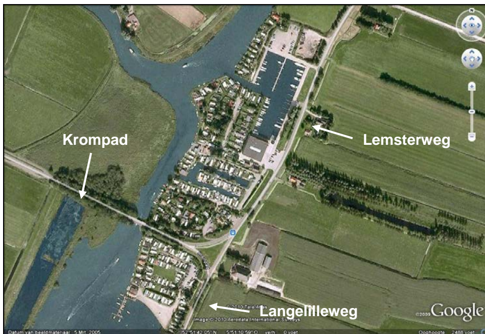
Figuur 2. De huidige situatie van De Driesprong

Het terrein ligt aan de Lemsterweg, die overgaat in de Langelilleweg en het Krompad. Deze laatste weg scheidt De Driesprong als het ware in twee delen. Het deel ten zuiden van het Krompad bestaat uit een camping met stacaravans. Ten noorden van het Krompad liggen een camping en twee jachthavens. Tussen de twee jachthavens ligt een parkeerplaats en een voorzieningengebouw ten behoeve van de jachthavens. In dit gebouw zijn overigens ook voorzieningen voor de camping gehuisvest. Tussen de zuidelijk gelegen jachthaven en het Krompad ligt een gebouw met horecavoorzieningen voor de camping en een woning. Ten noorden van de meest noordelijke jachthaven ligt een parkeerplaats en een agrarisch perceel.