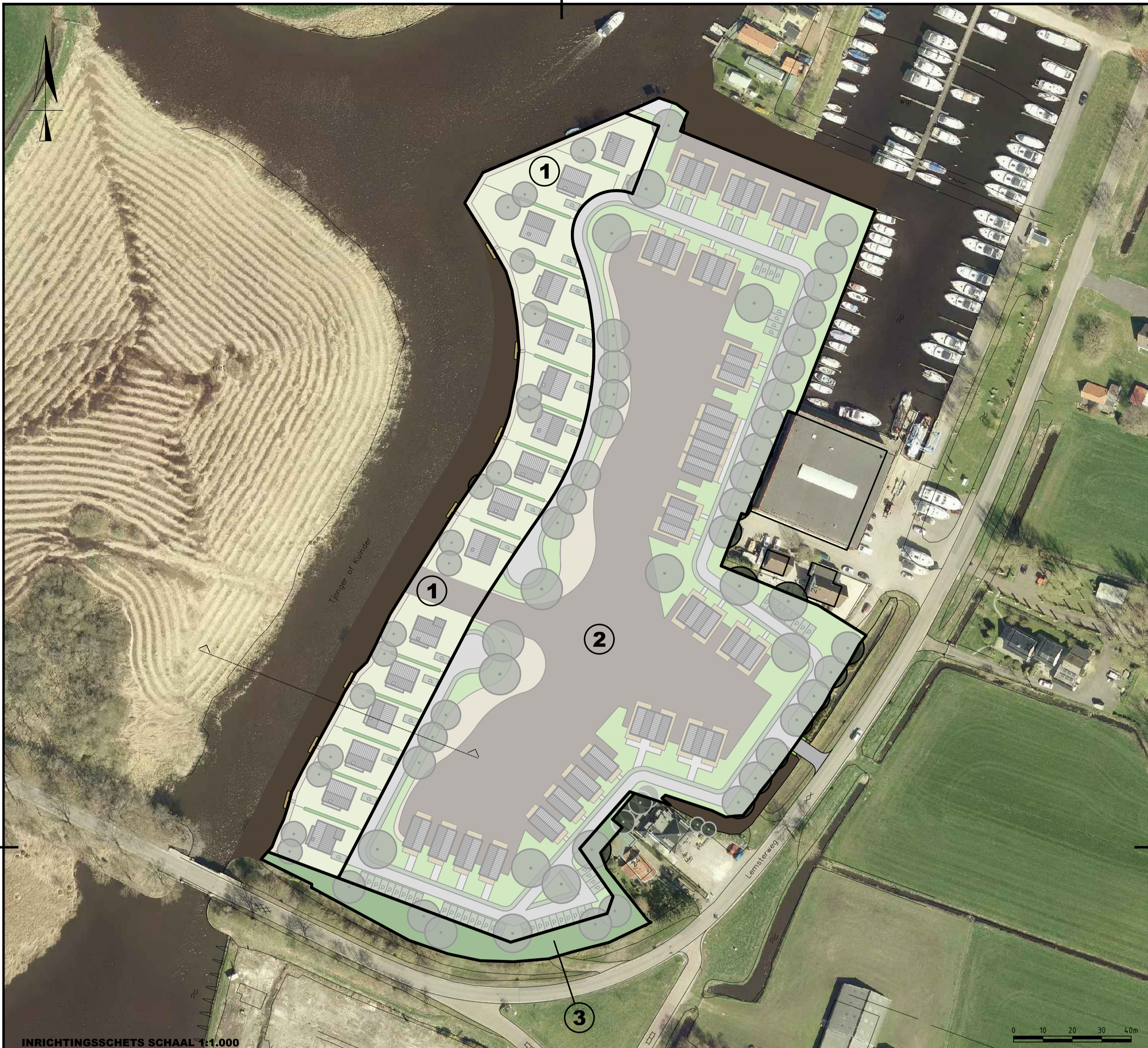
INRICHTINGSSCHETS SCHAAAL 1:1.000