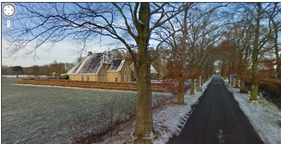
Figuur 4. Aanzicht op de entree van De Hoeve

Een aanzicht op de huidige entree is weergegeven in figuur 4. De beukenhaag langs het perceel Hoeveweg 8 is hierop duidelijk zichtbaar.