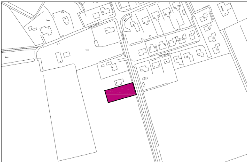
Figuur 1. De ligging van het plangebied

Het plangebied ligt direct ten zuiden van het perceel Hoeveweg 8. Het omvat de gewenste bouwkaal (22 bij 50 meter) voor de woning. De ligging van het plangebied is weergegeven in figuur 1.