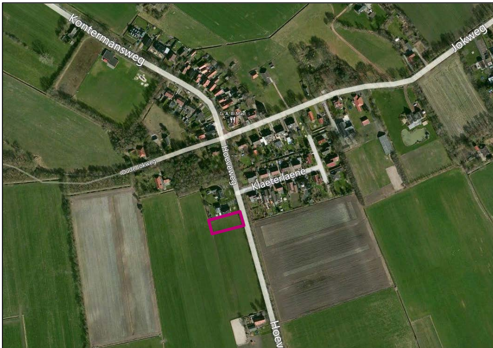
Figuur 2. Luchtfoto plangebied en directe omgeving

Een luchtfoto van het plangebied en de directe omgeving is weergegeven in figuur 2.