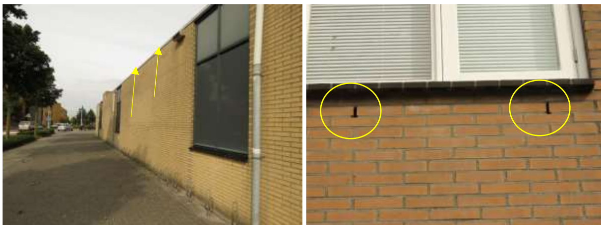
Zichtbare open stootvoegen vormen potentiële invliegopeningen in de voormalige supermarkt. Ook kunnen vleermuizen soms de luchtsponw betreden via kieren tussen gevel en daklijst.

Door het slopen van de voormalige supermarkt wordt mogelijk een vleermuis verstoord of gedood en een vaste rust- of voortplantingsplaats verstoord, beschadigd en vernield.