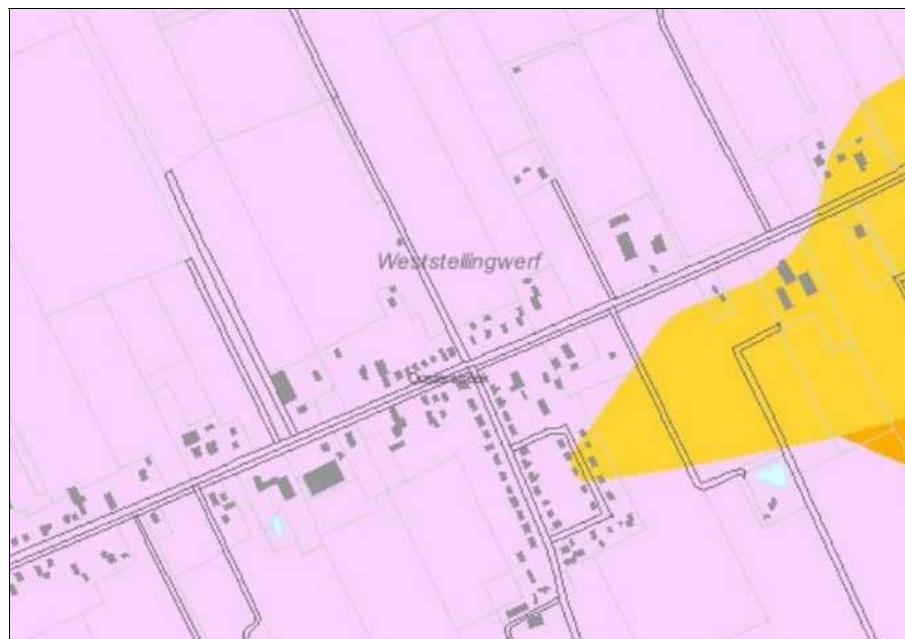
Figuur 5. Advies FAMKE Steentijd

Voor de IJzertijd-Middeleeuwen kent het plangebied het advies 'Middeleeuwen: karterend onderzoek 3' (zie figuur 6).