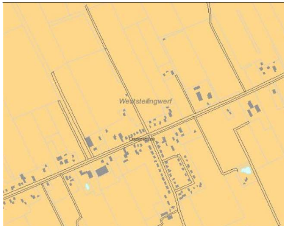
Figuur 6. Advieskaart IJzertijd-Middeleeuwen

In deze gebieden kunnen zich archeologische resten bevinden uit de periode midden Bronstijd-vroege Middeleeuwen. Het gaat hier dan met name om vroeg- en volmiddeleeuwse veenontginningen. Daarbij bestaat de kans dat er zich huisterpjes uit deze tijd in het plangebied bevinden. Ook de wat oudere