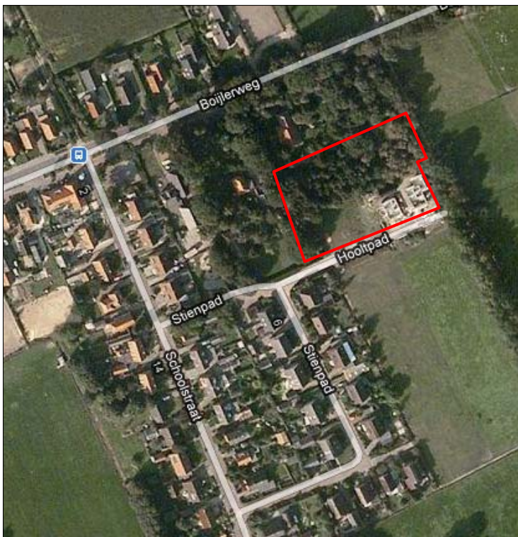
Figuur 1. Globale ligging plangebied

Dit bestemmingsplan heeft betrekking op vier percelen aan het Hooltpad 1 tot en met 7 in het dorp Oosterstreek. Het dorp is gelegen in de gemeente Weststellingwerf. De gemeente Weststellingwerf heeft in 2009 een kapvergunning verleend voor de kap van de daar aanwezige bossages om de betreffende gronden als tuin te kunnen gebruiken bij de aangrenzende woonpercelen. De bewoners hebben de bossages inmiddels volledig verwijderd en in gebruik genomen als tuin. De percelen hebben op dit moment nog een agrarische bestemming die formeel het gebruik als tuin niet toestaat. De gemeente wil deze bestemming dan ook veranderen in een bestemming die het gebruik als tuin bij naastliggende woningen mogelijk maakt. Het bestemmingsplan 'Hooltpad 1 t/m 7 Oosterstreek' is opgesteld om de percelen aan het Hooltpad de bestemming 'Woongebied' te geven. Ter wille van de volledigheid zijn de volledige woonpercelen bij het plan betrokken. De ligging van het plangebied is globaal in figuur 1 weergegeven.