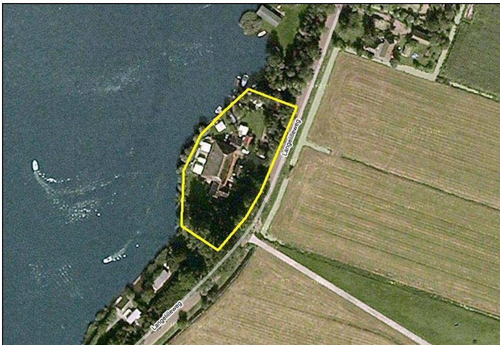
Figuur 2. De begrenzing van het projectgebied

Het projectgebied ligt tussen de Tjonger en de Langelilleweg. Het projectgebied ligt aan de rand van de Groote Veenpolder. Dit is een open veenpolder met langgerekte kavels. In de polder komt verspreid liggende (agrarische) bebouwing voor. Beplanting in dit gebied is geconcentreerd rondom erven en dorpen. Aanwezige wegen zijn voornamelijk onbeplant. Het gebied is in gebruik als weidegrond. De begrenzing van het projectgebied is in figuur 2 weergegeven.