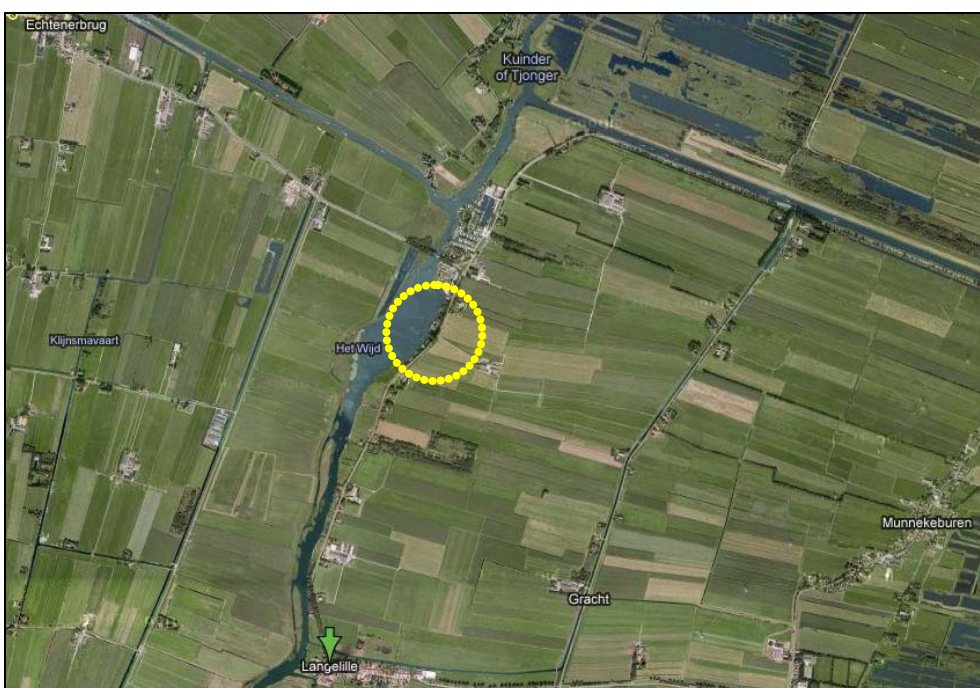
Figuur 1. De ligging van het projectgebied

Op 20 augustus 2010 is bij de gemeente het verzoek binnen gekomen voor de verbouw van de woonboerderij gelegen op het perceel Langelilleweg 2 te Langelille (zie figuur 1). Deze verbouw is nodig voor de uitbreiding van de woonfunctie. De bestaande contouren van het pand blijven gelijk, de gevels en het dak worden echter wel vernieuwd. De verbouwing past niet binnen het huidige bestemmingsplan. Dit projectbesluit maakt de verbouw mogelijk.