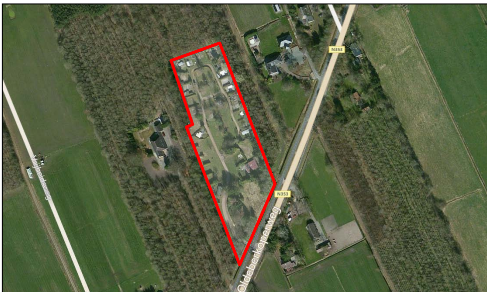
Figuur 2. Luchtfoto van het plangebied en de directe omgeving

Het kampeerterrein biedt ruimte aan 25 jaarplaatsen, ingevuld met stacaravans op het noordelijk deel en 15 toeristische stapplaatsen ten zuiden hiervan. Op het zuidoostelijk deel is een sanitairgebouw aanwezig. Recentelijk is de bedrijfswoning, die aan de Oldeberkoperweg stond, gesloopt na een brand. Een luchtfoto van het plangebied en de directe omgeving is weergegeven in figuur 2.