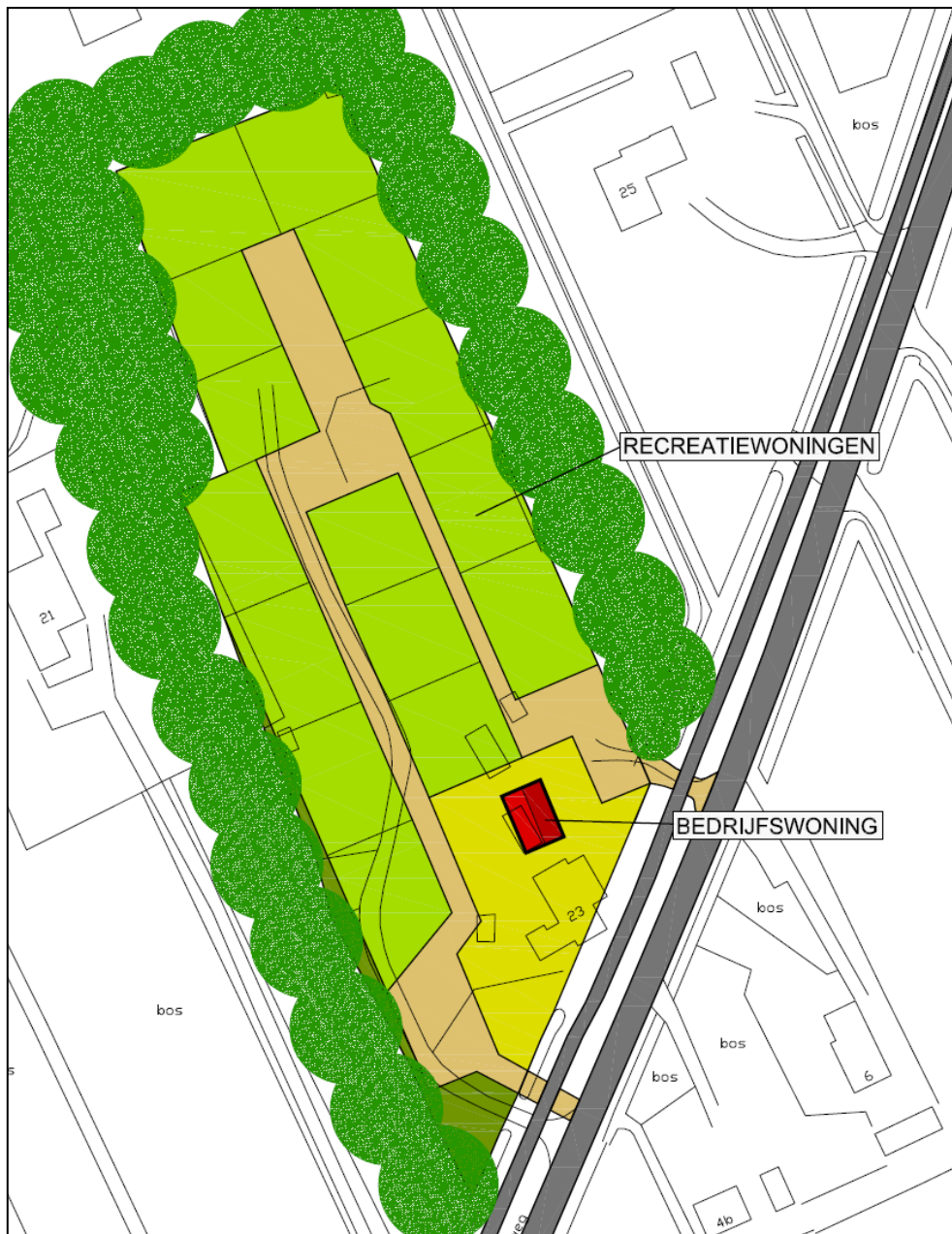
Figuur 3. Beoogde inrichting Buitengoed De Vlegel

Voor de inrichting van Buitengoed De Vlegel is een globale inrichtingstekening opgesteld. Deze tekening is weergegeven in figuur 3.