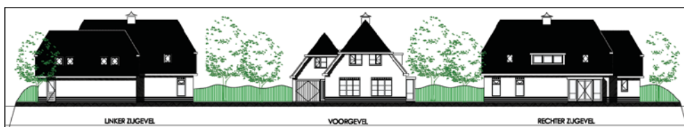
Figuur 5. Gevelaanzichten woonhuizen oostelijk perceel

Op het oostelijke perceel worden twee woonhuizen voorgesteld. Deze woonhuizen worden bij benadering op de locaties van de bestaande agrarische bedrijfsgebouwen gebouwd. De architectuur verwijst naar de boerderijachtige bebouwing in het buitengebied. De twee woonhuizen worden nagenoeg identiek. De oppervlakte van de woonhuizen is circa 18 bij 13 meter. De woonhuizen krijgen een nokhoogte van circa 9 meter en een lage gootlijn van circa 3 meter. De nokrichting is haaks op de weg en de kap is voorzien van een wolfseind. De te handhaven schuur zal een bijgebouw bij de westelijke woning op het oostelijke perceel vormen. Enkele gevelaanzichten van deze woonhuizen zijn weergegeven in figuur 5.