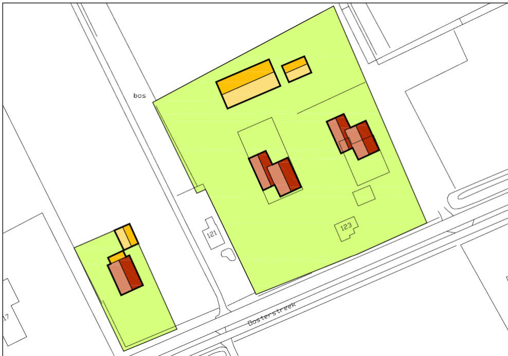
Figuur 3. Situering beoogde bebouwing

Het initiatief betreft de bouw van één vrijstaande woning op het westelijke perceel en twee vrijstaande woningen op het oostelijke perceel. Hiervoor zal met uitzondering van de meest noordelijke schuur, alle bebouwing op het perceel worden gesloopt. De beoogde bebouwing is weergegeven in figuur 3.