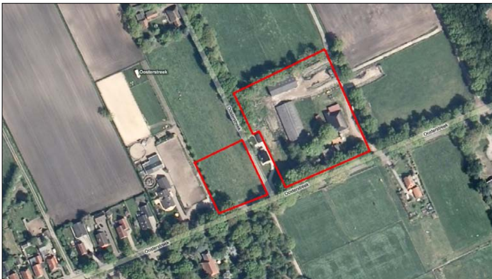
Figuur 2. Luchtfoto van het plangebied en de directe omgeving

Het plangebied bestaat uit twee delen. Het westelijke deel betreft een onbebouwd agrarisch perceel en het oostelijke deel is een agrarisch bouwperceel. Hier zijn een bedrijfswoning en enkele agrarische bedrijfsgebouwen aanwezig. Rondom het perceel is een afschermdende boomsingel aanwezig. Tussen de twee percelen staat een regulier woonhuis. Een luchtfoto van het plangebied en de directe omgeving is weergegeven in figuur 2.