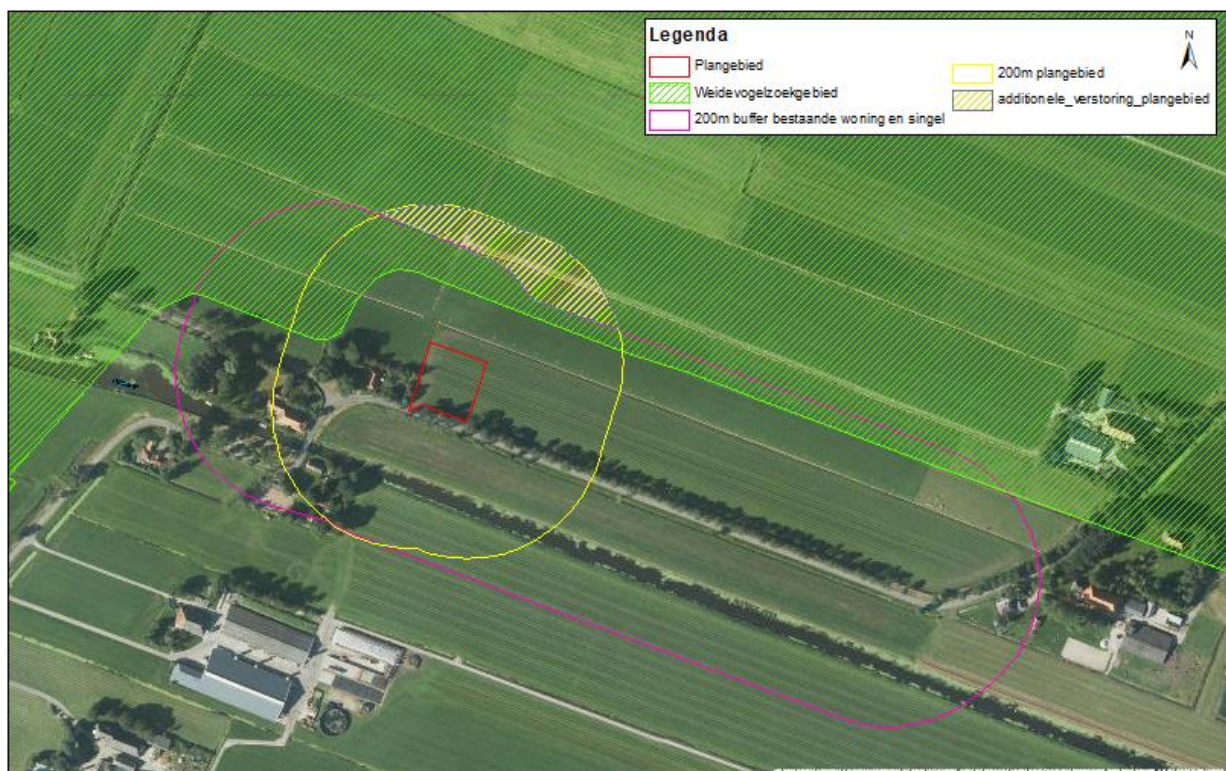
Figuur 4.1 Additioneel verstoord weidevogelgebied (1,9 hectare) door de ontwikkeling van een nieuwe woning.

Uit het literatuuronderzoek is naar voren gekomen dat de verwachte soorten een hoge verstoringsgevoeligheid hebben (Krijgsveld et al., 2008). Echter blijkt ook dat weidevogels zich kunnen aanpassen aan nieuwe situatie indien de omstandigheden (voedsel, schuilmogelijkheden) onveranderd blijven (Wymenga en Melman, 2011; Hoften en Valkema, 2014). Op basis van de literatuurstudie is aangenomen dat de minimale verstoringsafstand (waar de kans op een nieuw broedgeval nagenoeg nul is) op 200 meter ligt (Bruinzeel en Schotman, 2011; Wymenga en Melman, 2011; Provincie Friesland, 2016).