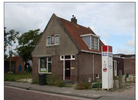
uitbreiding opvang aan de Haulerweg