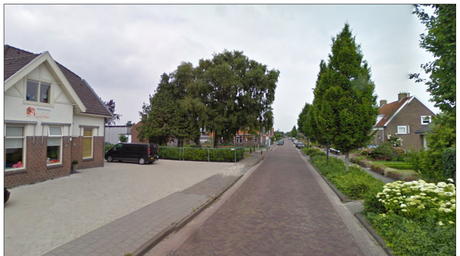
Keiweg / Haulerweg

Het plangebied zoals in het onderhavige bestemmingsplan is opgenomen, is gelegen aan de Haulerweg. Het betreft een leegstaand, gEDAteerd gebouw dat door deze nieuwe functie weer een positieve bijdrage kan leveren aan de straat wat betreft uitstraling.