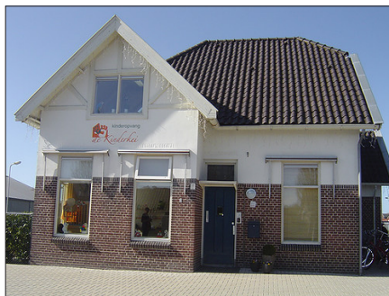
bestaande opvang aan Keiweg

In het gebouw aan de Haulerweg zal een kantoor worden gerealiseerd op de bovenverdieping, zodat hier de (privé) gesprekken plaats kunnen vinden. Tevens kan hier de administratie van het bedrijf plaatsvinden. De benedenverdieping (verdieping, voorhuis en keuken) zal gebruikt worden voor de naschoolse opvang (voor onder andere activiteiten als koken/bakken met de kinderen). Op de benedenverdieping zal tevens een kantine worden gerealiseerd. Op basis van gegevens van de GGD (Gemeentelijke of Gemeenschappelijke Gezondheidsdienst) zullen er maximaal 17 BSO-kinderen, vier leidsters en vier kantoorpersoneelsleden aanwezig zijn in het gebouw.