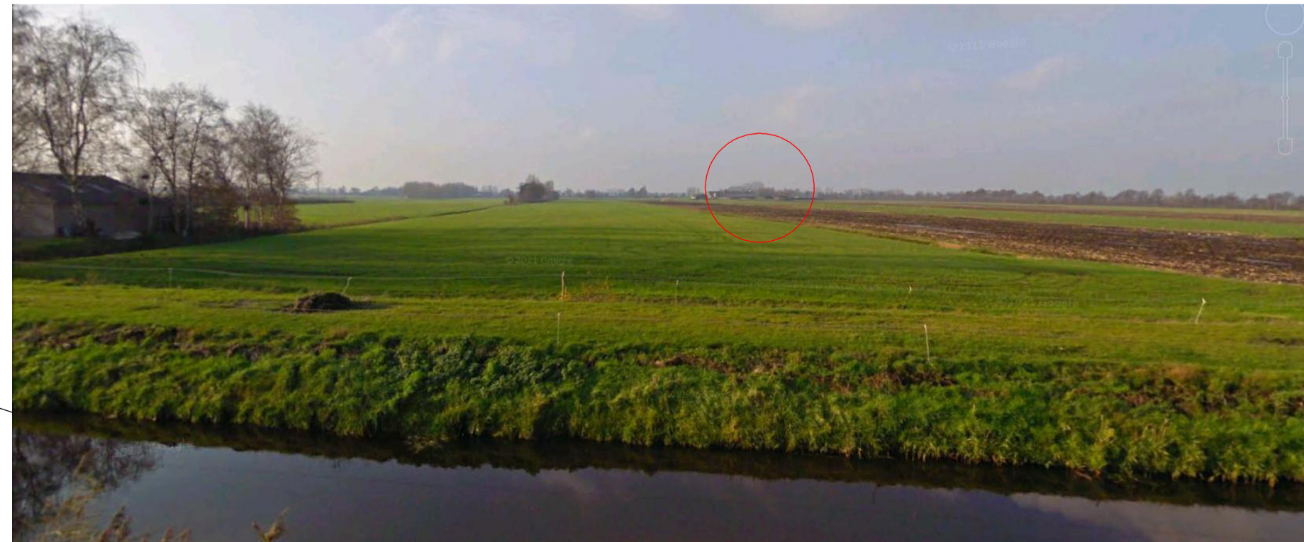
zicht op achtererf vanaf Gracht