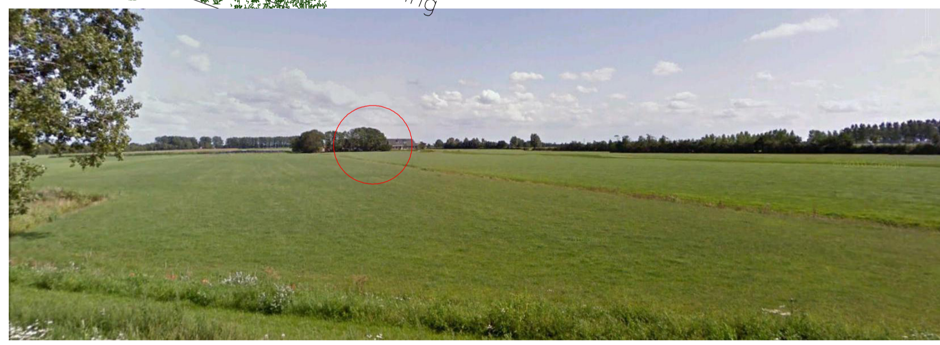
zicht op voorerf vanaf Lemsterweg