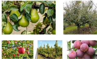
appel, peer, walnoot, pruif en

bestaande postte oystertuif achterzijde hoofdwandtuif eef