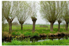
Wijgen en Tj kTj de waterloop achterzijde van het eef Wijden veeleiden Tj met nieuwe zTchtTjven

bestaande putten worden V Tjree, recycle goeden