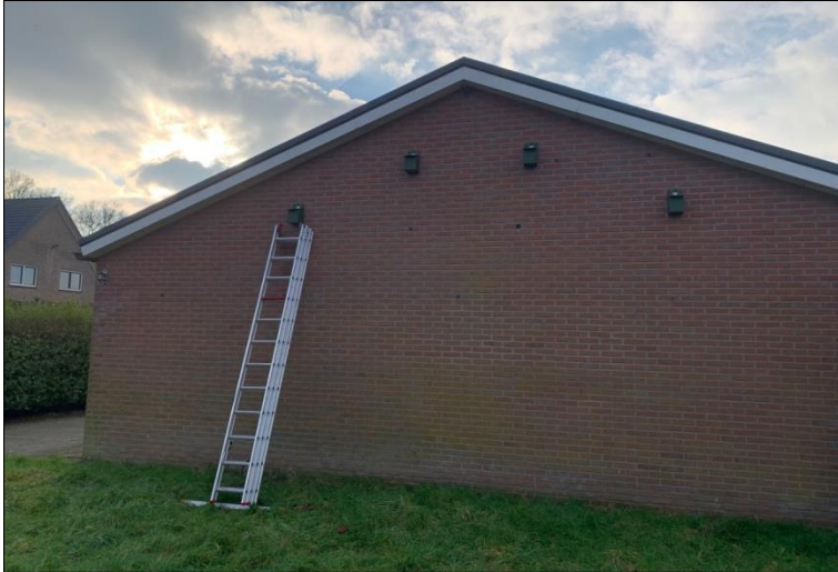
Foto 3. De opgehangen tijdelijke nestkasten voor huismus.