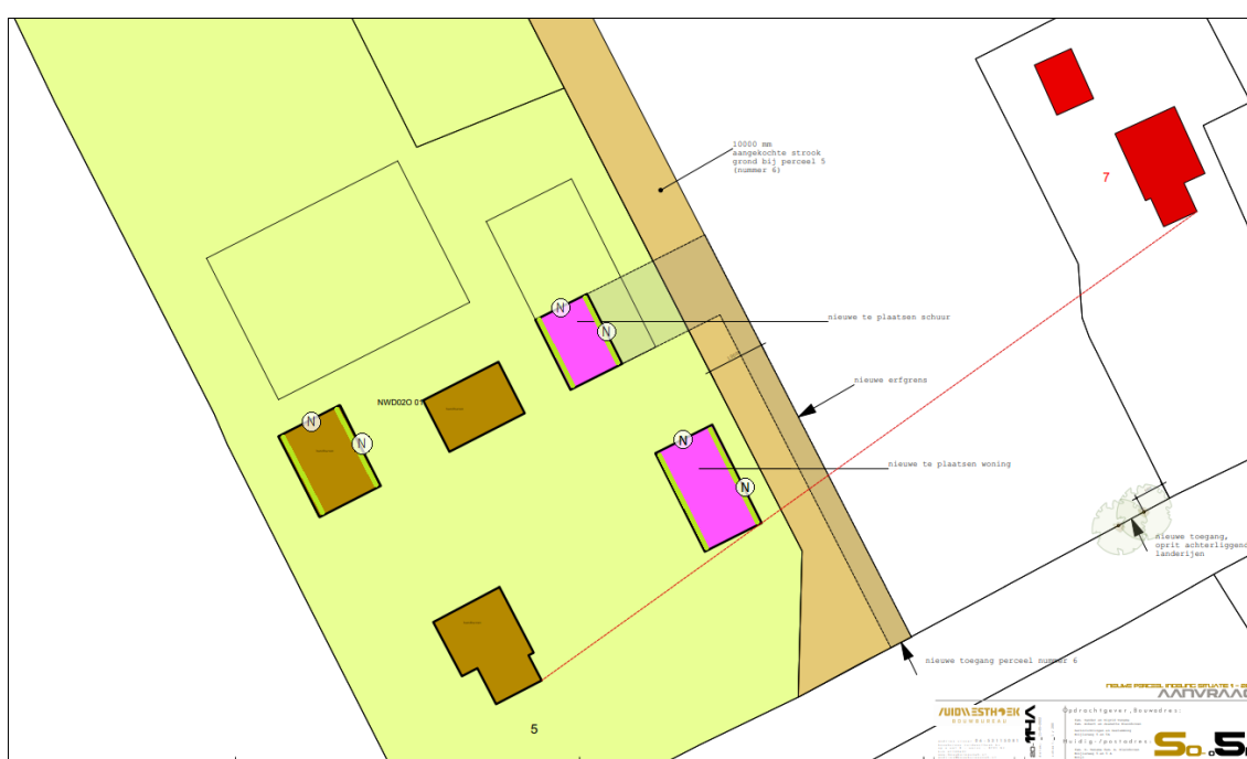
Figuur 3. Weergave van de inrichtingsschets met aan de oostzijde de nieuwe woning, ten noorden hiervan de nieuwe schuur (paars) en de gebouwen die behouden blijven (bruin). De zijdes waar de (pannen)daken toegankelijk kunnen worden gemaakt voor huismus zijn in groen weergegeven. De gevels waarin neststenen kunnen worden geplaatst, zijn aangegeven met N.

Bij de plaatsbepaling en het ophangen van kasten wordt een ter zake kundige op het gebied van huismus betrokken. Bij plaatsbepaling van nestkasten wordt onder meer rekening gehouden met een minimale hoogte van 3 m, een vrije aanvliegeroute en een ligging die in de zomerperiode niet te warm is.