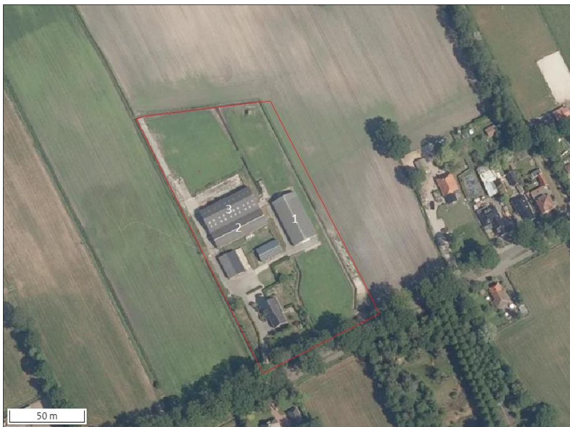
Figuur 1. Plangebied (rood omljnd). Bron kaartondergrond: www.ruimtelijkeplannen.nl .