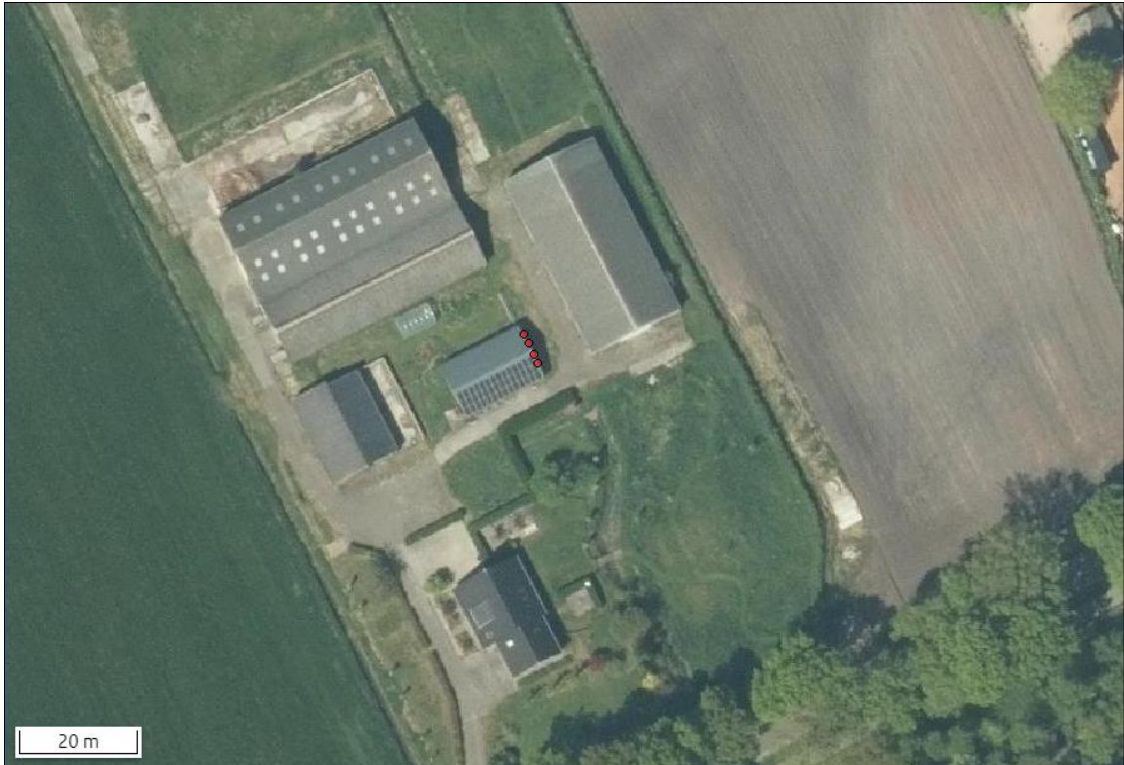
Figuur 2. Locaties van de tijdelijke nestkasten voor huismus (rood).