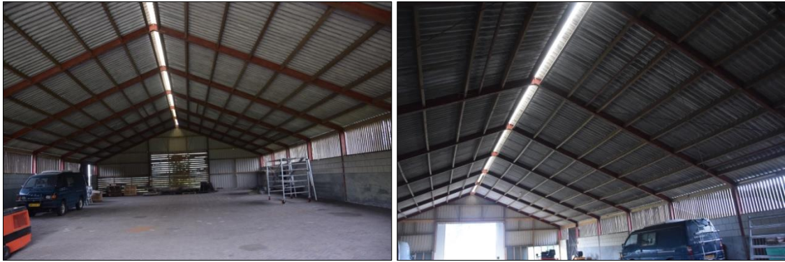
Foto's 1 en 2. Impressie van het plangebied op 14 september 2022.