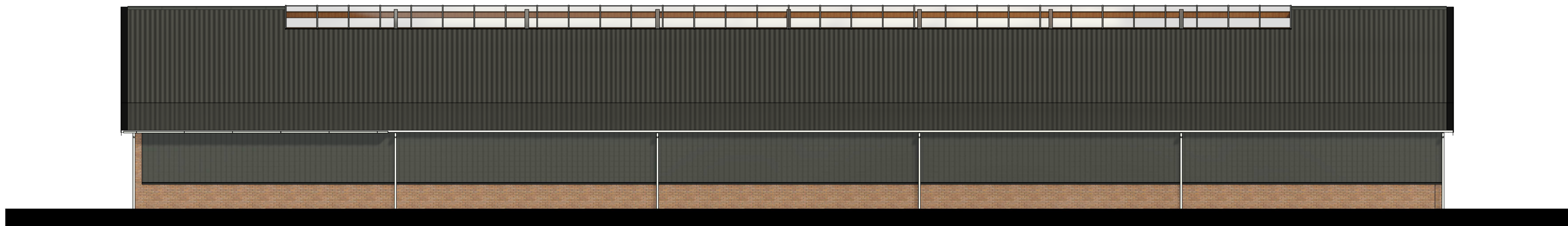
Rechtergevel 1 : 100