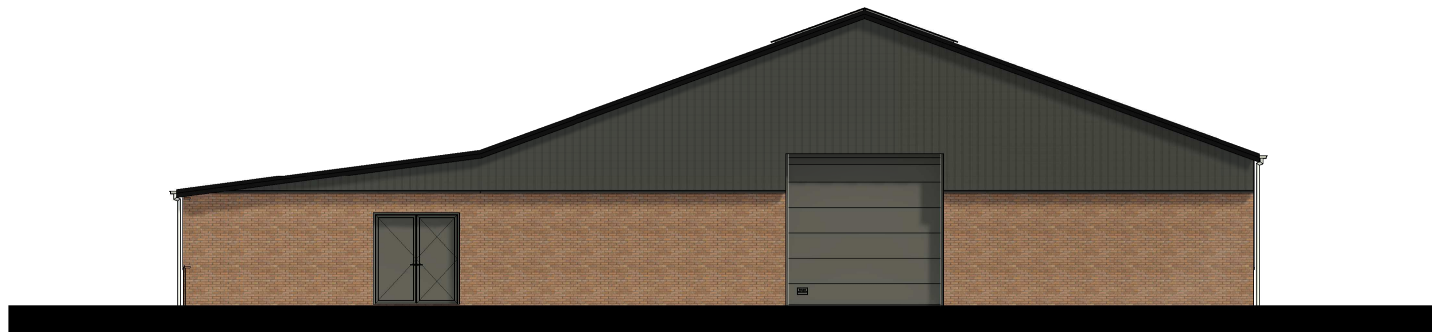
Achtergevel 1 : 100