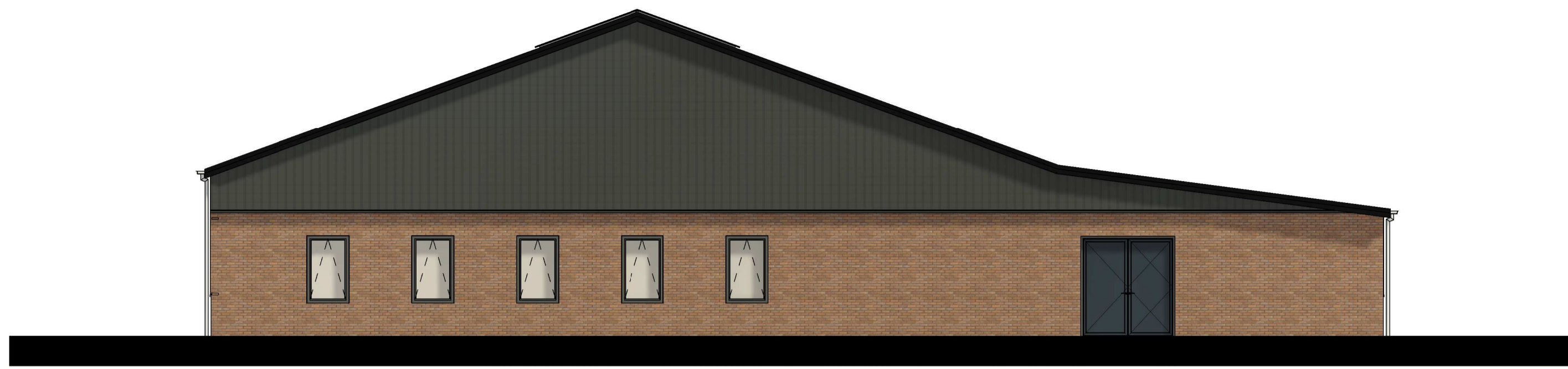
Voorgevel 1 : 100