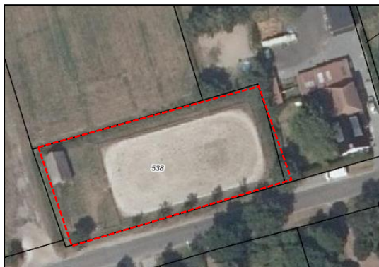
Figuur 1. Overzicht van het plangebied (rode stippellijn).