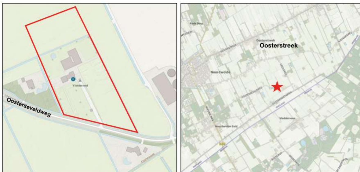
Afbeelding 1.1 Ligging van het plangebied ten opzichte van de omgeving

Het plangebied is gelegen aan de Oosterseveldweg 43 in het buitengebied van de gemeente Weststellingwerf. De locatie is kadastraal bekend als gemeente Noordwolde, sectie M, nummers 1360, 1362 en 1363 gedeeltelijk. In afbeelding 1.1 is de ligging van het plangebied ten opzichte van Oosterstreek en de (directe) omgeving weergegeven.