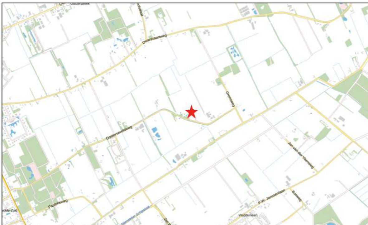
Afbeelding 5.1 Uitsnede Risicokaart

Uit de inventarisatie blijkt dan ook dat het plangebied: