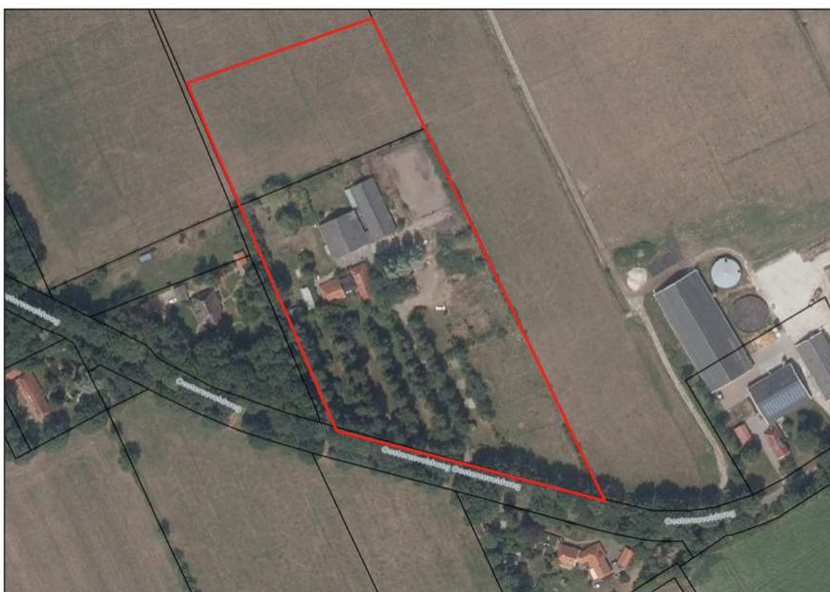
Afbeelding 2.1 Luchtfoto plangebied met indicatieve begrenzing

Functioneel bestaat de directe omgeving voornamelijk uit agrarische cultuurgronden, woonerven en enkele agrarische en niet-agrarische bedrijfspercelen. De ligging en begrenzing van deze locatie wordt weergegeven op de luchtfoto in afbeelding 2.1. Opgemerkt wordt dat de planbegrenzing indicatief is. Voor de exacte planbegrenzing wordt verwezen naar de verbeelding.