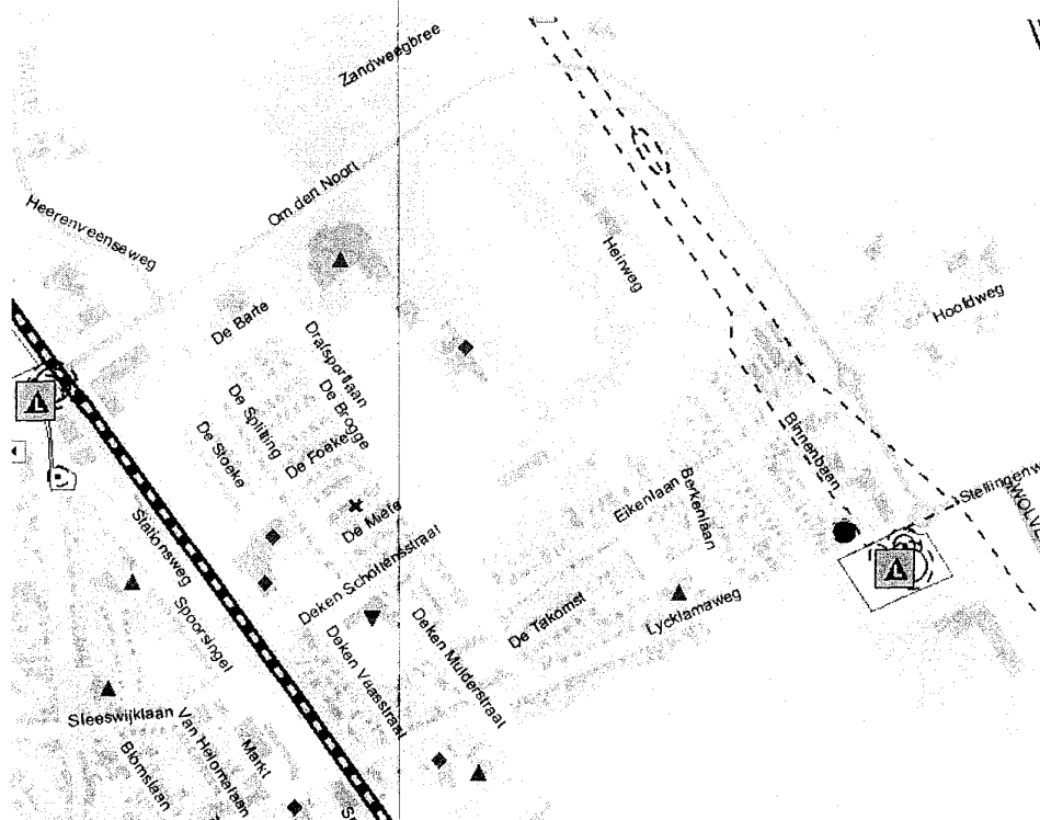
Abbeelding 1: Uitsnede 23-02-2010 uit de risicokaart betreffende risicovolle activiteiten in het plangebied

Hieronder is de uitsnede van de professionele risicokaart opgenomen.