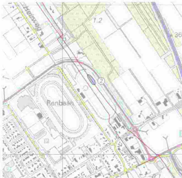
Afbeelding 1 Plaatsgebonden risicocontour

Onderwerp: Art.3.1.1. reactie voorontwerpbestemmingsplan Wolvega - Noordoost