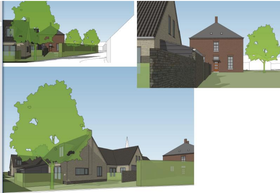
Figuur 2.4: Sfeerimpressie en zichtlijnen (bron: COM_zone_ARCHITECT)