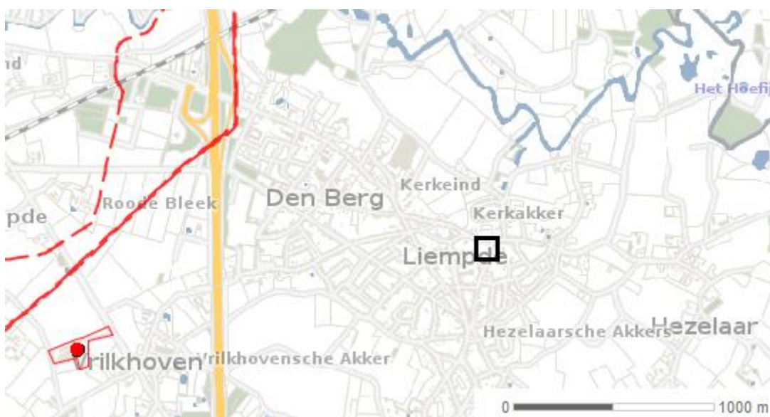
Figuur 4.2: Uitsnede risicokaart ter hoogte van plangebied