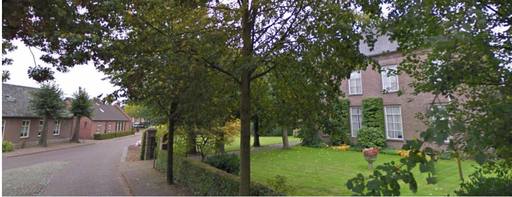
Figuur 2.2: Aanzicht vanaf het noordwesten op de pastorie (rechts) met doorkijk naar pastorietain (midden)

Op het terrein zijn diverse bomen aanwezig verspreid over de locatie. Het merendeel van de bomen is begroeid met klimplanten. Binnen het plangebied zijn twee grasvelden aanwezig; een grasveld aan de ingang van de pastorietain en een grasveld verscholen tussen de begroeiing. Binnen het plangebied zijn enkele overkappingen aanwezig. Rondom het grasveld is een laag hekwerk geplaatst.