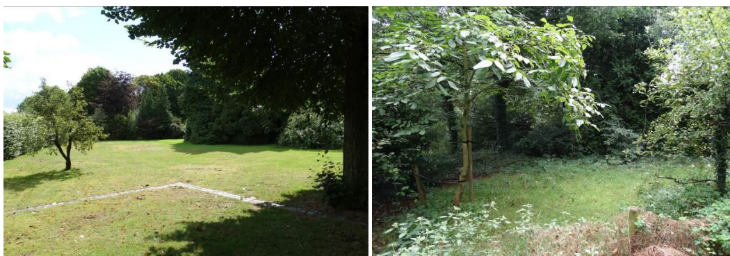
Figuur 2.1: Bestaande situatie, verwilderde pastorietuin

Het (nog niet gesplitste) perceel bestaat in de huidige situatie uit een erf met de pastoriewoning en een pastorietuin. De pastorietuin is begroeid met grassen en bomen. Het terrein is sterk verwilderd.