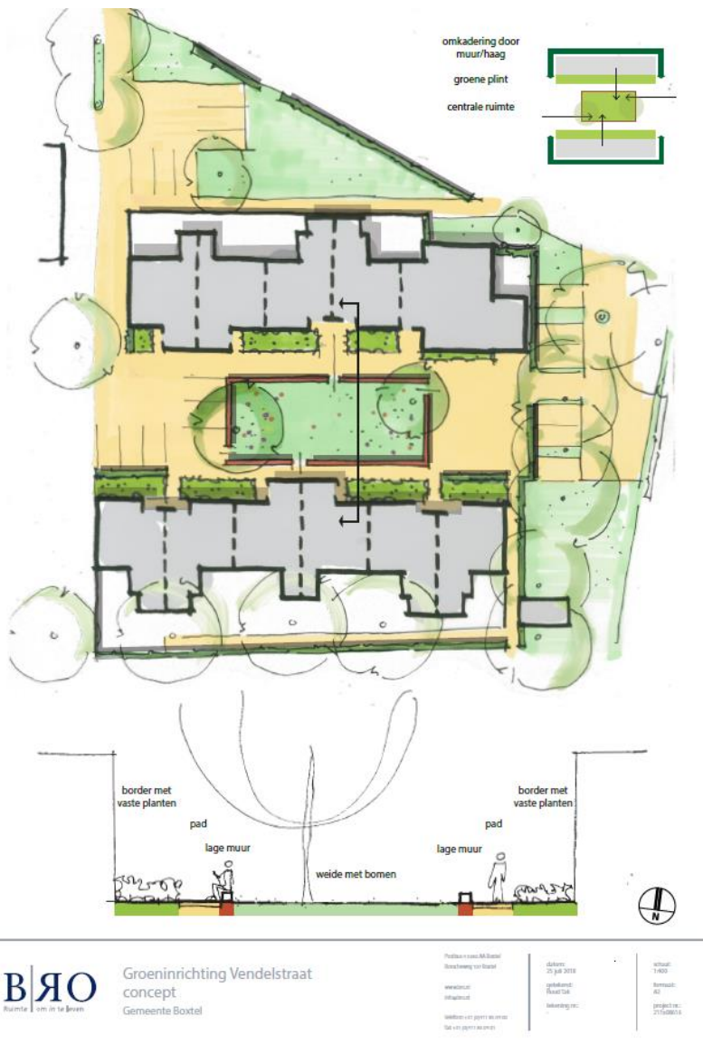
Figuur 2.6: Inrichtingsvoorstel groen