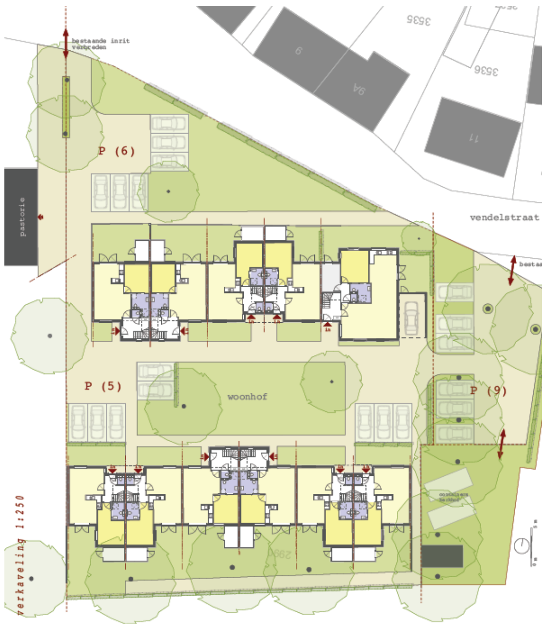
Figuur 2.5: Verkaveling woningtypes