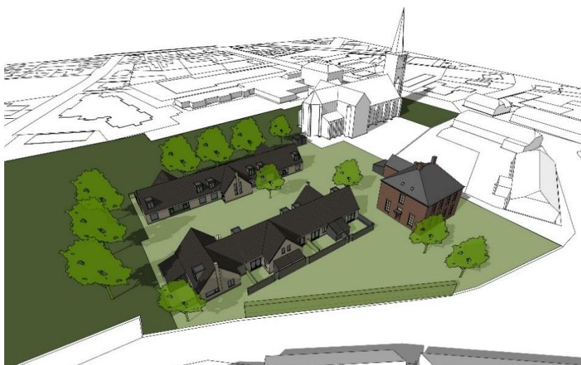
Figuur 2.3: schetsontwerp / stedenbouwkundige opzet in vogelperspectief

In materialisering en kleurstelling worden rustige, natuurlijke materialen en accenten gevraagd. Qua materialen valt te denken aan gevels uitgevoerd in baksteen en/of hout, daken met een gebakken pan. De kleuren van de gevelvlakken zijn te kenmerken als aards zonder al te veel nuanceringen, aansluitend op het palet in de directe omgeving. Eventueel zijn eigentijdse en/of afwijkende kleuren mogelijk op specifieke planonderdelen. De daken worden uitgevoerd in een keramische pan in de kleur leigrijs. Op een aantal plekken worden accenten van kopergroene rabat in de bebouwing verwerkt. De Monumentencommissie stelt voor één dakkapel in kopergroene rabat uit te voeren en na oordelen een beslissing te maken. De bijgebouwen en schuttingen worden uitgevoerd in een potdeksel met zwarte kleur.