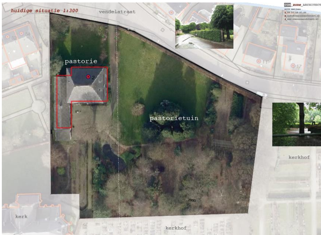
Figuur 1.1: Begrenzing plangebied (pastorietuin)