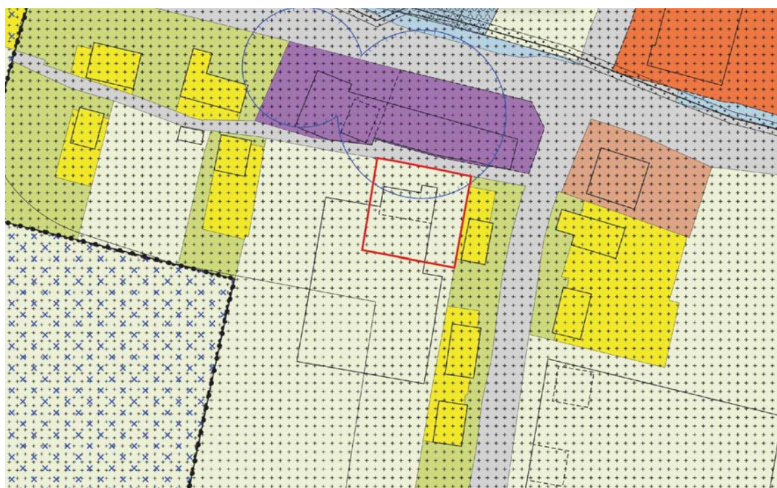
Figuur 1.4: Uitsnede vigerend bestemmingsplan 'Stedelijk gebied' met plangebied (rood omlijnd)

De Klapstraat maakt deel uit van het bestemmingsplan 'Stedelijk gebied'. Dit bestemmingsplan is de afgelopen jaren bijgesteld door middel van periodieke herzieningen. In veegplannen, zijn meerdere kleinere deelprojecten, wijzigingen in regels en plankaart in de hele gemeente Druten integraal meegenomen. Voor dit plangebied is qua verbeelding de vierde herziening relevant. Dit plan is vastgesteld op 30 januari 2020.