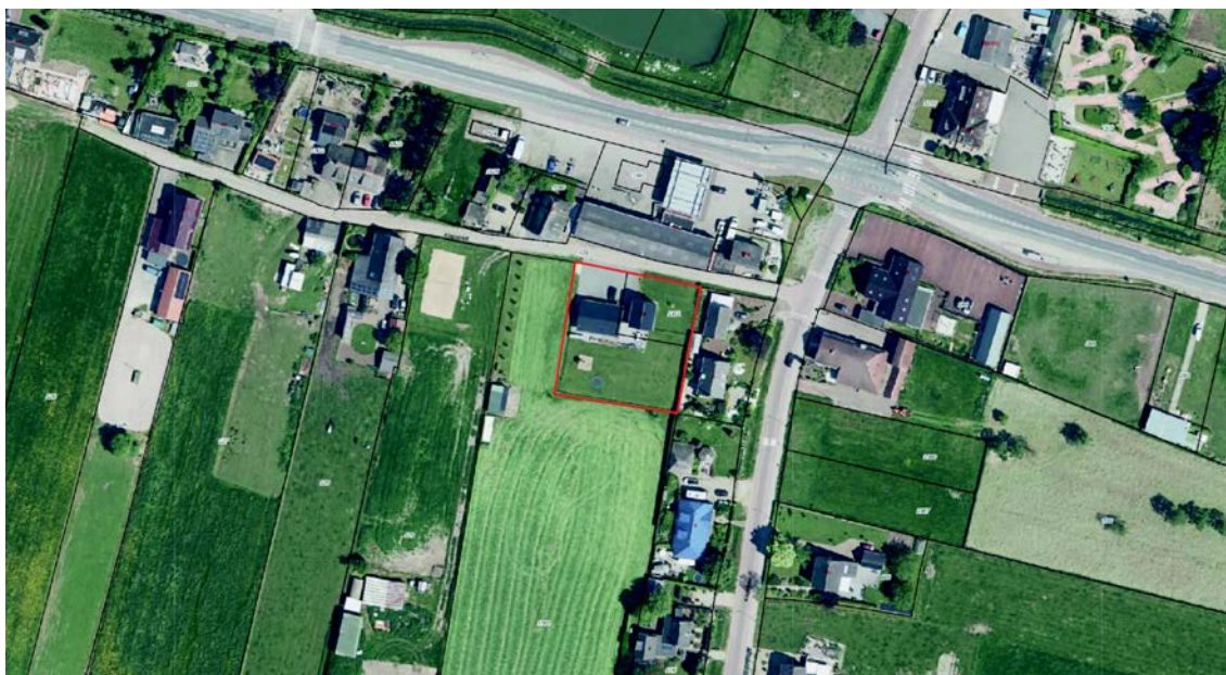
Figuur 1.1 Uitsnede kadastrale kaart met projectie plangebied (rode stippellijn) (bron:kadastralekaart.com)

De initiatiefnemer beoogt om de bestaande agrarische bedrijfswooning om te vormen naar burgerwoning. Deze woning heeft momenteel nog een agrarische bestemming met bouwperceel. In de bestaande bestemmingsplanregels is een wijzigingsbevoegdheid opgenomen om deze bestemmingswijziging te bewerkstelligen. Deze bevoegdheid maakt het, onder voorwaarden, mogelijk de bestemming te wijzigen in het geval van bedrijfsbeëindiging. Het agrarisch bouwperceel zal daardoor verdwijnen.