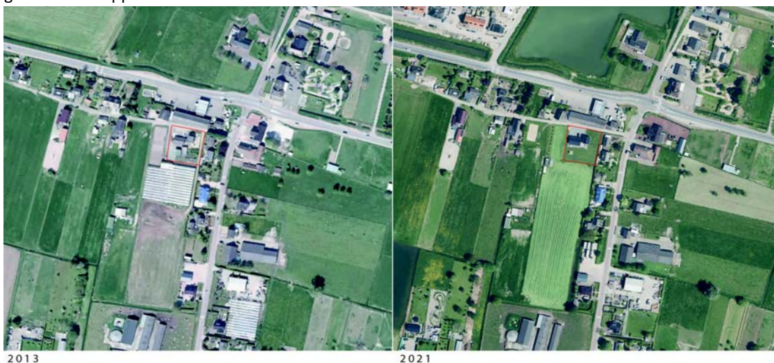
Figuur 1.2 oorspronkelijk aanwezige opstallen

De wijziging van de bestemming van de locatie aan de Klapstraat 8a betreft twee percelen die bekend staan als kadastrale gemeente Druten sectie D, nummer 1301 en een deel van perceel 1302. In totaal gaat om een oppervlakte van circa 1524 m 2 .