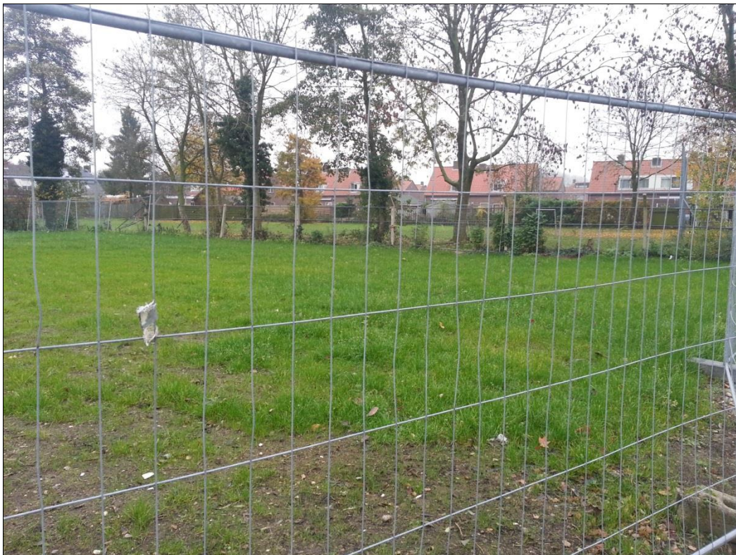
Foto 2. Ingezaaid grasveld