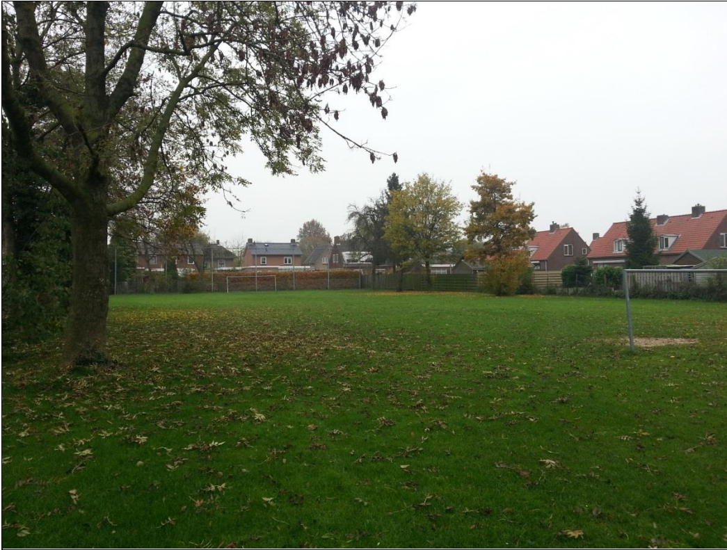
Foto 3. Naast gelegen speelveld