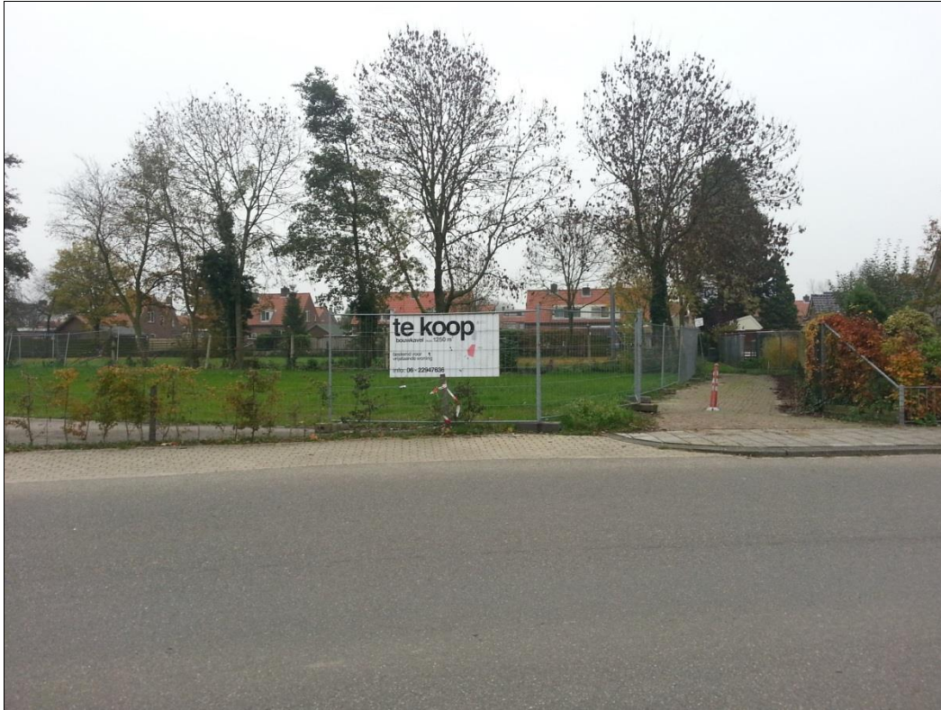
Foto 1. Onderzoekslocatie gezien vanaf de Meester van Coothstraat