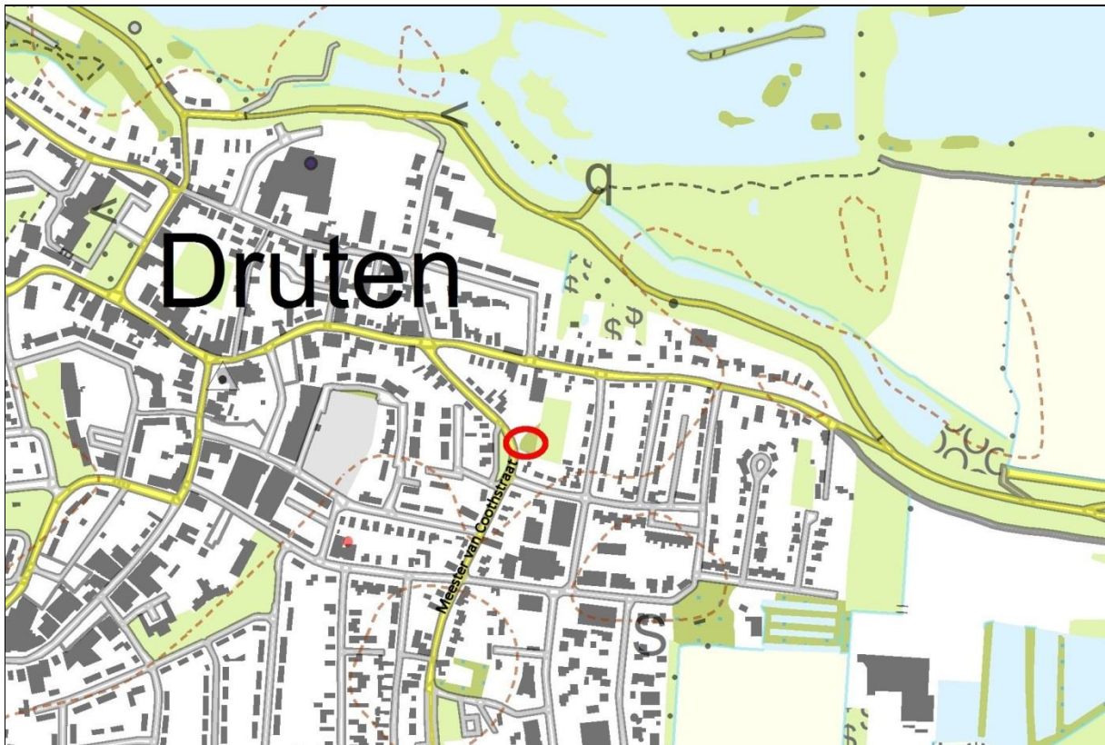
Afbeelding 1. Onderzoekslocatie

Op de volgende pagina zijn enkele foto's opgenomen die een indruk geven van de onderzoekslocatie.