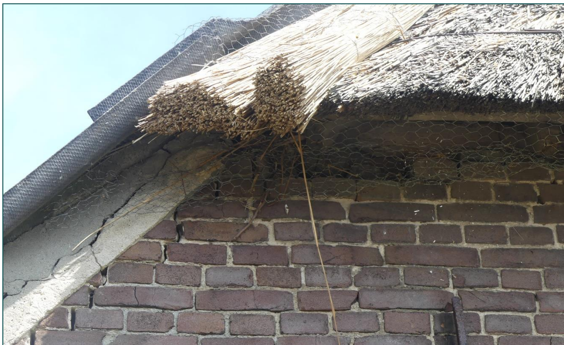
Figuur 1 De schuur op de planlocatie opgebouwd uit bakstenen muren. Het dak bestaat voor de onderste helft uit dakpannen en voor de bovenste helft uit riet. Aan de westzijde is gaas aanwezig, waardoor vogels niet onder het riet kunnen komen.