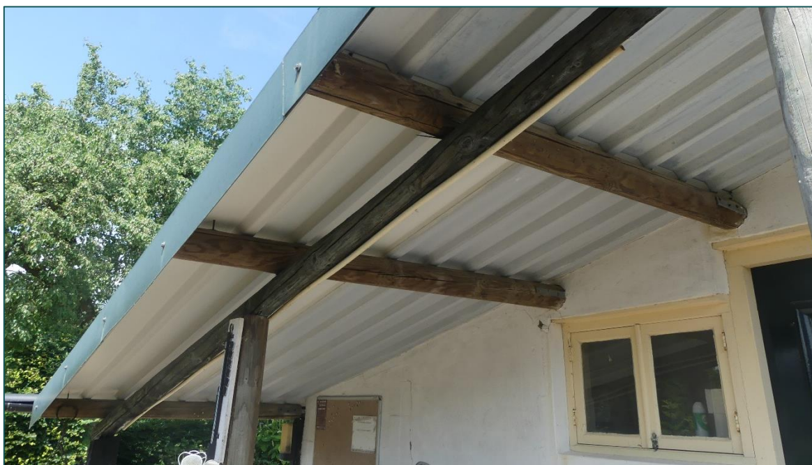
Figuur 2 Het campinggebouw bestaat uit gestucte muren en heeft een damwandplaten dak.