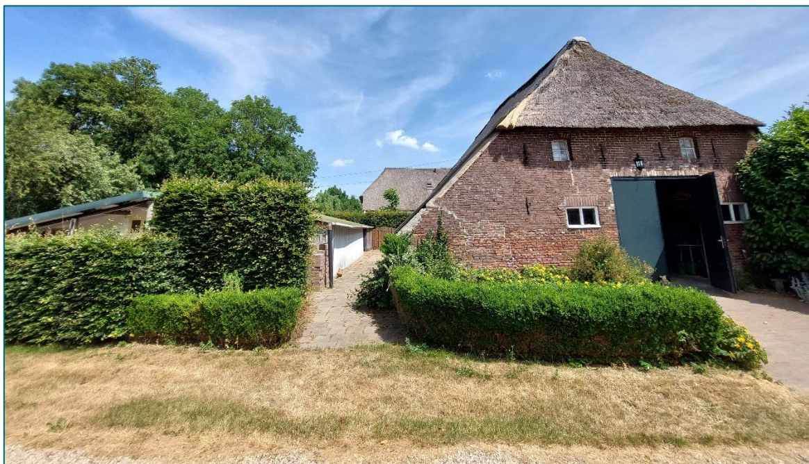
Figuur 1.1 De planlocatie is gelegen aan de Koningstraat 15a te Afferden.