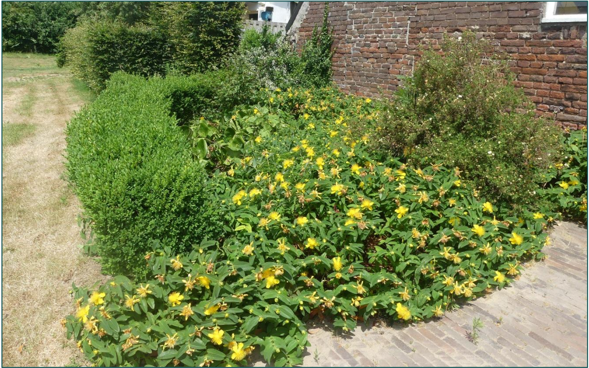
Figuur 3 De groenstructuren zijn vooral aanwezig in de tuin rondom de bebouwing.