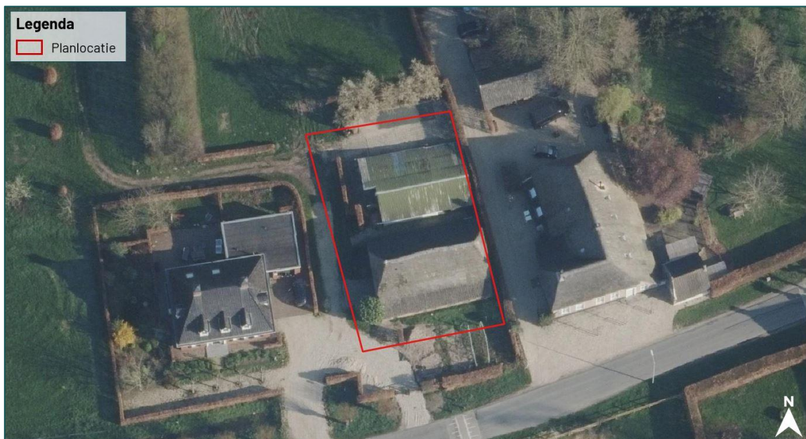
Figuur 1.2 De planlocatie (rood omkaderd) is gelegen aan de Koningstraat 15a te Afferden.

De planlocatie is gelegen aan de Koningstraat 15a te Afferden (figuur 1.2). Op de planlocatie zijn het hoofdgebouw van een voormalig camping en een schuur aanwezig. Het campinggebouw is opgebouwd uit gestucte muren en een damwandplaten dak. Er is geen spouw of dakbeschot aanwezig. Rondom het gebouw zijn verschillende materialen opgeslagen, zoals houtstapels, aanhangers en dakpannen. De schuur is opgebouwd uit bakstenen muren zonder spouw. Er is een zolder aanwezig die volledig door een plafond geheel gescheiden is van de begane grond. Het onderste deel van het dak bestaat uit dakpannen, het bovenste deel uit riet. De muren van de schuur zijn op meerdere plekken vervallen, waardoor gaten aanwezig zijn. Aan de westzijde is er gaas aanwezig, zodat vogels niet onder het riet kunnen komen. Rondom de gebouwen is een tuin aanwezig. Bij de ingreep worden geen groenstructuren verwijderd. In figuur 1.3, figuur 1.4 en bijlage 1 zijn een aantal foto's opgenomen die een impressie geven van de planlocatie en de directe omgeving hiervan.