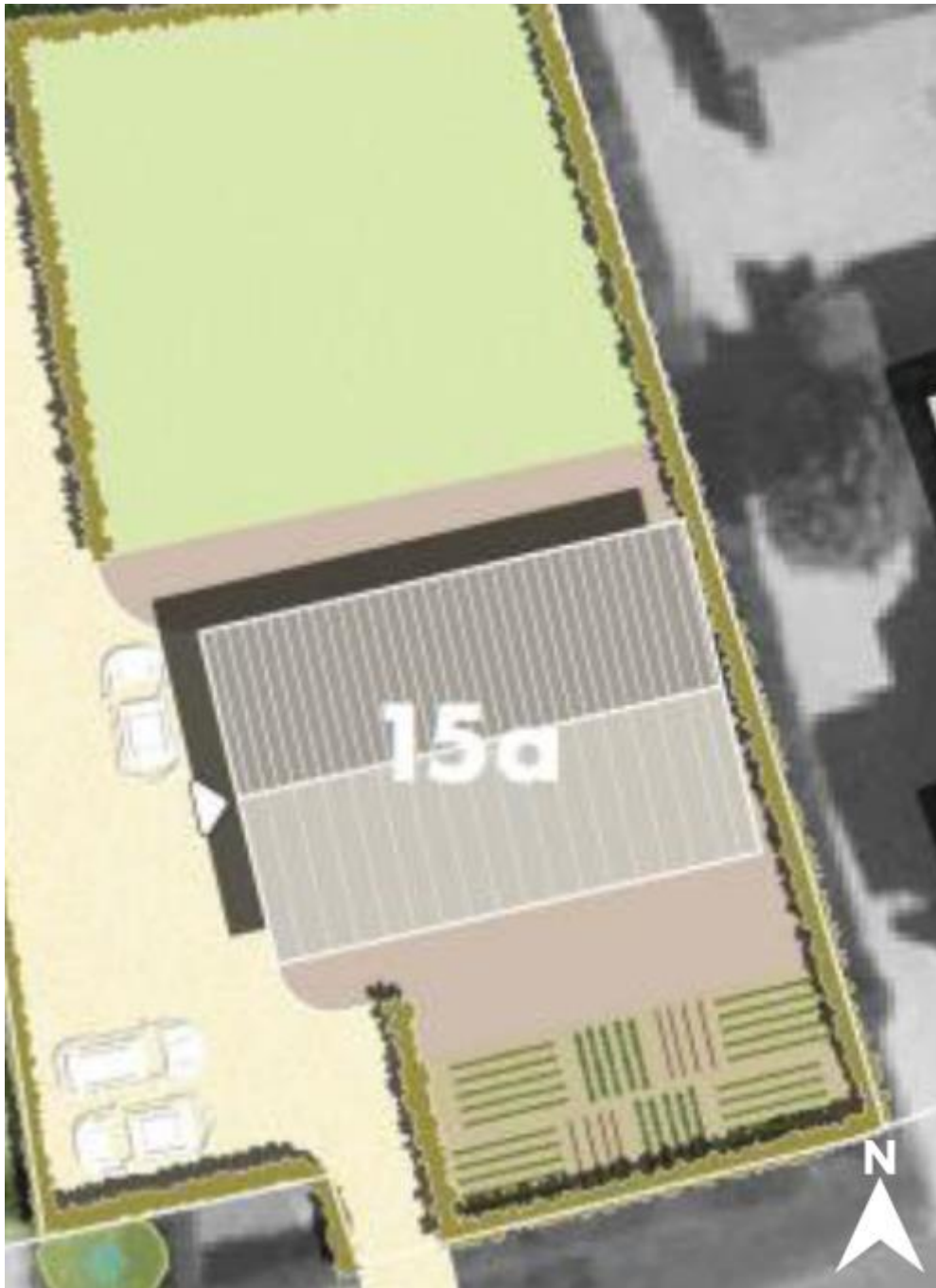
Figuur 1.5 Visuele representatie van de beoogde situatie.