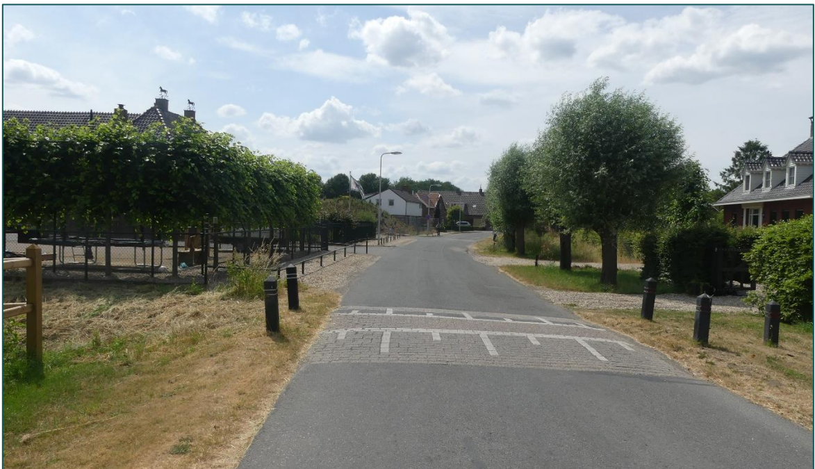
Figuur 1.4 Fotografische indruk van de omgeving van de planlocatie.