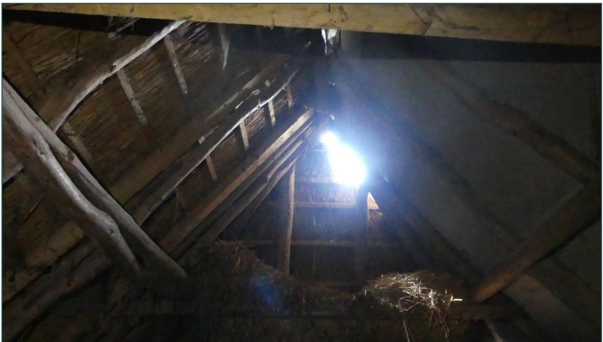
Figuur 4 Op de zolder van de schuur is geen verlichting aanwezig, enkel door een aantal kieren is er lichtinval.