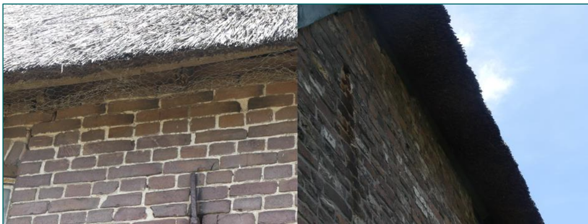
Figuur 3.1 Aan de oostzijde (links) is wel gaas aanwezig, aan de westzijde (rechts) niet. Hierdoor kunnen mussen nesten onder het rieten dak maken.

De gierzwaluw heeft als oorspronkelijk rotsbewoner de rotsen ingeruild voor bebouwing. De soort broedt daardoor hoofdzakelijk in stedelijk gebied in donkere holtes van ventilatieschachten, spleten in muren en onder (pannen)daken (BIJ12 kennisdocument Gierzwaluw, 2017). Doordat de soort niet direct vanuit zijn nest kan opstijgen, moet hij zich naar beneden kunnen laten vallen. Het nest dient hierdoor een vrije aanliegroute van minimaal 1 meter breed, en minimaal 3 meter onder de nestopening te bevatten. Hierbij dienen zo min mogelijk belemmerende elementen, zoals bomen, aanwezig te zijn. Voedselvluchten kunnen op vele kilometers (tot wel 1000 km) van het nest plaatsvinden, waardoor het foerageergebied niet nader te definiëren is. Het campinggebouw op de planlocatie is opgebouwd uit gestucte muren met een damwandplaten dak. De hoogte van het gebouw is minder dan 3 m en er zijn