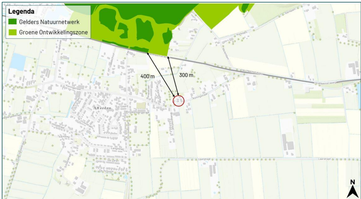
Figuur 3.3 De planlocatie ligt op een afstand van circa 400 m tot het Gelders Natuurnetwerk en 400 m tot de Groene Ontwikkelingszone.