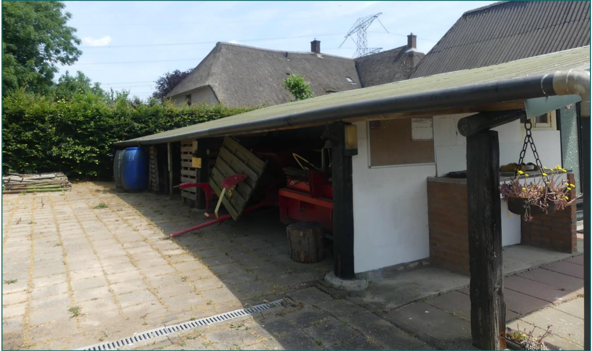
Figuur 1.3 Op de planlocatie is men voornemens om het campinggebouw te slopen.