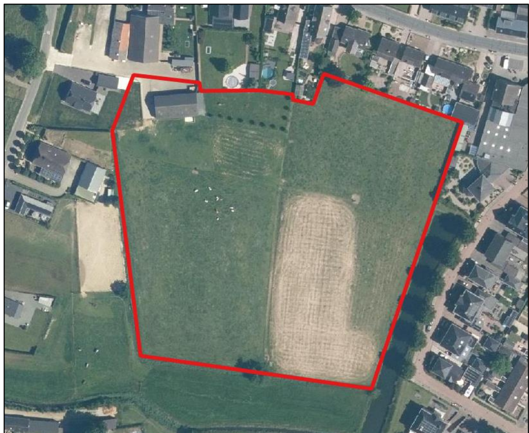
Luchtfoto met de globale ligging van het plangebied (rood omkaderd).