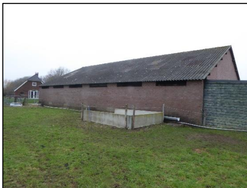
Achterzijde van de schuur;