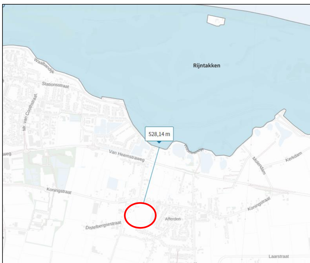
Globale ligging van het plangebied (rood omkaderd) ten opzichte van Natura 2000-gebieden.

Het plangebied ligt niet in een gebied dat in het kader van de Wet natuurbescherming is aangewezen (zie navolgende afbeelding). Wel ligt Natura 2000-gebieden "Rijntakken" in de directe omgeving van het plangebied. Deze ligt 530 meter van het plangebied verwijderd.