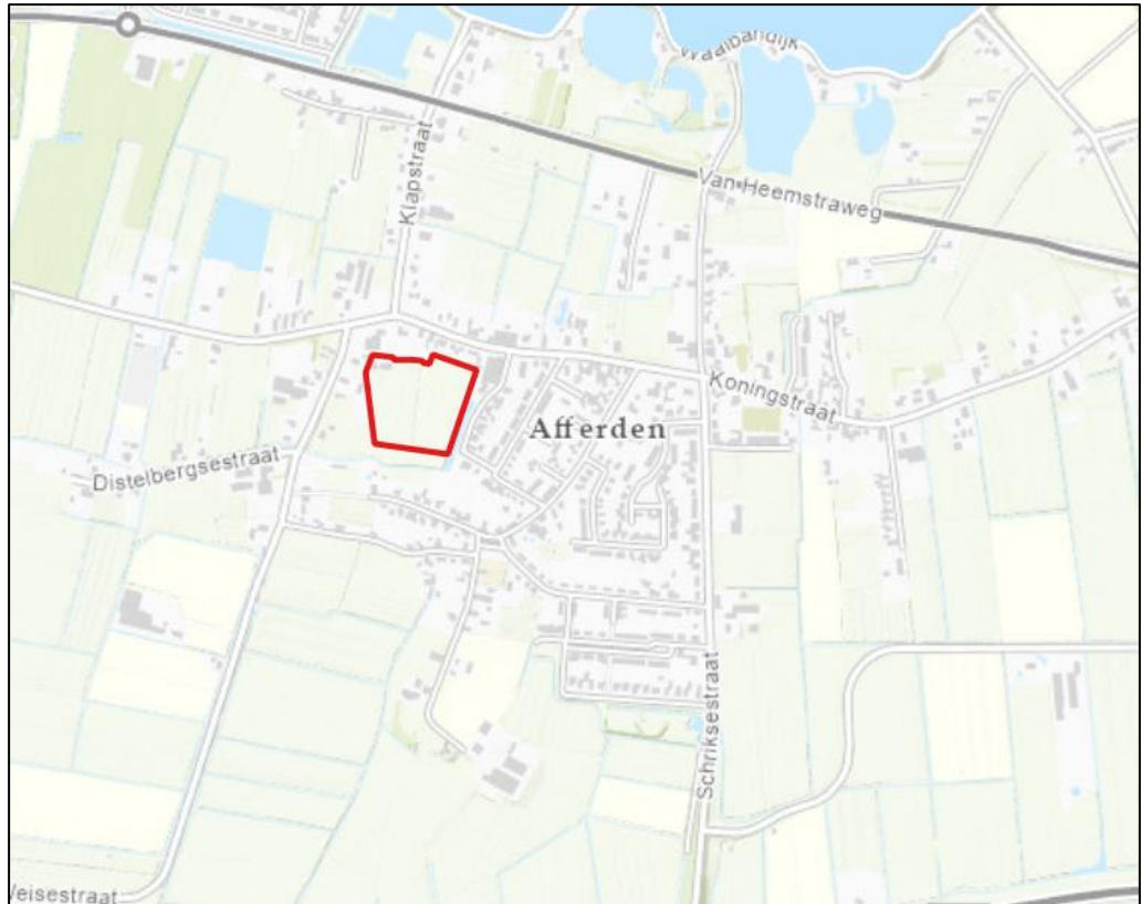
Topografische kaart met de globale ligging van het plangebied (rood omkaderd).