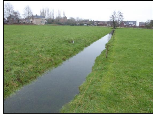
Eén van de watergangen;