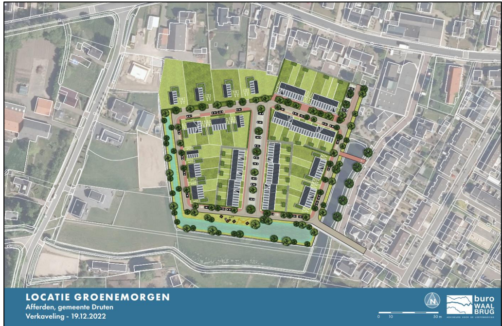
Schets van de toekomstige situatie.