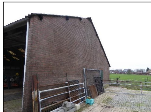
Voorzijde en zijkant schuur.