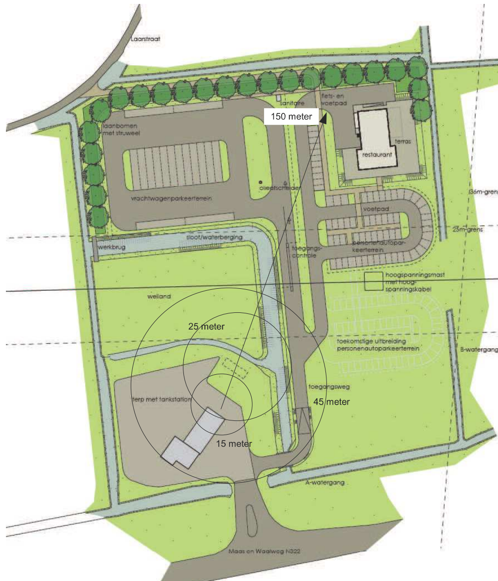
Afbeelding 2: Geprojecteerde situatie inclusief aan te houden afstanden

Uit afbeelding 2 blijkt dat voor het plaatsgebonden risico ruimschoots wordt voldaan aan het plaatsgebonden risico van 10^{-6} per jaar. Het te realiseren wegrestaurant en de overnachtingsplaatsen voor vrachtwagens zijn wel gelegen binnen het invloedsgebied van het groepsrisico van 150 m. Voor een beoordeling van het groepsrisico wordt aangesloten bij het document "Stappenplan groepsrisicoberekening LPG-tankstations" d.d. 12 augustus 2008 door het Centrum Externe Veiligheid van het Rijksinstituut voor Volksgezondheid en Milieu. Dit stappenplan heeft betrekking op LPG-tankauto's welke niet zijn voorzien van een hittewerende coating (worst case). Bij een doorzet van maximaal 999 m 3 /jaar en een continue aanwezigheid van maximaal 9 personen/hectare (60 personen in het totale invloedsgebied) wordt de oriënterende waarde niet overschreden.