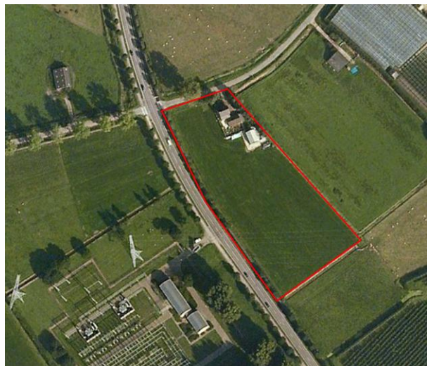
Globale ligging plangebied.