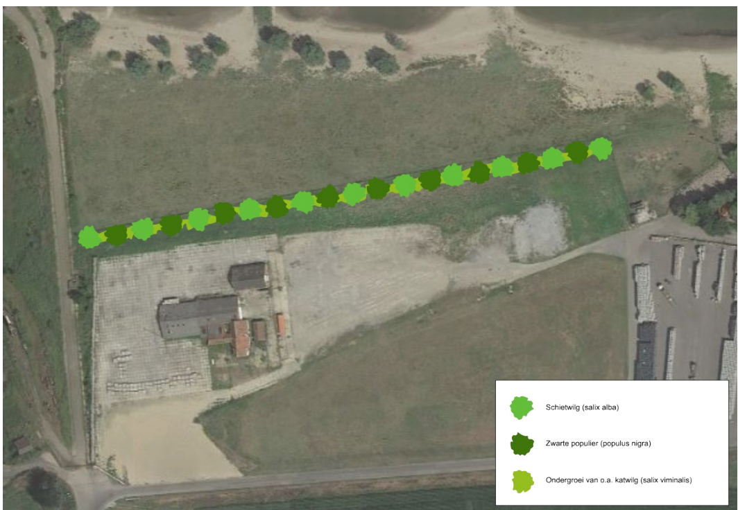
Figuur 2.8: Inrichtingsschets landschappelijke inpassing Deelensterrein