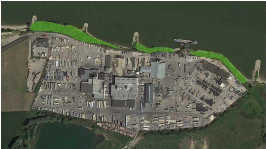
Figuur 2.1: Aanwezig opgaand groen Exclutonterrein

Ten noorden van het excluton is momenteel veel opgaand groen te vinden (zie figuur 2.1 & 2.2). Dit betreft allemaal wildgroei bestaande uit voornamelijk wilg. Er is hier nooit landschappelijke inpassing toegepast, maar door de vrije ruimte tussen het bedrijfsterrein en de Waal is er toch hoog opgaand groen gekomen. Door gebrek aan ruimte en het feit dat i.v.m. doorstroming van de Waal het opgaand groen niet mag toenemen, zal op deze locatie geen extra groen toegevoegd worden.