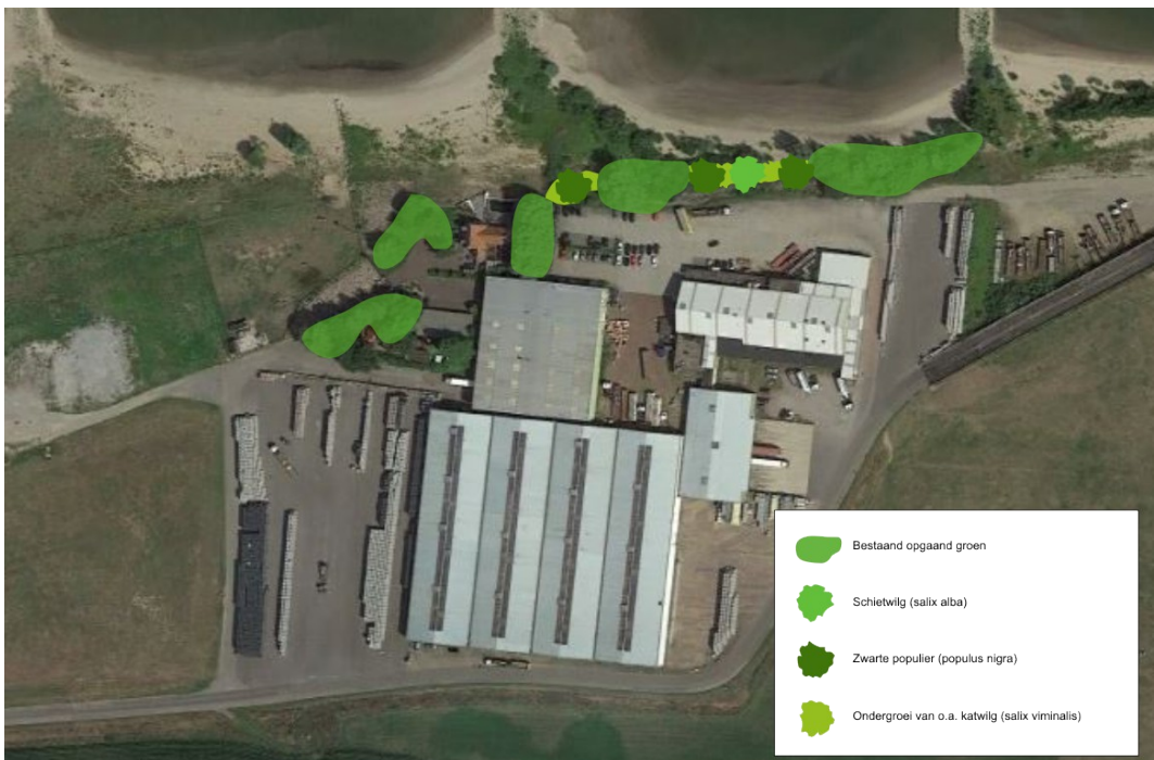
Figuur 2.10: Inrichtingsschets landschappelijke inpassing Conpaxterrein

Het Conpaxterrein is grotendeels al voorzien van landschappelijke inpassing (zie bijlage 1). Daarom zullen de ingrepen hier wat beperkter zijn dan bij het Deelensterrein. Ook hier wordt gewerkt met streekeigen soorten zoals schietwilg, katwilg en zwarte populier. Deze worden aangeplant op de open plekken tussen het opgaande groen aan de noordzijde van het bedrijventerrein (zie figuur 2.10). De aanwezige beplanting zal extensief worden beheerd, waarbij eens in de 20 jaar selectief gekapt zal worden om verjonging te bevorderen. Ook zal er aan de zijde van het bedrijventerrein iedere drie jaar een Visual tree assessment (VTA) uitgevoerd worden.