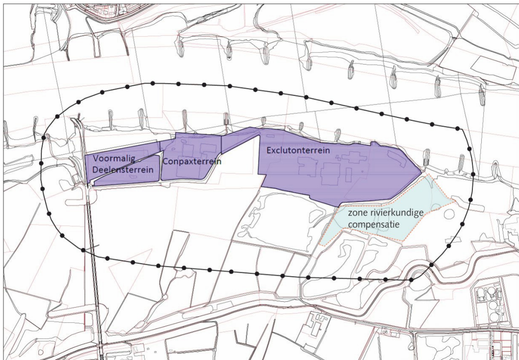
Figuur 1.1: Begrenzing plangebied met daarbinnen de bestaande bedrijfsterreinen

Het plangebied van het bestemmingsplan omvat zowel de bedrijfsterreinen van Excluton (inclusief het voormalige Deelensterrein) en Conpax als de binnen de nieuwe 50 dB(A)-contour gelegen delen van de uiterwaarden en van de rivier de Waal (zie figuur 1.1). Hierdoor maakt ook de ontsluitingsweg die de bedrijfsterreinen met elkaar en met de Noord Zuid verbindt, deel uit van het plangebied, evenals de gronden ten zuiden van het voormalige Deelensterrein waar uitbreiding van het bedrijventerrein is voorzien. Het plangebied ligt tussen de rivier de Waal in het noorden en de Waalbandijk in het zuiden. Een klein gedeelte van de Waalbandijk ligt binnen het plangebied. In het westelijk deel van het plangebied ligt de Noord Zuid. Ten zuidoosten van het plangebied ligt de kern Druten.