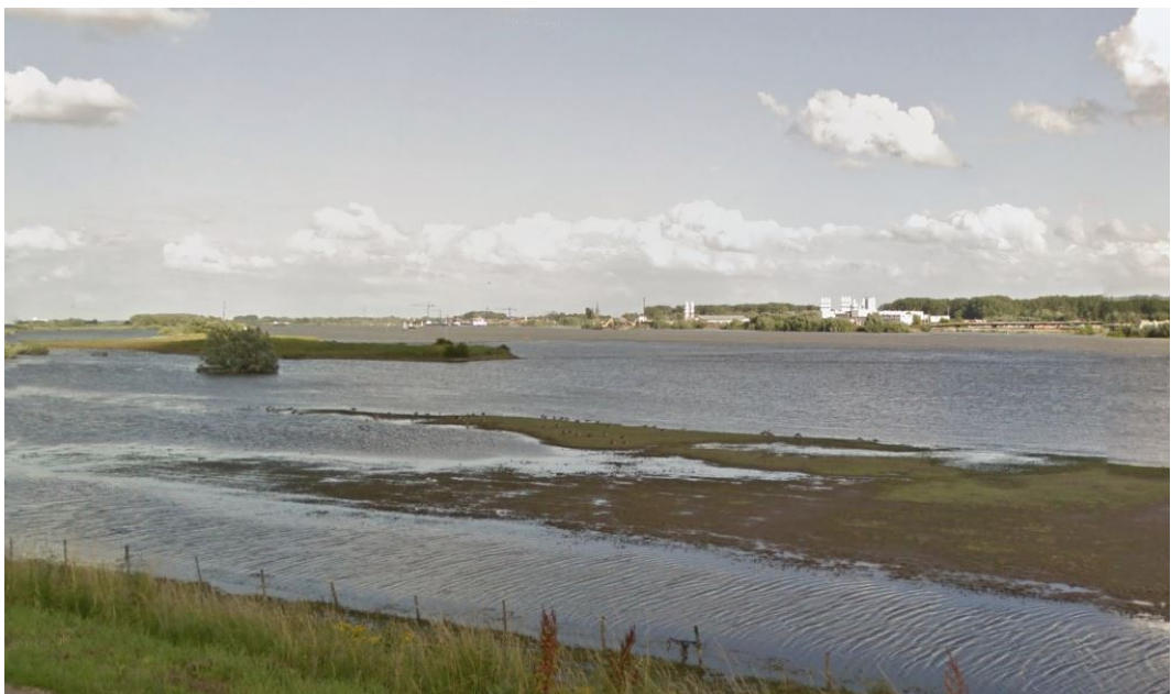
Figuur 2.2: Aanzicht Exclutonterrein vanaf Waalbandijk, Ochten (bron: Google streetview juli 2016)