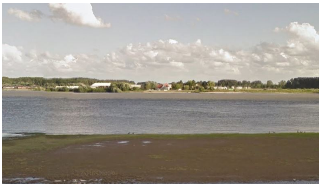
Figuur 2.4: Aanzicht Conpax- en Deelensterrein vanaf Waalbandijk, Ochten