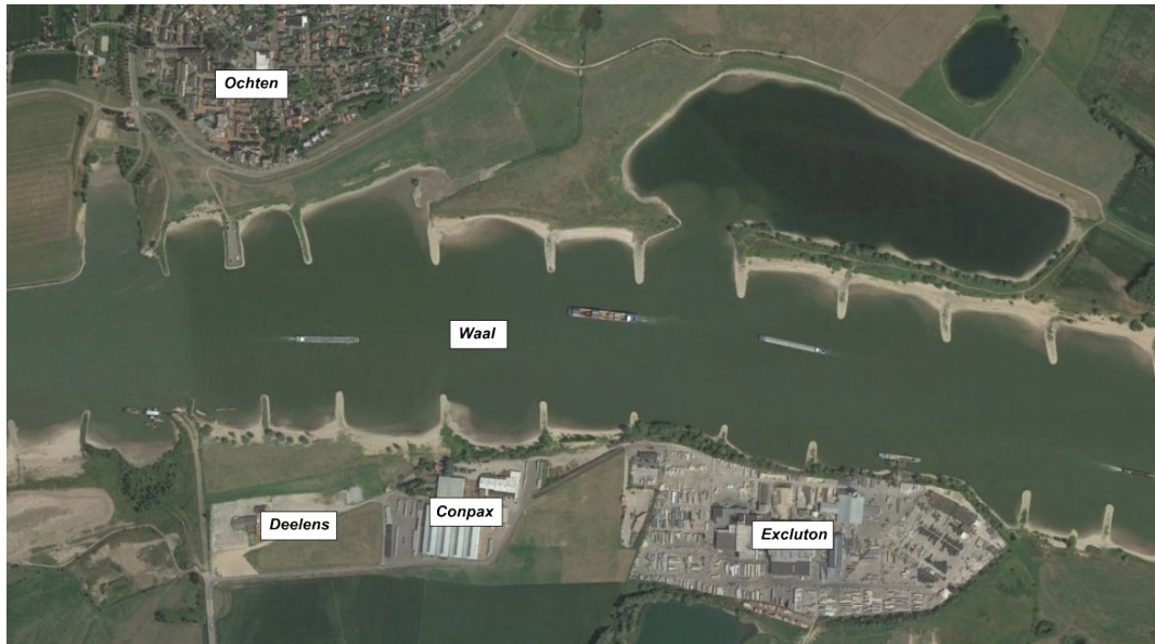
Figuur 2.5: Luchtfoto bedrijfsterein ten opzichte van de waal

Ter hoogte van het voormalig Deelensterrein ligt het bedrijventerrein het dichtst bij Ochten (Zie figuur 2.5). Door een combinatie van inrichtings- en beheermaatregelen zal daar het bedrijventerrein landschappelijk worden ingepast.