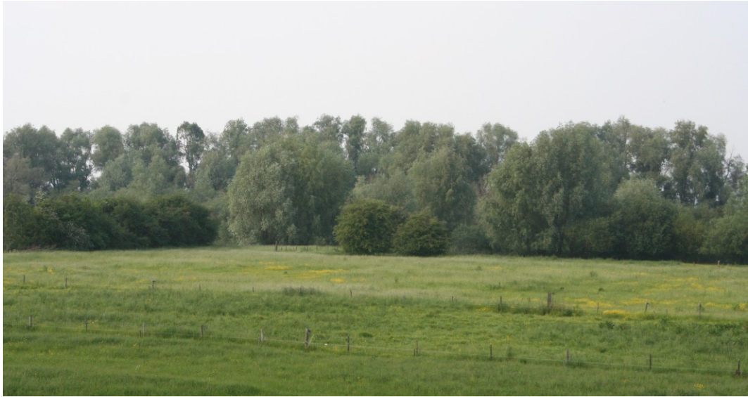
Figuur 2.9: Referentiebeeld landschappelijk inpassing