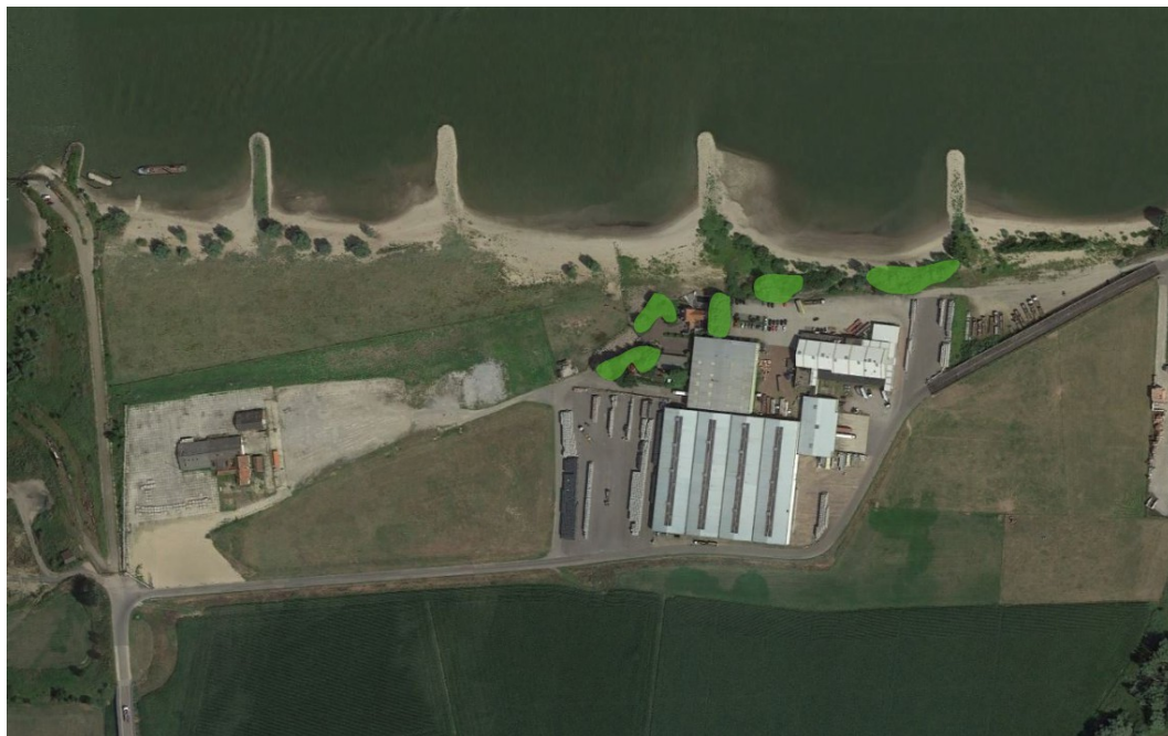
Figuur 2.3: Aanwezig opgaand groen Conpax- en Deelensterrein

Ook voor het Conpax- en Deelensterrein geldt dat hier nooit landschappelijke inpassing is aangeplant en het aanwezige opgaande groen van nature daar terecht is gekomen (zie figuur 2.3 & 2.4). Van de twee terrein is het conpaxterrein de enige die beschikt over bestaand opgaand groen, maar hier zijn nog een paar openingen tussen het groen waardoor de bedrijfsbebouwing nog te veel zichtbaar is. Voor het Deelensterrein geldt dat er geen opgaand groen aanwezig is en dat hier een strook landschappelijk inpassing aangeplant zal worden.