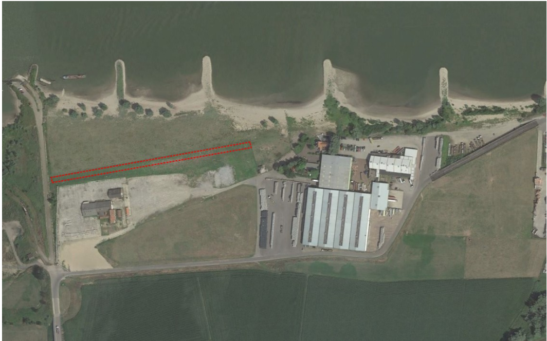
Figuur 2.7: Locatie landschappelijke inpassing Deelensterrein