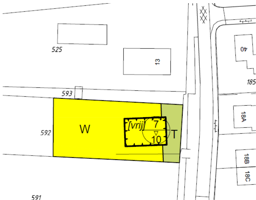
Afbeelding 3: Locatie nieuwe woning.

Voor de toekomstige plannen is beoogd de nieuwe woning te bouwen in de tuin. Hier-voor worden enkele bomen gekapt, struiken verwijderd en een vijver gedempt. De toekomstige locatie van de woning is in onderstaande afbeelding weergegeven.