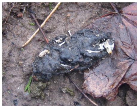
Afbeelding 4: Aangetroffen braakbal

In het plangebied zijn vier braakballen van uilen aangetroffen, het betreft waarschijnlijk een Kerkuil of Ransuil. Deze braakballen lagen verspreid onder de bomen in het plangebied. Beide soorten hebben hun nesten in gebouwen of in bomen. Met de plannen worden geen gebouwen gesloopt en worden geen bomen met nesten gekapt. De plannen leiden daarmee niet tot aantasting van verblijfplaatsen van uilen.