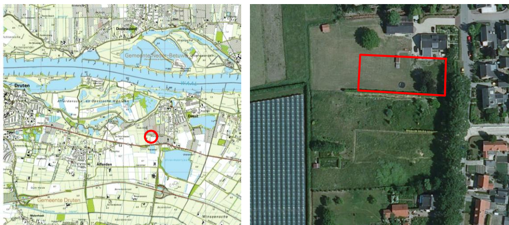
Afbeelding 1: Globale ligging plangebied

In Deest (gemeente Druten, provincie Gelderland) is aan de Bijmansstraat, ten zuiden van nummer 13, de bouw van één nieuwe woningen beoogd. Eén van de haalbaarheidsstudies die hiervoor dient te worden uitgevoerd is toetsing aan de natuurregelgeving. Voorliggende quick scan flora en fauna is opgesteld door SAB en geeft een eerste inzicht in de doorwerking van de natuurwetgeving op deze plek.