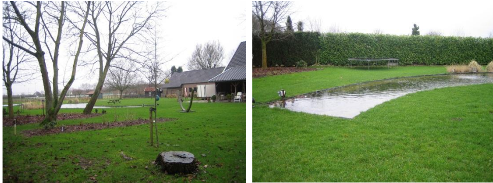
Afbeelding 2: Globale indruk plangebied