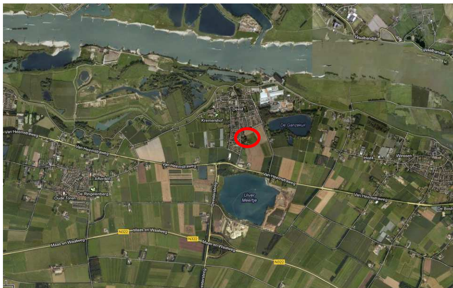
Figuur 1.1: Globale ligging van het plangebied (rode cirkel) in Deest.

Ruimtelijke plannen dienen te worden beoordeeld op de uitvoerbaarheid in relatie tot actuele natuurwetgeving, met name de EHS, Natuurbeschermingswet 1998 en de Flora- en faunawet. Er mogen geen ontwikkelingen plaatsvinden die op onoverkomelijke bezwaren stuiten door effecten op beschermde natuurgebieden en/of flora en fauna. In dit kader is inzicht gewenst in de aanwezige natuurwaarden en de mogelijk daarmee samenhangende consequenties vanuit de actuele natuurwetgeving. Dit wordt gedaan op basis van een quickscan. In deze rapportage zijn de resultaten van de quickscan beschreven. In figuur 1.1 is de globale ligging van het plangebied weergegeven.