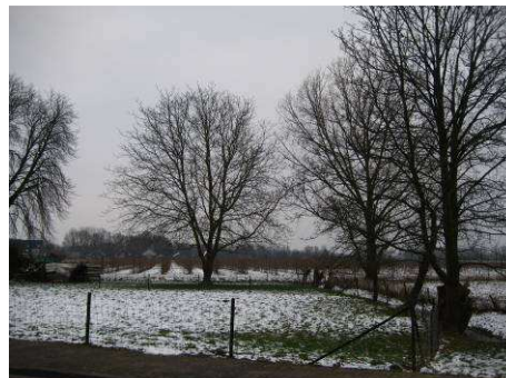
Bomen en grasveld in het plangebied