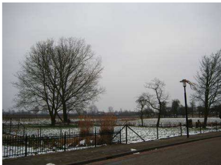
Bomen en grasland in het plangebied

Voor de voorgenomen nieuwbouw zal de vegetatie verwijderd worden en de grond worden ontgraven. Mogelijk zullen er een aantal bomen gekapt worden. Uitgangspunt in deze toets is dat de watergangen langs de randen van het plangebied gehandhaafd blijven en niet worden vergraven.