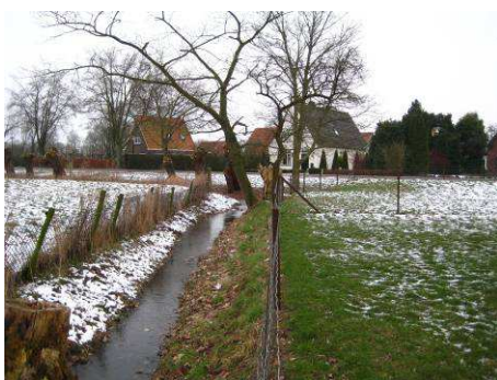
Watergang op grens oost- en zuidzijde van het plangebied