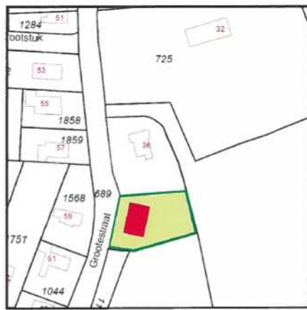
optie 1: plaatsing evenwijdig aan Grotestraat