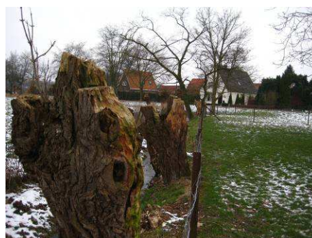
Wilgenstronken op zuidelijke grens van het plangebied