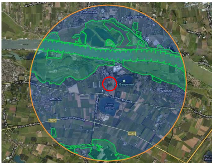
Figuur 5.1. Globale ligging plangebied (rood cirkel) t.o.v. EHS

Er bevindt zich geen EHS binnen het plangebied. In de omgeving van het plangebied zijn wel EHS gebieden gelegen. Het dichtstbijzijnde EHS gebied ligt circa 800 meter ten noorden van het plangebied (zie figuur 5.1). Circa 800 meter ten noorden van het plangebied is het Natura 2000-gebied 'Uiterwaarden Waal' gelegen (zie figuur 5.2).