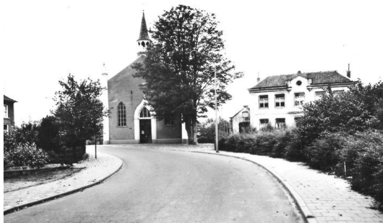
3 – foto van dezelfde kerk rond 1960-1970.

Bij vergelijking van beide foto's is te zien hoe de inrichting van de openbare ruimte is veranderd van uniform naar zones voor voetgangers (stoep) en wegverkeer.