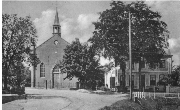
2 – foto van de NH Kerk met pastorie in Druten rond 1920-1930.

eeuw en de eerste helft van de 20 ste eeuw vond verdichting plaats langs de Kattenburg, de Veerstraat en de Hogestraat. Op de overgang Hogestraat/Kattenburg, waar de trechtersvormige aansluiting met winkels, kerk en andere voorzieningen werd bebouwd, ontstond een zekere pleinvorming. De Raadhuisstraat heeft daarmee een ontsluitende functie (gehad) ten behoeve van de Hogestraat.