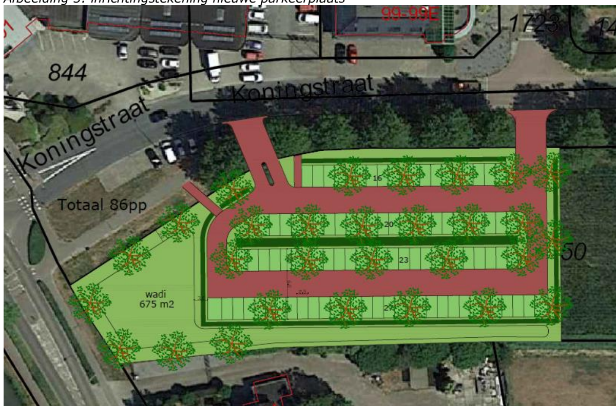
Afbeelding 5: inrichtingstekening nieuwe parkeerplaats

Bovenstaande inrichtingstekening gaat uit van 78 parkeerplekken, op een terrein met twee ontsluitingen. De ontwikkeling gaat uit van een plangebied van circa 4250 m 2 , waarvan minder dan de helft wordt verhard ten behoeve van het verkeer en parkeren. Ruim 2200 m 2 wordt groen ingericht en er komt een wadi voor de opvang van water met een oppervlakte van 623 m 2 . De aanwezige bomen aan de randen van het plangebied blijven zoveel mogelijk behouden. De gasleiding, gelegen aan de westzijde van het plangebied, blijft vrij van bebouwing of verharding.