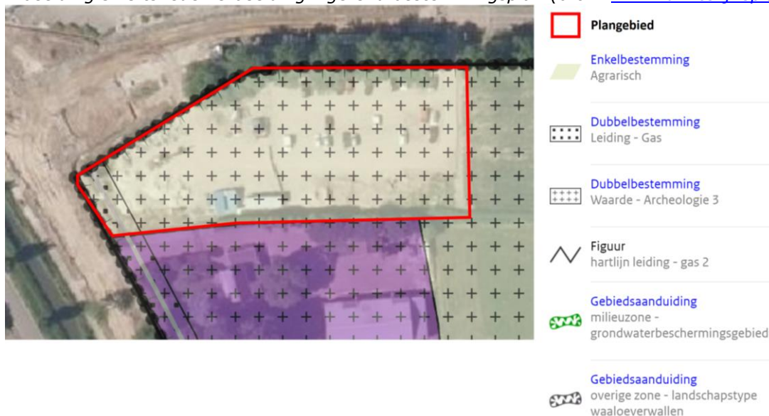
Afbeelding 3: Uitsnede verbeelding vigerend bestemmingsplan

De voor 'Agrarisch' aangewezen gronden zijn bestemd voor: