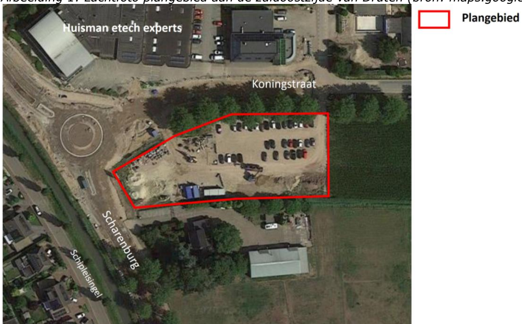
Afbeelding 1: Luchtfoto plangebied aan de zuidoostzijde van Druten

De omgeving van Druten bestaat uit een groen gebied met een landelijke uitstraling. Druten is als kern en gemeente, een onderdeel van het voornamelijk landelijke gebied tussen de rivieren Waal – noordwaarts – en Maas – zuidwaarts. Navolgende afbeelding betreft een luchtfoto.