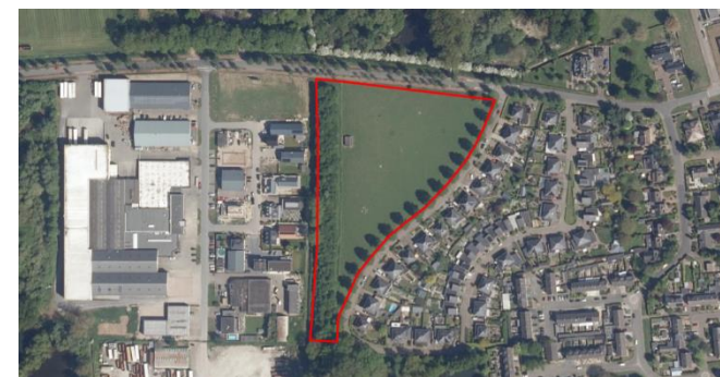
Figuur 1: Luchtfoto plangebied

De regels met betrekking tot de Groene Ontwikkelingszone zijn artikel 2.52 en 2.53. Bij het besluit is een toelichting gepubliceerd en een tabel om de verliesfactor, impactfactor en versterkingsmaatregelen te kwantificeren.