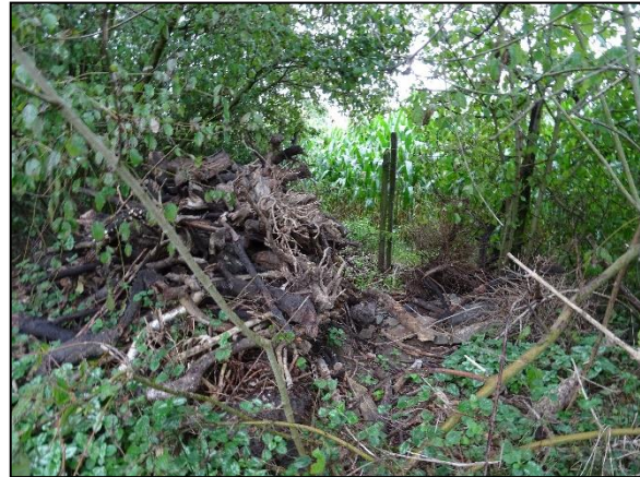
Figuur 10. Takkenril in de groenstrook.

Volgens verspreidingsgegevens van de NDFF zijn er waarnemingen bekend van de steenmarter, bunzing, hermelijn en wezel in de omgeving van de onderzoekslocatie. Steenmarters gebruiken hoozolders, loze ruimtes onder het dak, schuurtjes en dergelijke, oude hopen van onder andere konijnen en takkenrillen als verblijfplaats. Een steenmarter heeft binnen zijn territorium verscheidene verblijfplaatsen. Kleine marterachtigen als bunzing, hermelijn en wezel maken gebruik van oude hopen van onder andere mollen en muizen, maar ook houtwallen, steenhopen en ruimtes onder boomwortels. De groenstrook aan de oostzijde van de onderzoekslocatie vormt geschikt habitat voor zowel de steenmarter als kleine marterachtigen. Tijdens het veldbezoek is er een takkenril waargenomen en geschikte hopen die kunnen dienen als potentiële verblijfplaatsen voor marterachtigen (zie figuur 10). Tevens is er voldoende beschutting, waardoor marterachtigen zich makkelijk kunnen verplaatsen. Echter zijn er geen sporen, zoals uitwerpselen of prooiresten, aangetroffen die duiden op het gebruik van de onderzoekslocatie als vaste rust- en verblijfplaats door deze soorten. Indien de huidige groenstrook niet behouden blijft bij de voorgenomen plannen zal nader onderzoek moeten uitwijzen of marterachtigen daadwerkelijk gebruik maken van de groenstrook aan de oostzijde van de onderzoekslocatie (zie hoofdstuk 6).