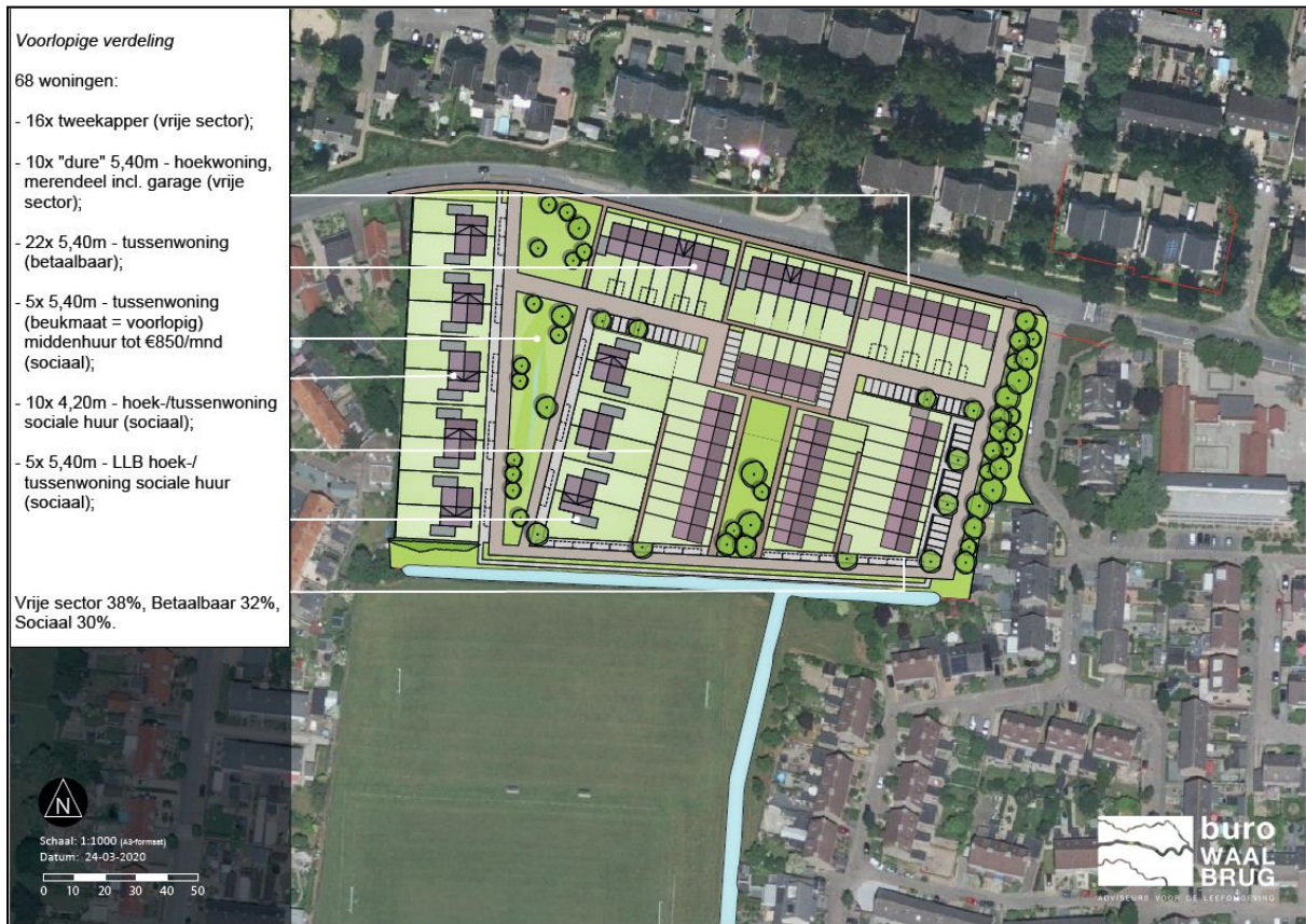
Figuur 9. Toekomstige situatie onderzoekslocatie (bron: Buro Waalburg).