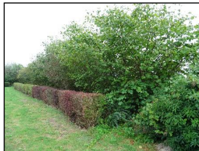
Figuur 7. Oostzijde onderzoekslocatie met aangrenzend groenstrook.