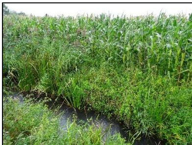
Figuur 6. Zuidzijde onderzoekslocatie met aangrenzend watergang.