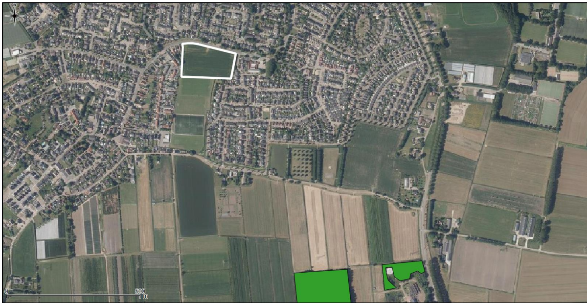
Figuur 12. Ligging onderzoekslocatie ten opzichte van het Natuurnetwerk Nederland.

De onderzoekslocatie maakt geen deel uit van het Natuurnetwerk. De onderzoekslocatie ligt ook niet in de nabijheid van een gebied, behorend tot het Natuurnetwerk Nederland. Het meest nabijgelegen gebied bevindt zich circa 770 meter ten westen van de onderzoekslocatie. Het betreft het habitatype vochtig bos met productie. In figuur 12 is de ligging van de onderzoekslocatie ten opzichte van het Natuurnetwerk Nederland weergegeven.