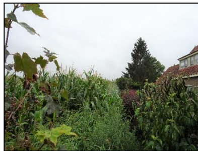
Figuur 4. Noordwestzijde onderzoekslocatie met aangrenzend diverse tuinen.