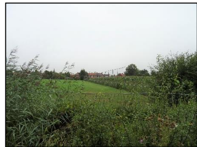
Figuur 5. Zuidzijde onderzoekslocatie met sportvelden.