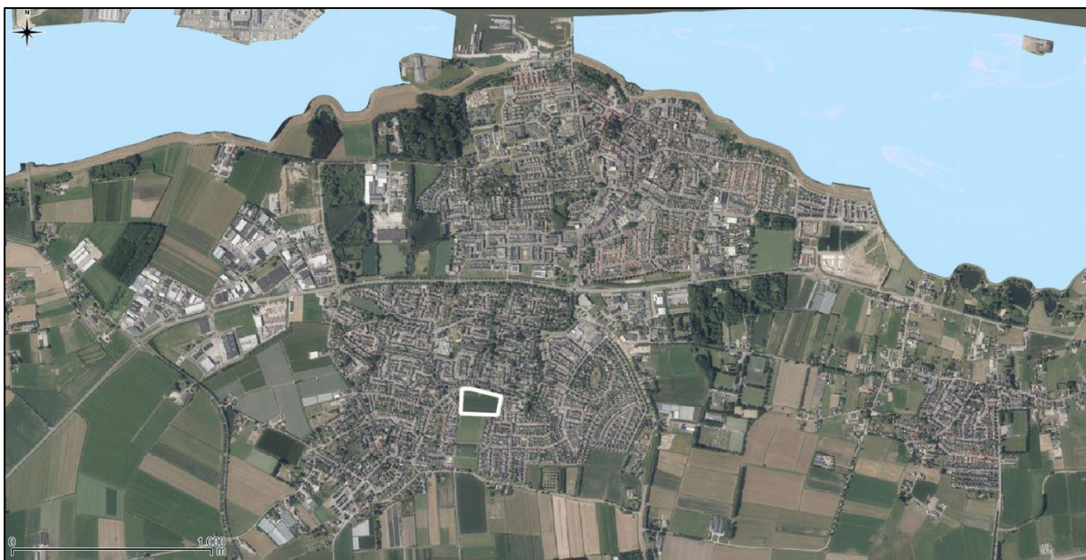
Figuur 11. Ligging onderzoekslocatie ten opzichte van Natura 2000.

De onderzoekslocatie is niet gelegen binnen de grenzen, of in de directe nabijheid van een gebied dat aangewezen is als Natura 2000. Het meest nabijgelegen Natura 2000-gebied, Rijntakken, bevindt zich op circa 1,5 kilometer afstand ten noorden van de onderzoekslocatie (zie figuur 11).