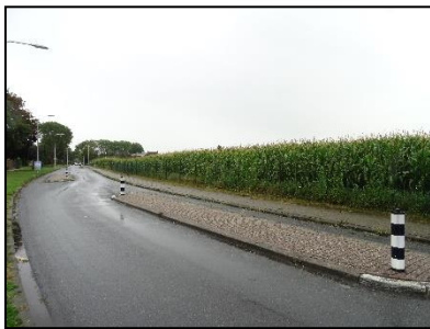
Figuur 3. Noordzijde onderzoekslocatie met Koningsweg.