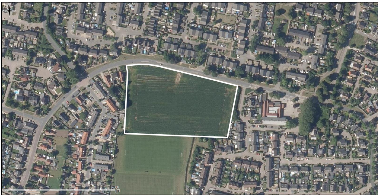
Figuur 2. Luchtfoto onderzoekslocatie en directe omgeving.