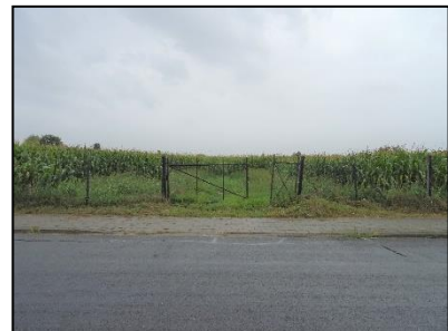
Figuur 8. Noordzijde onderzoekslocatie met toegangspoort naar maïsakker.